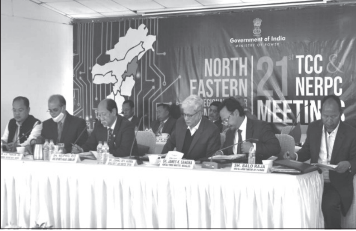
কোহিমাতে ২১তম টিসিসি এবং এনইআরপিসি এর বৈঠকে যোগ দেন ত্রিপুরা উপমুখ্যমন্ত্রী তথা বিদ্যুৎমন্ত্রী যীশু দেববর্ম।