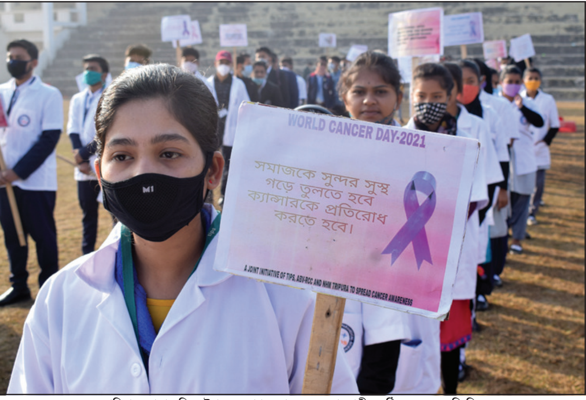
বৃহস্পতিবার ক্যান্সার দিবস উপলক্ষে আগরতলায় সচেতনতা রানী অনুষ্ঠিত হয়েছে।

একজন প্রতিনিধি থাকার বিষয়েও বিবেচনা করা হবে বলে মনে করা হচ্ছে। কেন্দ্রীয় নেতৃত্বের সিদ্ধান্তের ভিত্তিতে মন্ত্রীর সংখ্যা চূড়ান্ত করা হবে। জানা গিয়েছে, দেবের হাইকমান্ড নাকি কিছু মন্ত্রীর পারফরম্যান্সে সন্তুষ্ট নন এবং তারা মন্ত্রিসভায় নতুন মুখ স্থান দেওয়ার চিন্তাভাবনা করেছেন। দলীয় হাইকমান্ড মুখ্যমন্ত্রী বিপ্লব কুমার দেবকে ইঙ্গিত দিয়ে আগামী কয়েক দিনের মধ্যে মন্ত্রিসভা রদবদল করা হবে বলেও ধারণা করা হচ্ছে। এদিকে, সাবেক স্বাস্থ্যমন্ত্রী সূদীপ রায় বর্মনসহ বিদ্রোহী বিধায়কদের একটি অংশ মন্ত্রিসভায় স্থান নিতে আপত্তি জানাতে পারেন বলে আশঙ্কা করা হচ্ছে। বিজেপির সর্বভারতীয় সভাপতি জেপি নড্ডার উপস্থিতিতে কেন্দ্রীয় সরাষ্ট্রমন্ত্রী এর আগে মুখ্যমন্ত্রীর সাথে বৈঠক করেছেন। মন্ত্রীর তালিকা এবং তাদের দেওয়া পোর্টফোলিও চূড়ান্ত করে জানিয়ে দেন।