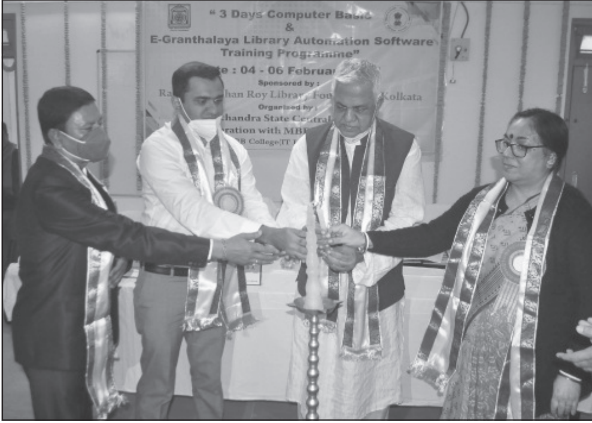
বৃহস্পতিবার এমবিবি কলেজে ই-গ্রন্থালয় এর উপ প্রশিক্ষণ কর্মসূচির সূচনা করা হয়েছে।