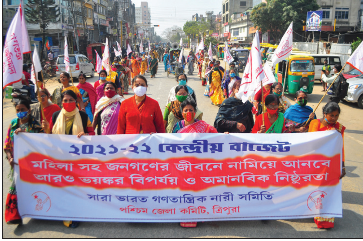
বৃহস্পতিবার আগরতলায় গণতান্ত্রিক নারী সমিতির মিছিল কেন্দ্রীয় বাজেটের প্রতিবাদে। ছবি নিজস্ব।