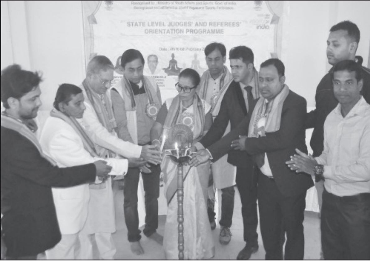
তিনদিন ব্যাপী রাজ্যস্তরীয় বিচারক ও রেফারীদের প্রশিক্ষণ শিবির শুরু হয় আগরতলায়।