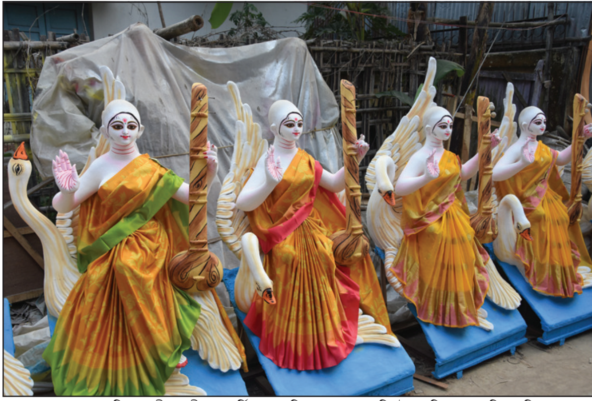
দৌরগোড়ায় বিদ্যার দেবী সরস্বতী পূজা। মূর্তি পাড়ায় প্রতিমায় চলছে শেষ তুলির টান। শনিবার তোলা নিজস্ব ছবি।