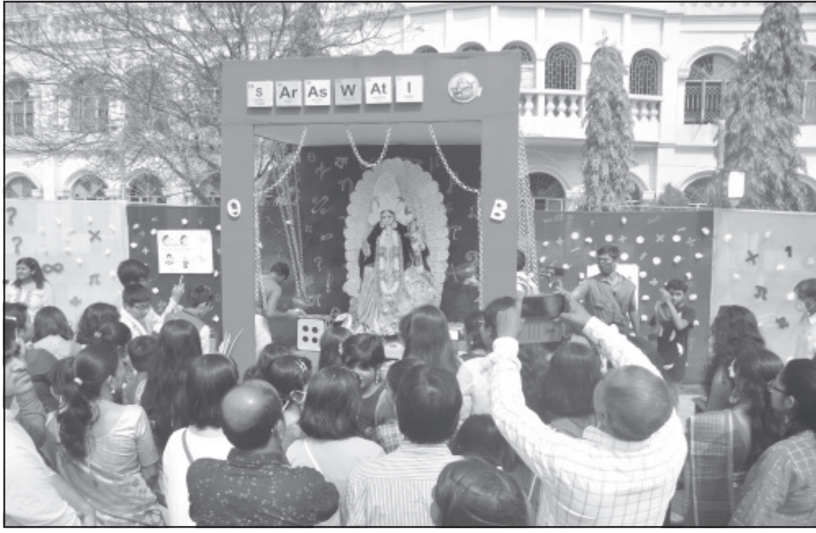
মঙ্গলবার গোটী রাজোই উৎসাহের সাথে সরস্বতী পূজায় মেতে উঠেন ছাত্রী থেকে শুরু করে বিভিন্ন অংশের মানুষ।