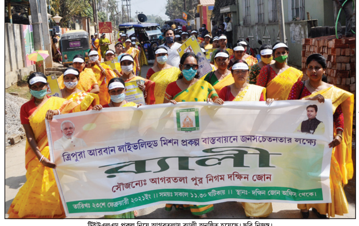
টিউএলএম প্রকল্প নিয়ে আগরতলায় র্যালী অনুষ্ঠিত হয়েছে।

উল্লেখ্য, কয়েকদিন আগে বিবিসির তরফে এক রিপোর্টে দাবি করা হয়, বন্দিশিবিরে থাকা মুসলিম মহিলাদের উপর পরিকল্পনা করে ধর্ষণ ও যৌন নির্যাতন চালাচ্ছে চিন। সেই রিপোর্টকে ঘিরে উদ্বেগ প্রকাশ করেছে আমেরিকা। এর আগেও শোনা গিয়েছিল, মুসলিম মহিলাদের জোর করে অপারেশন করে বন্ধ্যা করে দেওয়া হচ্ছে কিংবা গর্ভপাত করানো হচ্ছে। আন্তর্জাতিক মঞ্চে সমালোচিত হলেও তা নিয়ে বিশেষ হেলাদোল নেই প্রেসিডেন্ট শি জিনপিংয়ের। মানবাধিকার সংগঠন অ্যামেনেস্টি ইন্টারন্যাশনাল দেশগুলির সংগঠন সবারই এই বিষয়ে বেজিংয়ের বিরুদ্ধে তোল দাগলেও লাভ হয়নি কোনও।