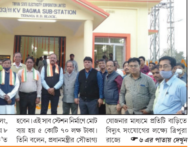
আঠারোভোলা, গর্জনমুড়া, খুপিলং, কড়িয়ামুড়া ইত্যাদি এলাকার প্রায় ৮ হাজার ৪৯০ পরিবার উপকৃত হবেন। এই সাব স্টেশন নির্মাণে মোট ব্যয় হয় ৫ কোটি ৭০ লক্ষ টাকা। তিনি বলেন, প্রধানমন্ত্রীর সৌভাগ্য