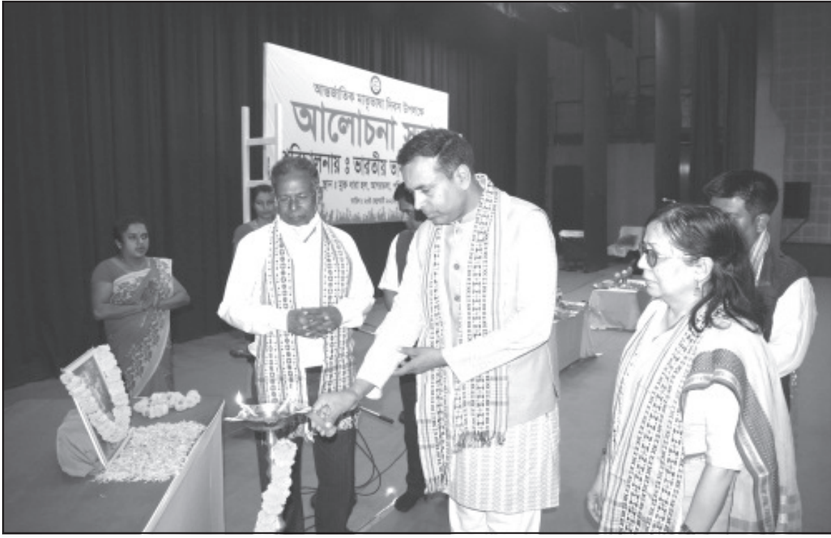
আন্তর্জাতিক মাতৃভাষা দিবস উপলক্ষে আলোচনা সভা অনুষ্ঠিত হয়।