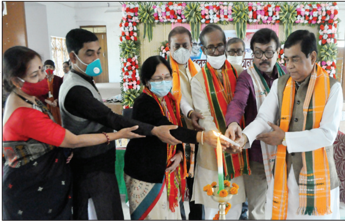
মেঘা অম্বা পুরস্কার বিতরণী অনুষ্ঠান মঙ্গলবার আগরতলায় অনুষ্ঠিত হয়েছে।