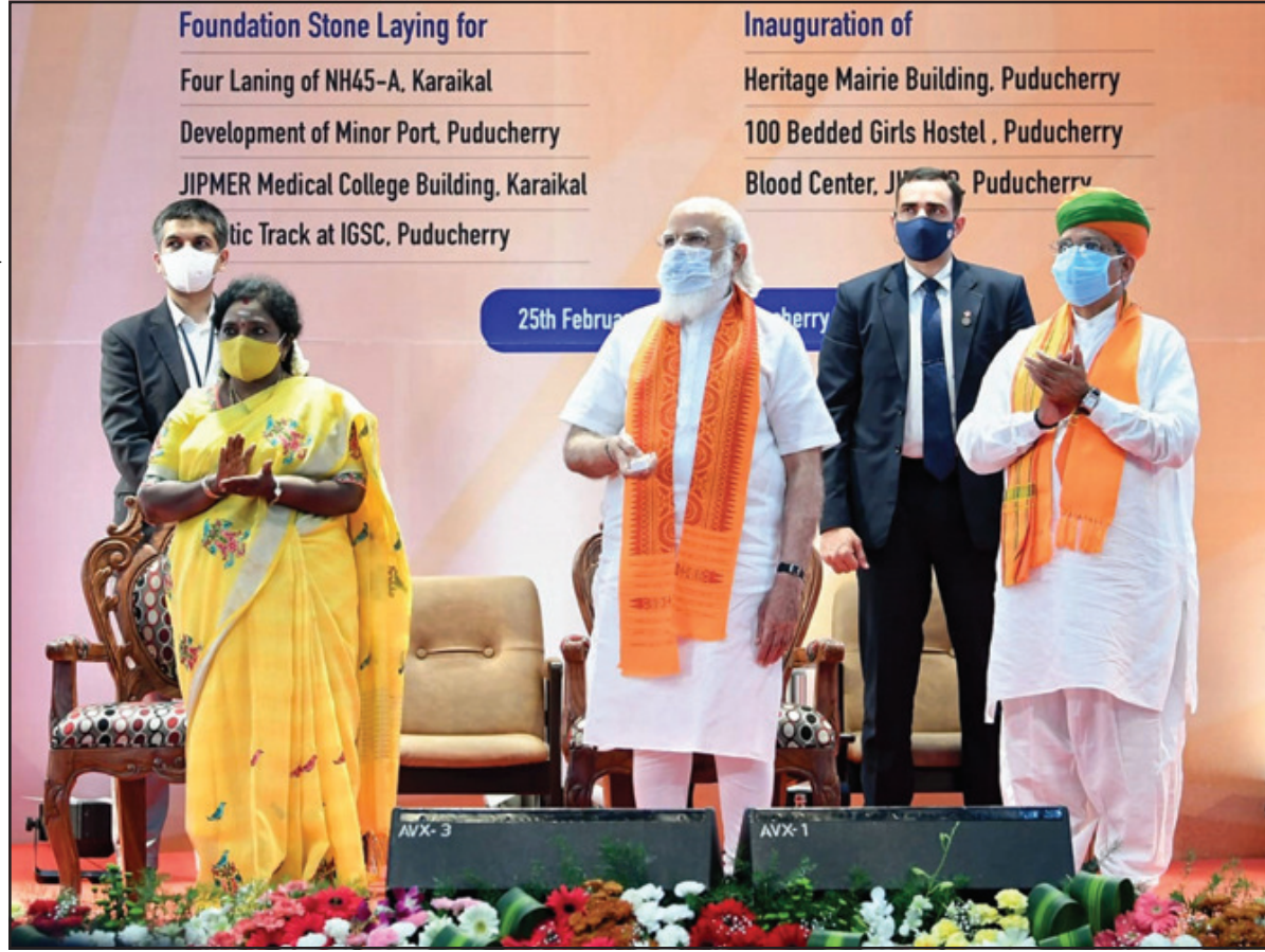
পুদুচেরিতে একাধিক প্রকল্পের উদ্বোধন ও শিলান্যাস করেছেন প্রধানমন্ত্রী নরেন্দ্র মোদি।