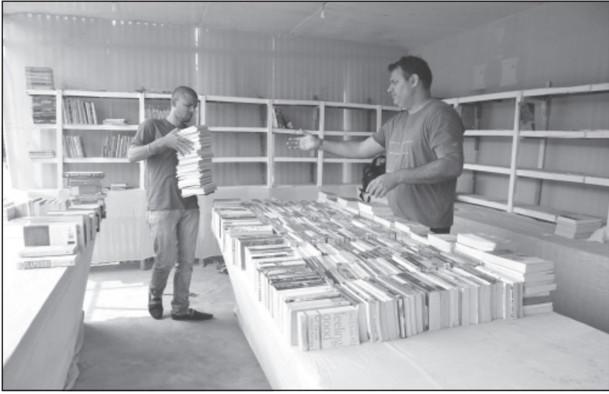
আগরতলার বইমেলা শুরু শুক্রবার। জোয়ারদ প্রস্তুতি। ছবি: ঞিজ্ঞ