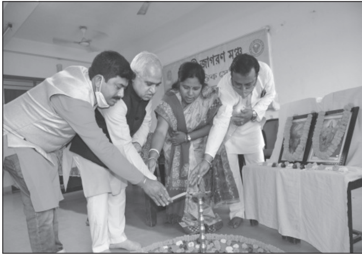
স্বদেশী জাগরণ মঞ্চ সেমিনার অনুষ্ঠিত হয়েছে আগরতলায়।