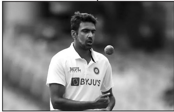
ছবি পোস্ট করেন তিনি। ম্যাঞ্চ, গ্যাং। অশ্বিন রবিচন্দ্রন অশ্বিন, বিরাট, লোকেশ রাহুল-সহ আরও অনেকে এক সঙ্গে বসে আড্ডা দিচ্ছেন। সেই ছবির তলায় লেখা, "মাফিয়া

নয়াদিল্লি, ২৮ ফেব্রুয়ারি। মোতেরা টেস্ট শেষ ২ দিনে। হাতে বেশ কিছু দিন অতিরিক্ত সময় পাওয়া গিয়েছে শেষ টেস্টের আগে। নিজেদের মধ্যে বন্ধনটাকে আরও শক্ত করতে সেই সময়টাকেই যেন কাজে লাগাচ্ছেন বিরাট কোহালিরা। ম্যাঞ্চ আগরওয়ালকে দেখা গেল তেমনই একটি ছবি ইনস্টাগ্রামে সমর্থকদের সঙ্গে ভাগ করে নিতে। এখনও অবধি ইংল্যান্ডের বিরুদ্ধে এই সিরিজ প্রথম একাদশে সফো পাননি ম্যাঞ্চ। ভারতীয় ওপেনার অপেক্ষায় রয়েছেন। তবে তার মাঝেই একটি