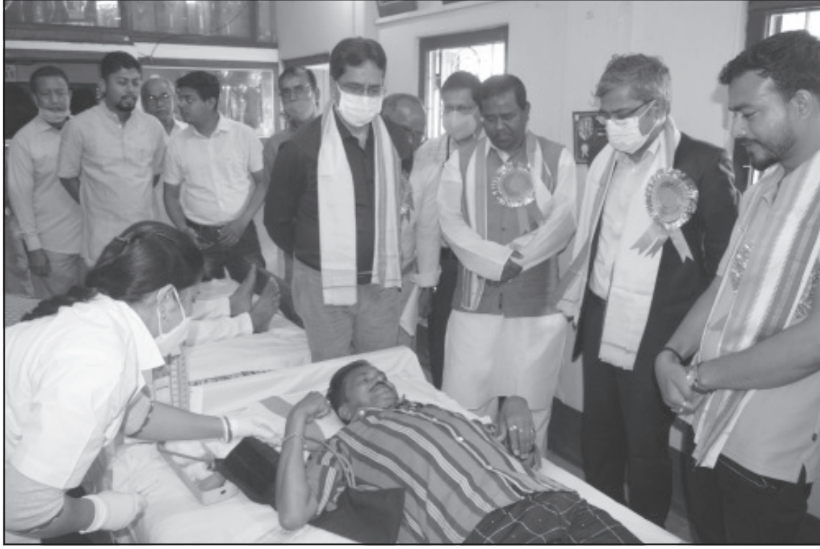
কুঞ্জবন সেবক সংঘের উদ্যোগে আয়োজিত রক্তদান শিবির পরিদর্শন করেন বিজেপির সভাপতি ডাঃ মানিক সাহা।