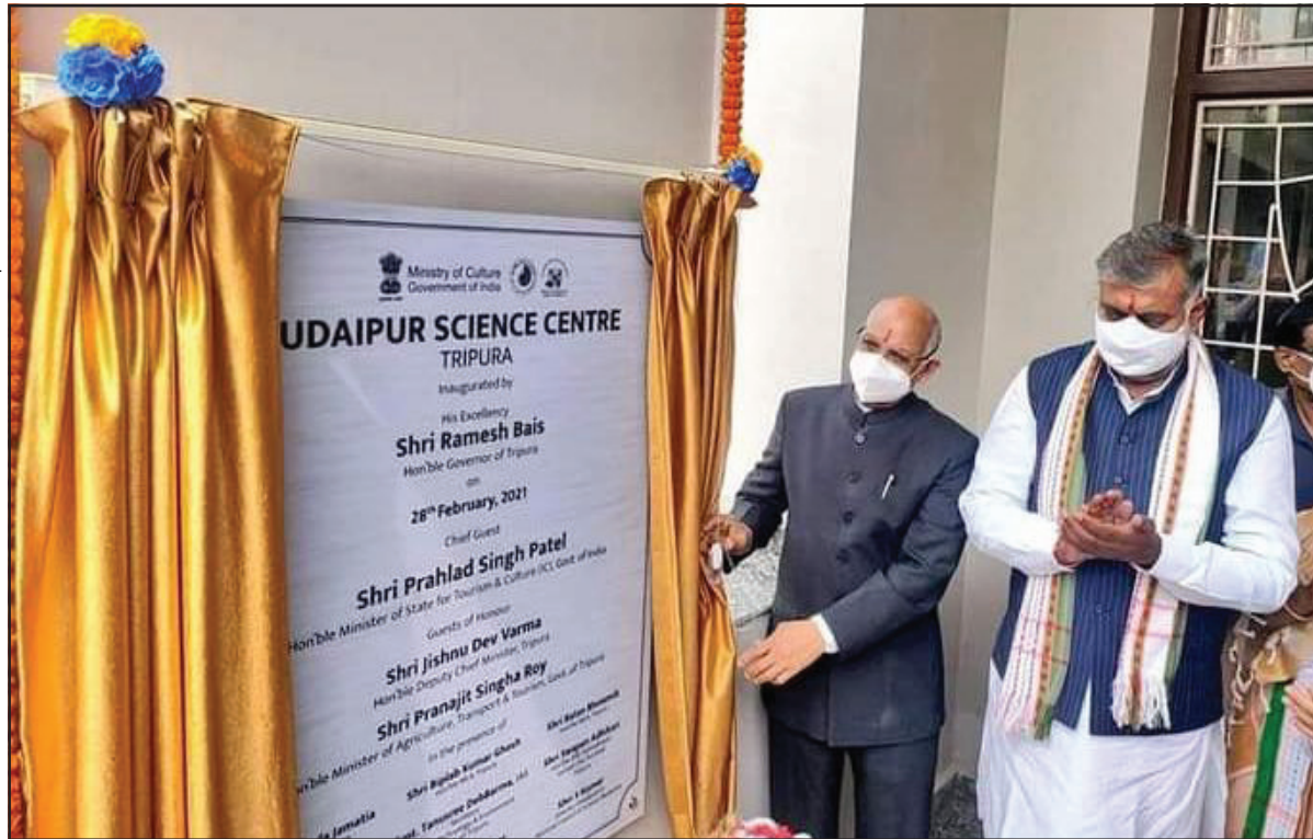
রবিবার উদয়পুর সায়েন্স সেন্টারের উদ্বোধন করেন রাজ্যপাল রমেশ বৈশ এবং সাথে ছিলেন কঙ্গ্রী সংস্কৃতি ও পর্যটন দপ্তরের রাজ্যমন্ত্রী প্রহ্লাদ সিং প্যাটেল।