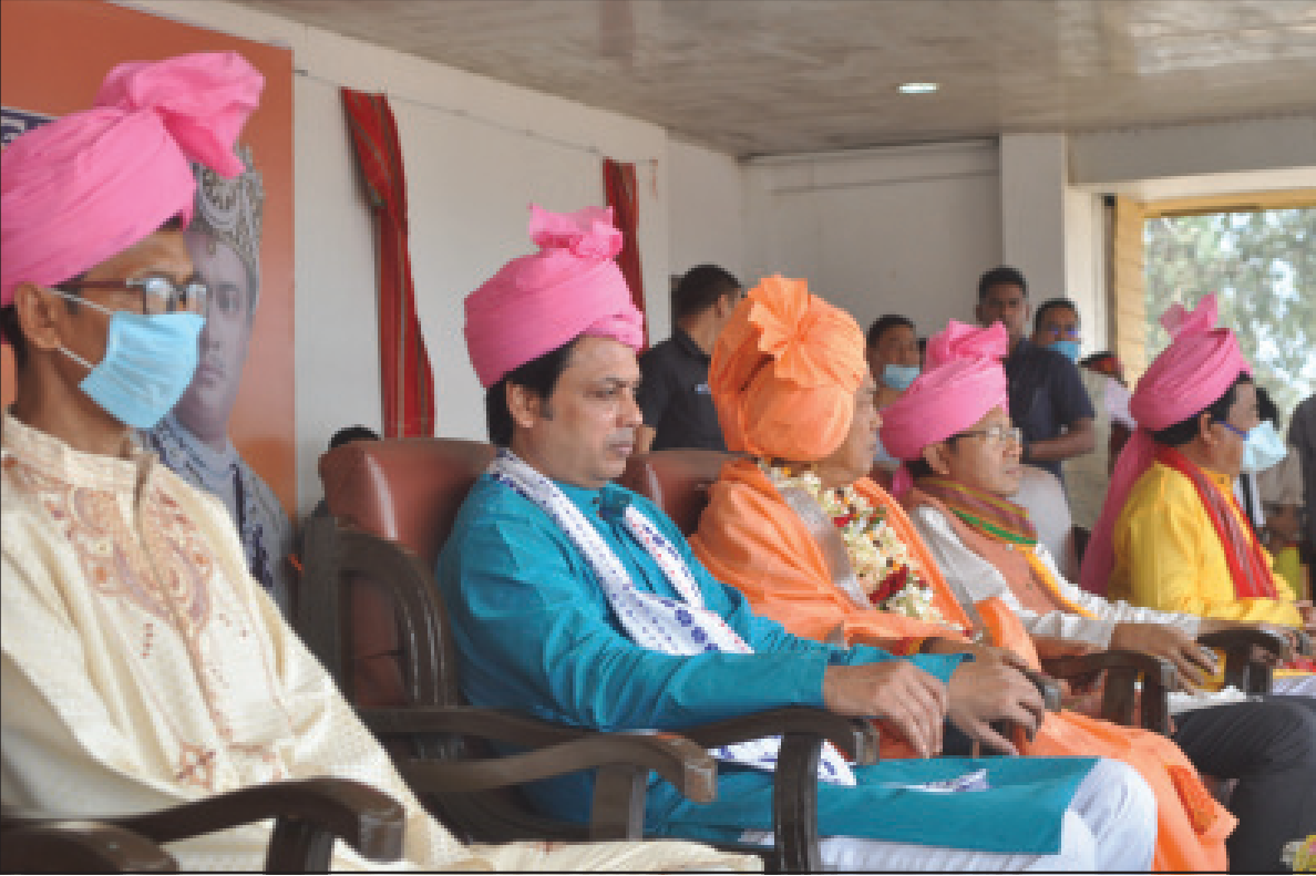
স্বামী বিবেকানন্দ ময়দানে ত্রিপুরা ক্ষত্রিয় সমাজের প্রধান সমাজপতিদের সম্মাননা প্রদান অনুষ্ঠানে মুখ্যমন্ত্রী বিপ্লব কুমার দেব।