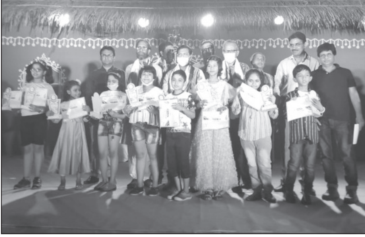
করোনা পরিস্থিতিতে অল প্রিন্সপাল মার্চের আগ্রাসিবেশনের অনলাইনে আর্কা প্রতিযোগিতা অনুষ্ঠিত করেছিল। আজ পুরস্কার বিতরণ করে।