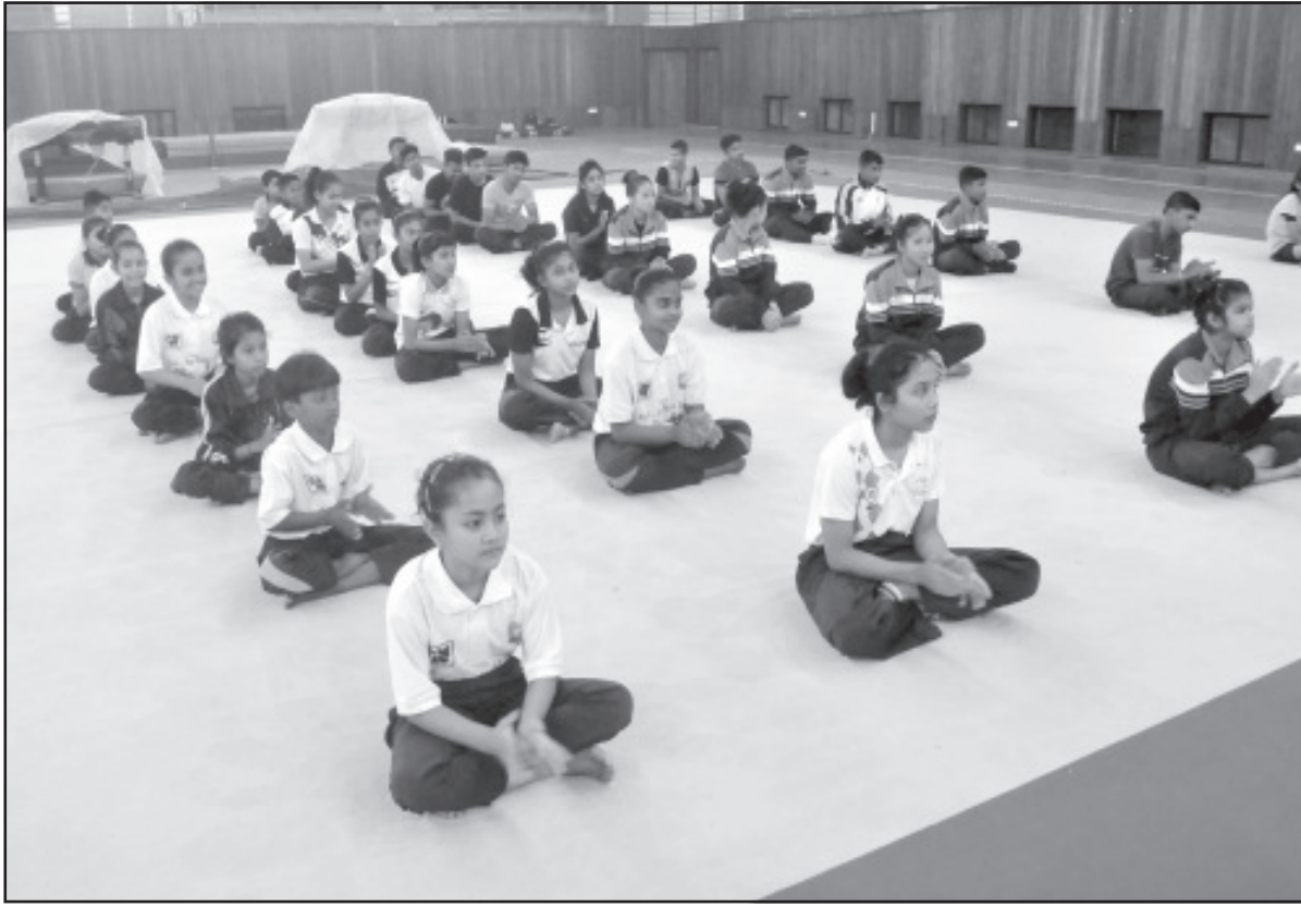
সোমবার এনআরসিসিতে রাজ্যভিত্তিক জিননাস্টিক প্রতিযোগিতা শুরু হয়েছে। ছবি নিজস্ব।