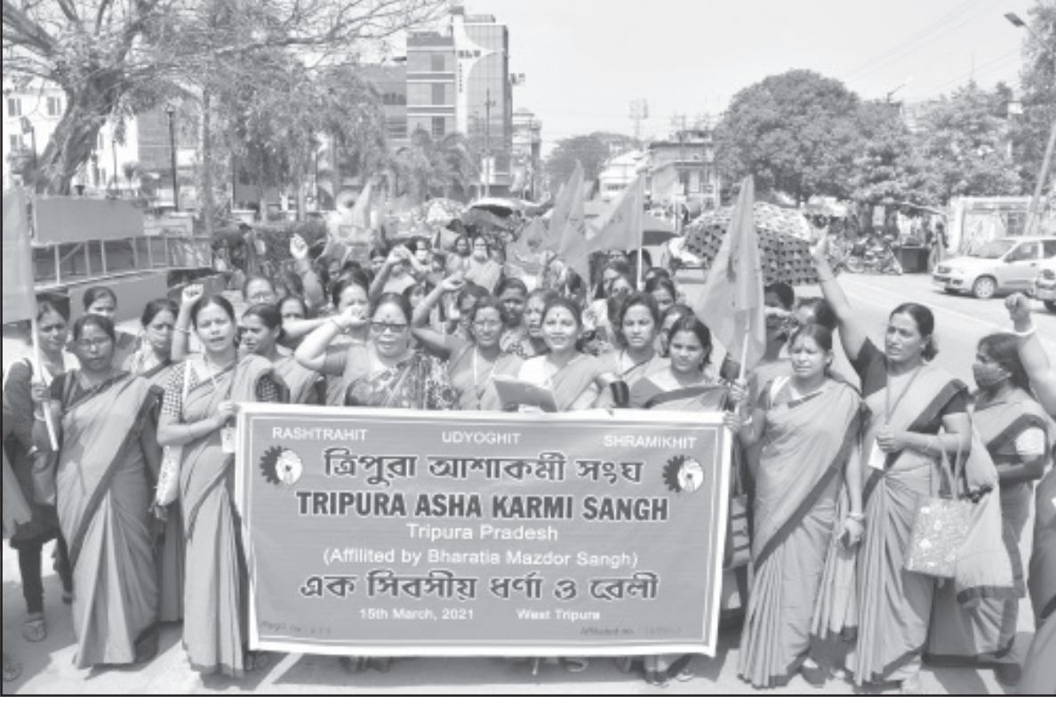
সোমবার আগরতলায় আশা কর্মীদের ধর্গা ও রেলি কর্মসূচি।