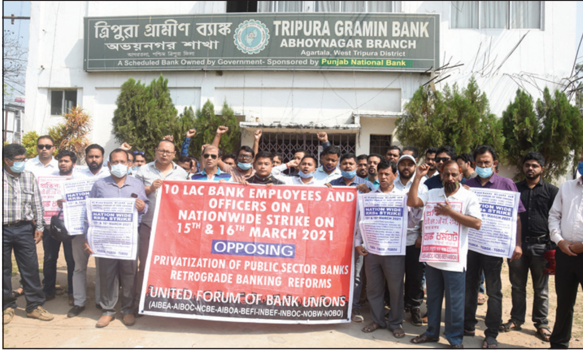
আগরতলায় ব্যাংক কর্মীদের প্রতিবাদ ধর্ম।