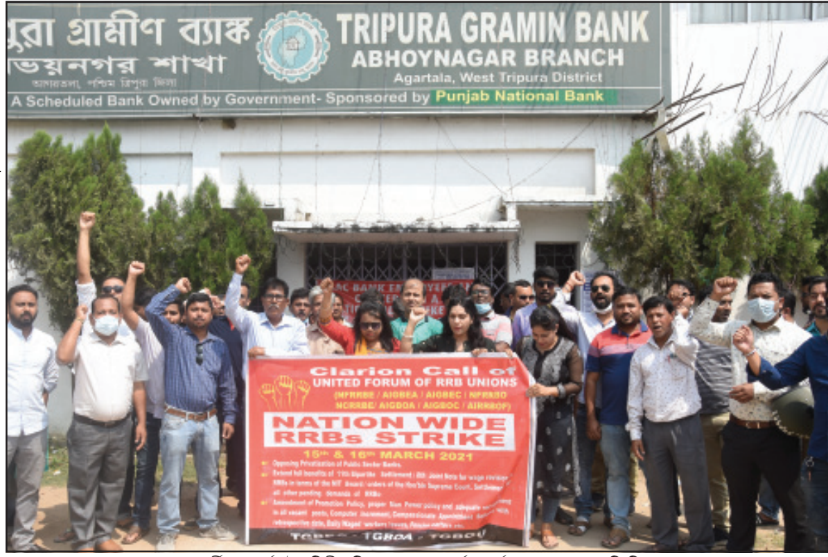
ব্যাঙ্ক কর্মীদের ধর্মঘটের দ্বিতীয় দিন মঙ্গলবারও ধর্ম প্রদর্শন করা হয়েছে।