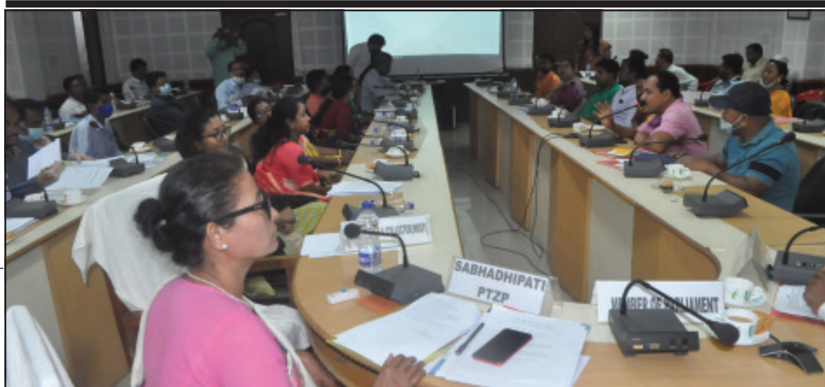
মঙ্গলবার পশ্চিম জেলা জিলাপরিষদের বিশেষ সাধারণ সভা অনুষ্ঠিত হয়েছে।