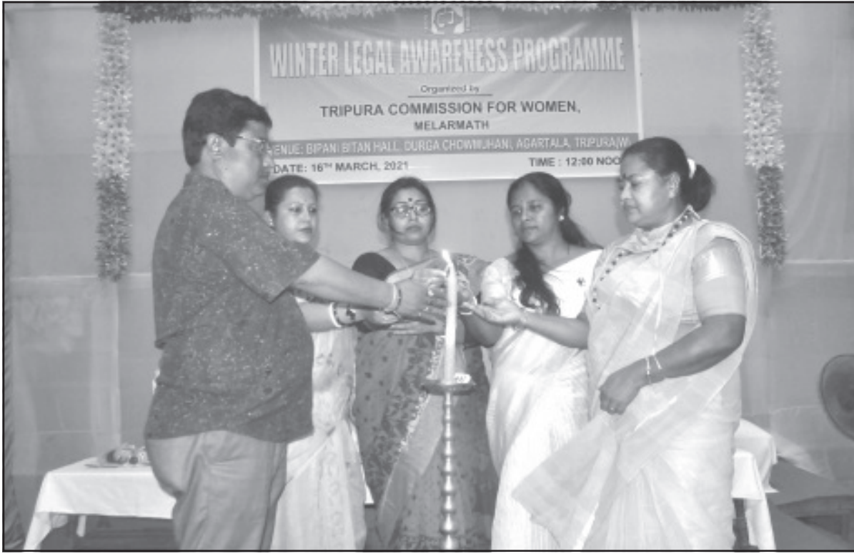
মহিলা কমিশনের উদ্যোগে আইন সচেতনতা শিবির অনুষ্ঠিত হয়েছে আগরতলায়।