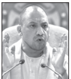
করে বহু মানুষ যোগীর সভায় হাজির হন।

সঙ্গে জড়িয়ে আছে। তিনি বলেন মৌদীজি গরীবের পয়সা যাতে গরিবের কাছে যায় তার জন্য জনসভা অ্যাকাউন্ট খুলে দিয়েছেন। এরাজ্যের তৃণমূল কংগ্রেস সরকার এটো বন্ধ করে দিয়েছে কারণ তাদের দোকানদারি বন্ধ হয়ে যাবে? তারা বেহেজাজ হয়ে যাবে। তাই সভায় উপস্থিত জনতার উদ্দেশ্যে তিনি বলেন, এইজন্যই ভারতীয় জনতা পার্টিতে এখানে আনতে হবে। এদিন চড়া রোদ উপেক্ষা