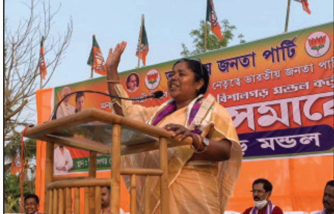
মুখ্যমন্ত্রী বিপ্লব কুমার দেব এর নেতৃত্বে বিজেপি সরকারের তিন বছর পূর্তি উপলক্ষে উন্নয়নের বার্তা নিয়ে বিশালগড় মন্ডল এর উদ্যোগে