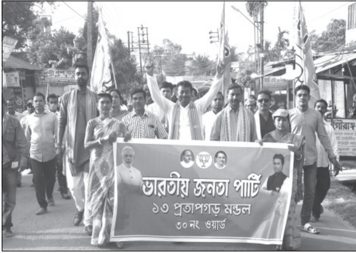
বিজেপি প্রতাপগড় মন্ডলের উদ্যোগে রাজ্য সরকারের তিন বছর পূর্তি উপলক্ষে র্যালি।