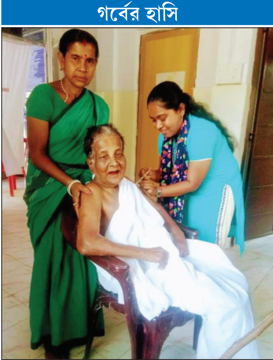
আমাদের টিকা আমাদের গৌরব।। দক্ষিণ জেলার বাইখোরায় এক প্রবীণ নাগরিককে টিকা প্রদান করেন আশাকর্মী এবং কমিউনিটি হেলথ অফিসার।