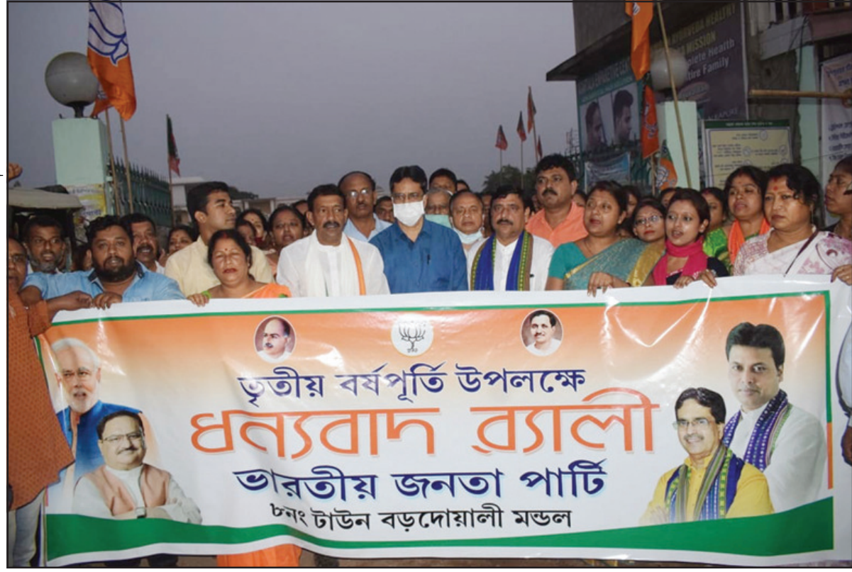
রাজ্য সরকারের তৃতীয় বর্ষপূর্তি উপলক্ষে বড়দোয়ালী বিজেপি বড়দোয়ালী মন্ডলের উদ্যোগে ধন্যবাদ ব্যালী করা হয়।