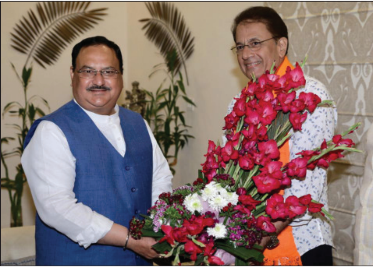
বৃহস্পতিবার রামায়ণ টিভি সিরিয়েলের রাম চরিত্রাভিনেতা অরুণ গোভিলকে দলে বরণ করেন নেন বিজেপি সভাপতি জে পি নাড্ডা।