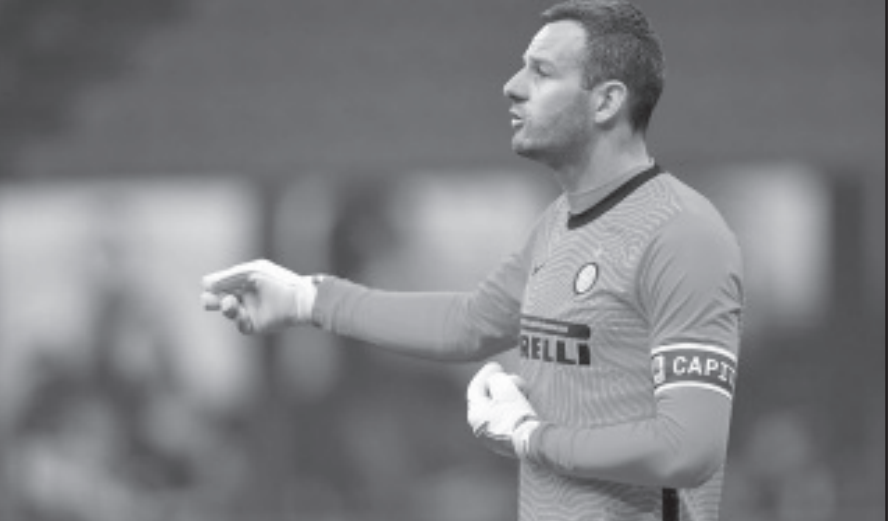
খেলেছেন দলের প্রতিটা ম্যাচ। ১১ জয়ের দৌড়ে এগিয়ে রয়েছে মিলানের চেয়ে ৯ পয়েন্টে এগিয়ে ইন্টার। দ্বিতীয় স্থানে থাকা এপি রয়েছে তারা।