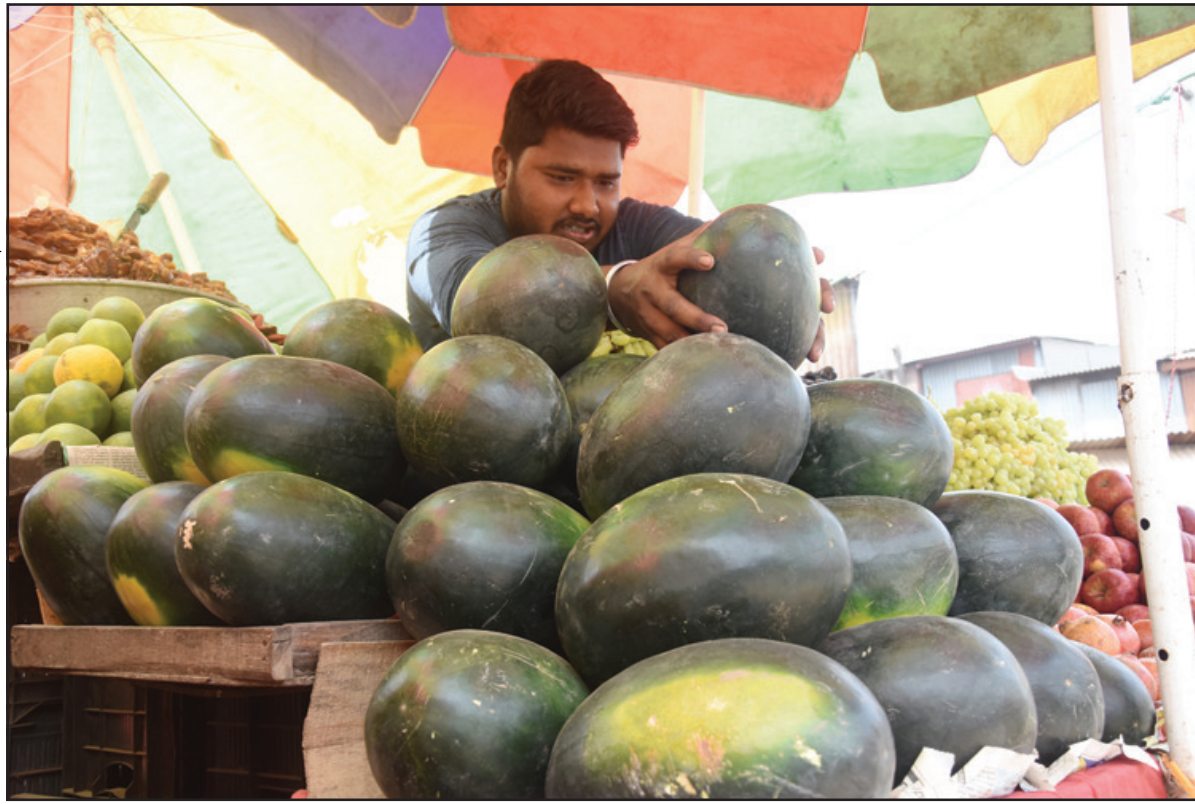
বাজারে এসে গিয়েছে গরমের অন্যতম সেরা ফল তরমুজ। রাজধানী আগরতলায় শনিবার তোলা নিজস্ব ছবি।