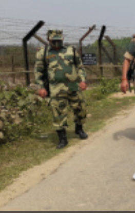
আগরতলা, ২০ মার্চ (হি.স.)।। গরু পাচারের সময় বিএসএফ-এর গুলিতে এক পাচারকারীর মৃত্যু হয়েছে।

বিএসএফ-এর দাবি, আত্মরক্ষায় পাম্প অ্যাকশন গান থেকে গুলি ছুঁড়তে হয়েছে। নয়তো পাচারকারীদের হামলায় এক জওয়ান শহিদ হয়ে যেতেন। ওই ঘটনার উত্তর ত্রিপুরা জেলায় কদমতলায় ভারত-বাংলাদেশ সীমান্তে উত্তেজনা বিরাজ করছে। বিএসএফ ত্রিপুরা ফ্রন্টিয়ারের জনসংযোগ অফিসে ১২-১৫ জন এবং বাংলাদেশের অংশে ১০-১২ জন পাচারকারী গরু পাচারের সময় বিএসএফ-এর নজরে আসে। তিনি বলেন, ওই পাচারকারীদের মধ্যে কয়েকজন কীটাতারের বেড়া কেটে গরু বাংলাদেশে নেওয়ার চেষ্টা করছিল। বিএসএফ জওয়ানরা তাদের বাধা দিতে গেলে পাচারকারীরা দা, লাঠি দিয়ে হামলা