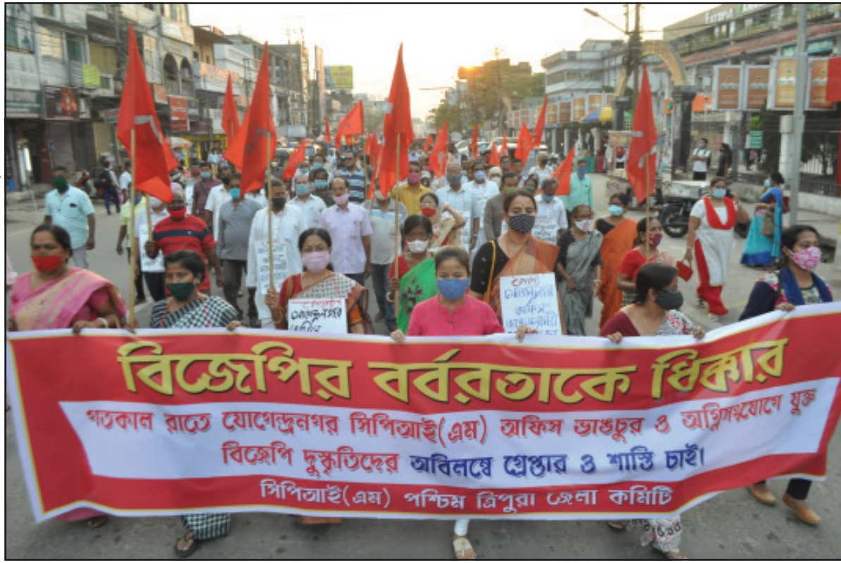
যোগেন্দ্রনগর সিপিএম পার্টি অফিসে ভাঙার ও অগ্নিসংযোগের প্রতিবাদে মঙ্গলবার আগরতলায় মিছিল। ছবি নিজস্ব।