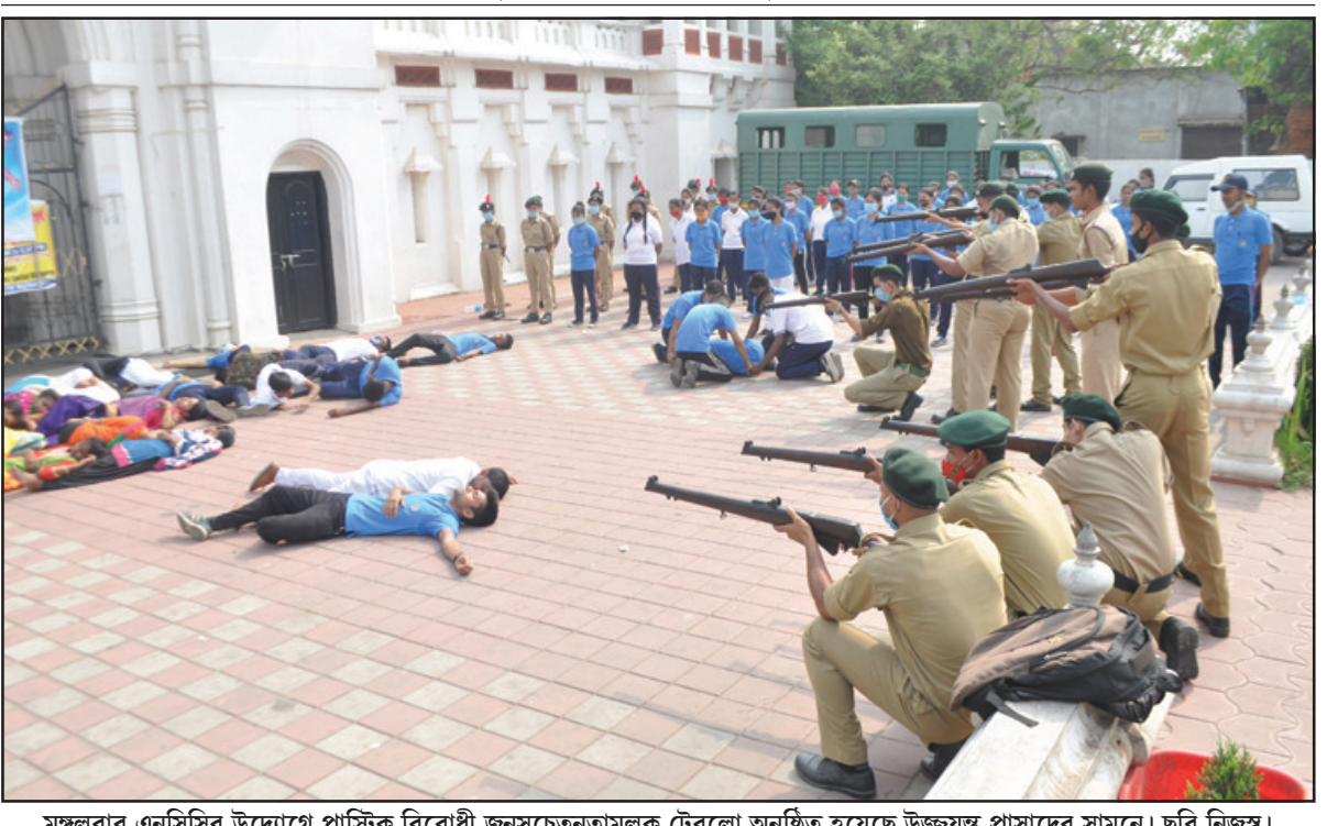
মঙ্গলবার এনসিসির উদ্যোগে প্রাক্টিক বিরোধী জনসচেতনতামূলক টেনবো অনুষ্ঠিত হয়েছে উজ্জয়ন্ত প্রাসাদের সামনে।