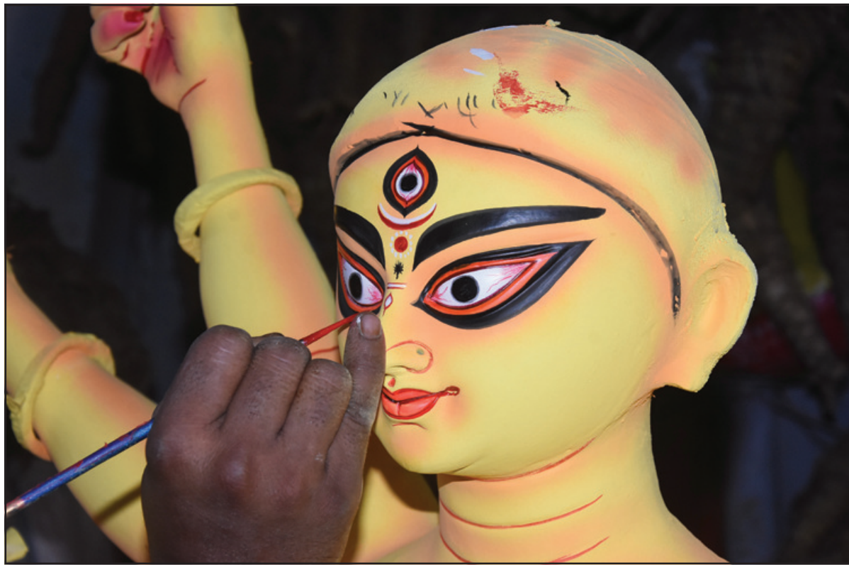
দেবী বাসন্তীর প্রতিমায় চলছে শেষ পর্যায়ের তুলির টান। মঙ্গলবার আগরতলায় তোলা নিজস্ব ছবি।