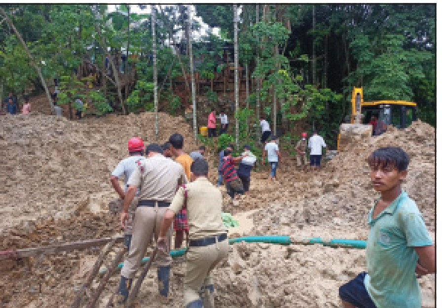
শান্তিরবাজারে মাটি চাপায় এক শ্রমিকের মর্মান্তিক মৃত্যু।