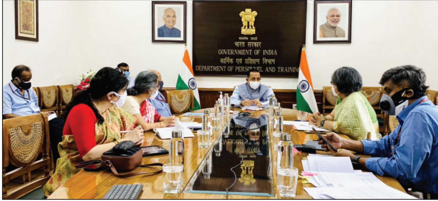
মঙ্গলবার নয়াদিল্লীতে ডেতার মন্ত্রী জিতেন্দ্র সিং অন্যান্য দপ্তরের আধিকারীকদের নিয়ে কোভিড পরিস্থিতি নিয়ে পর্যালোচনা বৈঠক করেছেন।