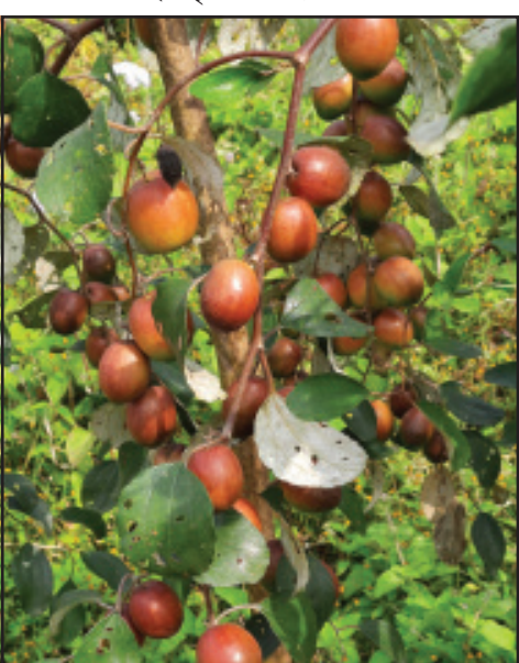
আগামী বছর দ্বিগুণ ফল মিলবে বলে দৃঢ় প্রত্যয়ের সুরে দাবি করেন। তিনি বলেন, এই ফল ত্রিপুরায় আগে অনেকেই