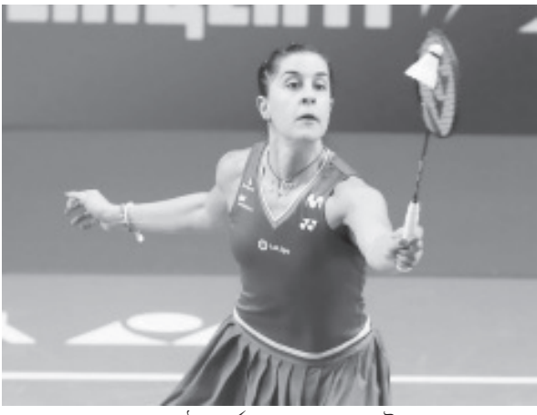
দ্রুত পুরো সুস্থ হয়ে ওঠা কার্যত অসম্ভব। যে কারণে তাঁর আর টোকিয়ো অলিম্পিকে নামা হবে না। স্বভাবতই হতাশ স্পেনের তারকা শাটলার। মঙ্গলবার টুইট করে একটি বিবৃতি পোস্ট করেছেন।

নয়াদিঘি, ১ জুন (হি.স.): টোকিয়ো অলিম্পিক থেকে নাম তুলে নিলেন গত বছরের অলিম্পিকে সোনার পদক জয়ী শাটলার ক্যারোলিনা মারিন। বলা ভালো নাম তুলে নিতে বাধ্য হলেন চোট সমস্যায় জেয়বার ক্যারোলিনা। ক্যারোলিনা নিজেই জানিয়েছেন, এই সপ্তাহে তাঁর হাঁটুর চোটের জয়গায় অস্ত্রোপচার হবে। তাই তিনি আর টোকিয়োতে নামতে পারবেন না।