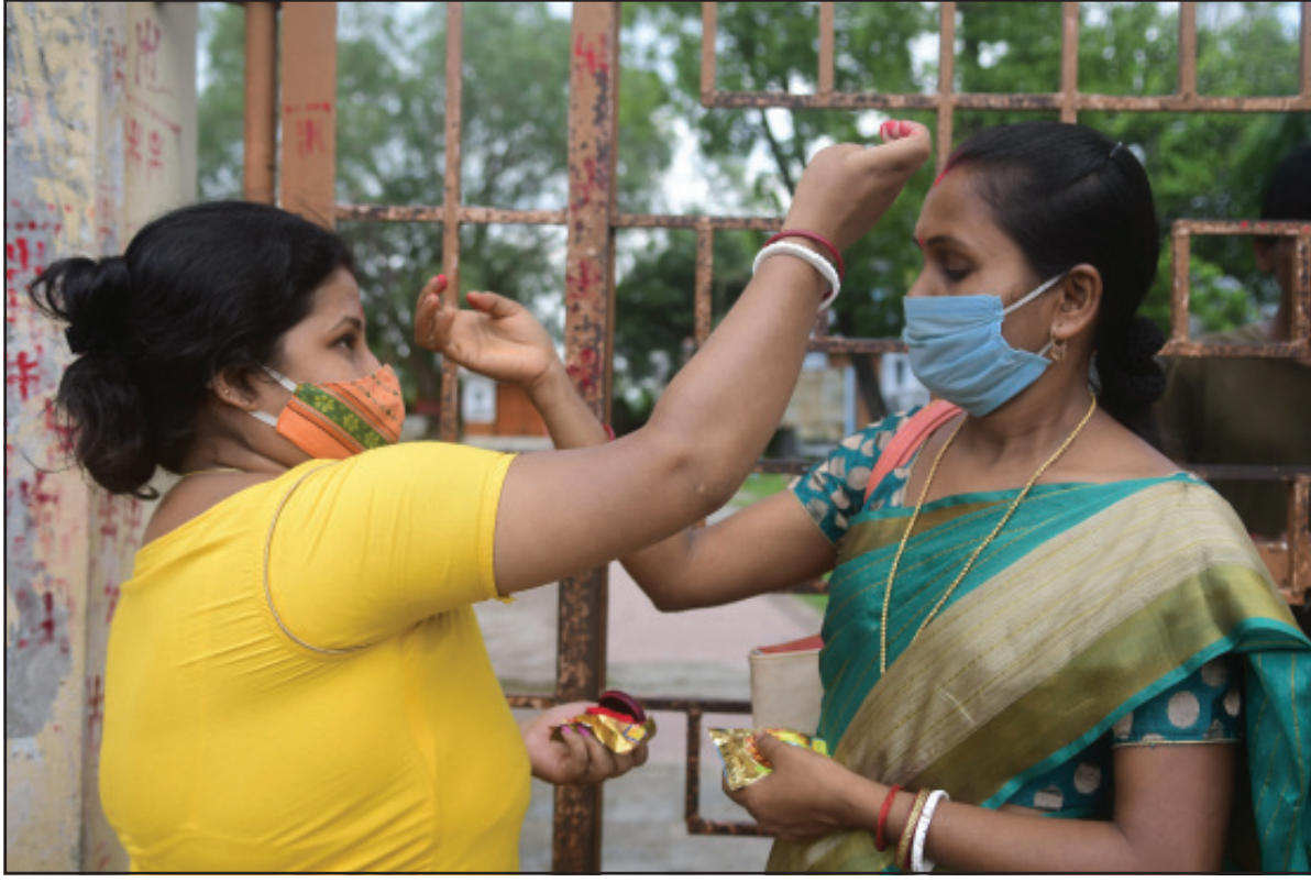
অম্বাবুটি উপলক্ষে সিদুর বিনিময়। লক্ষ্মীনারায়ণ মন্দিরের বাইরে গেইটের সামনে তোলা নিজস্ব ছবি।