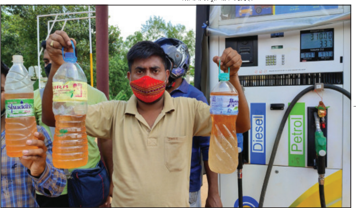
আগরতলায় একটি পেট্রোল পাম্পে পেট্রোলের সাথে মিলল জল। বিক্ষোভ দেখান বাইক চালকরা। ছবি নিজস্ব।

আকাশ ভেঙ্গে পরার উপক্রম হয়। শ্রমিকরা কোনো উপায়ান্তর না পেয়ে কাজের দাবিতে গোমতী জেলা শাসকের দ্বারস্থ হয়েছিলেন। শ্রমিকরা তাদের চিঠিতে জানিয়েছেন কারখানা বন্ধ হলে তাদের জীবিকা নির্বাহ করে সংসার চালাতে কষ্টকর হয়ে পড়বে। তারা কারখানা চালু রাখার দাবি জানিয়েছেন। এ ব্যাপারে কোম্পানি কর্তৃপক্ষের সঙ্গে কথা বলে জানা যায় বিগত দিনে রাজ্য সরকারের নিকট লক্ষ লক্ষ টাকা পাড়ে রয়েছে। সেই টাকা পরিশোধ করলেই সরকার পক্ষ সমস্যা সমাধানকারী দপ্তর প্রধানরা। কোম্পানির মালিক পক্ষ কোম্পানিকে বন্ধ করা ছাড়া আর কোনো উপায় নেই বলে জানিয়েছেন মালিকপক্ষ। সরকার পক্ষ ওই কোম্পানির বকেয়া টাকা পরিশোধ করলে শ্রমিকরাও কাজ পেয়ে যাবে, এবং দীর্ঘ বছরের পুরনো এই কোম্পানিটিও বন্ধ হওয়া থেকে বেঁচে যাবে। দীর্ঘ দিনের পুরনো শ্রমিকদের পূর্ণাঙ্গ ভোগ্য বৃহত্তর আকার ধারণ করতে পারে বলে সংশ্লিষ্ট মহল মনে করলেও অবিশেষে বকেয়া টাকা মিটিয়ে দিয়ে কারখানা চালুর দাবি উঠেছে।