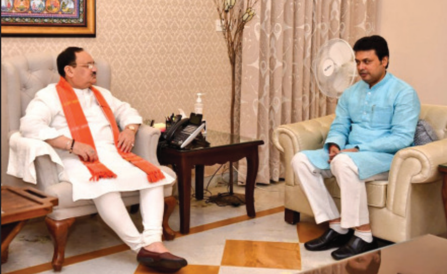
নয়াদিল্লীতে বিজেপির সর্বভারতীয় সভাপতি জে পি নাড্ডার সাথে সাক্ষাৎ করেন মুখ্যমন্ত্রী বিপ্লব কুমার দেব।

রাজনীতির সমীকরণ বদলানোও বিজেপির ভিত নড়ানো সম্ভব হয়নি, তা বিপ্লবের প্রতি কেন্দ্রীয় মন্ত্রিসভার রাস সেই বিপ্লবের হাতেই দিয়েছেন বিজেপি শীর্ষ নেতৃত্ব। রাজ্য রাজনীতির বারাদায় ভিন্ন ধারার বাতাস বয়ে গেছে। নতুন সমীকরণ, নয়া ভাবনা-চিন্তায় জল্পনা ছিল তুঙ্গে। কিন্তু, আখেরে সমস্ত জল্পনারই অবসান হতে চলেছে। আর মাত্র তিন দিনের অপেক্ষা। এর পরই ২০২৩ বিধানসভা নির্বাচনের লক্ষ্যে মোক্ষম চাল দেবেন বিপ্লব কুমার দেব। তার ছক হয়ত প্রধানমন্ত্রী নরেন্দ্র মোদী এবং বিজেপি সর্বভারতীয় সভাপতি জে পি নাড্ডা একে দিয়েছেন। বিপ্লব কুমার দেব শুধু দাবার গুটির চাল দেবেন। অনেকটা কেন্দ্রীয় মডেলে ত্রিপুরা মন্ত্রিসভায় রদবদলে কিছুটা পরিবর্তিত চিত্রপট রয়েছে। বিজেপি সূত্রে খবর, নতুন মুখ সম্ভবত তিন জন আসতে চলেছে মন্ত্রিসভায়। তবে, অধ্যক্ষের পরিবর্তন সহ একাধিক বিষয় এখনই উড়িয়ে দেওয়া যাবে না। কিন্তু, চোখ জলসানো চমক অপেক্ষা করছে, এমনটাই মনে করছে ৬ এর পাতায় দেখুন