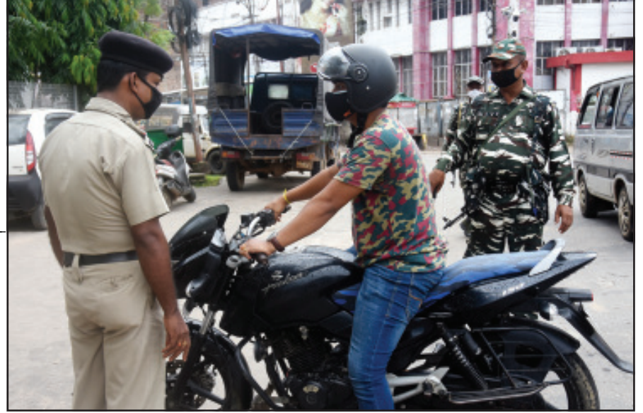
উইকেড কারফিউর দ্বিতীয় দিনে আগরতলা শহরে রাজপথে পুলিশের কঠোর নজরদারী। ছবি নিজস্ব।

উপর ছড়মুড়িয়ে ভেঙে পড়ে একটি পাঁচলি। চাপা পড়ে যায় ঝুপড়ির বহু বাসিন্দা। শেষ পাওয়া খবর অনুযায়ী, ওই এলাকায় ১২ জনের মৃত্যু হয়েছে। ভগ্নস্তুপের নিচে কমপক্ষে ৬-৮ জনের আটকে পড়ার আশঙ্কা করা হচ্ছে। প্রবল বৃষ্টি মাথায় নিয়ে উদ্ধারকারীরা মেমেছে এনডিআরএফ। যুদ্ধকালীন তৎপরতায় পাঁচিলের ভগ্নাংশে সরানো ও নিখোঁজদের খোঁজার কাজ চলছে। এই দুর্ঘটনার রেশ কাটার আগেই রবিবার ভোররাত থেকে বিক্রোলি এলাকায় একতলা একটি বাড়ি ধসে যায়। সেই ধসে মৃত্যু থেকে পাঁচজনের মৃত্যুর খবর মিলেছে। ভেঙে পড়া অংশের নিচে আর কেউ আটকে রয়েছে কিনা তা দেখা হচ্ছে। উদ্ধারকারী এখনও চলেছে বলে জানিয়েছে বিএমসি। সবমিলিয়ে প্রবল বর্ষণে কার্যত জলবন্দি মুম্বই।