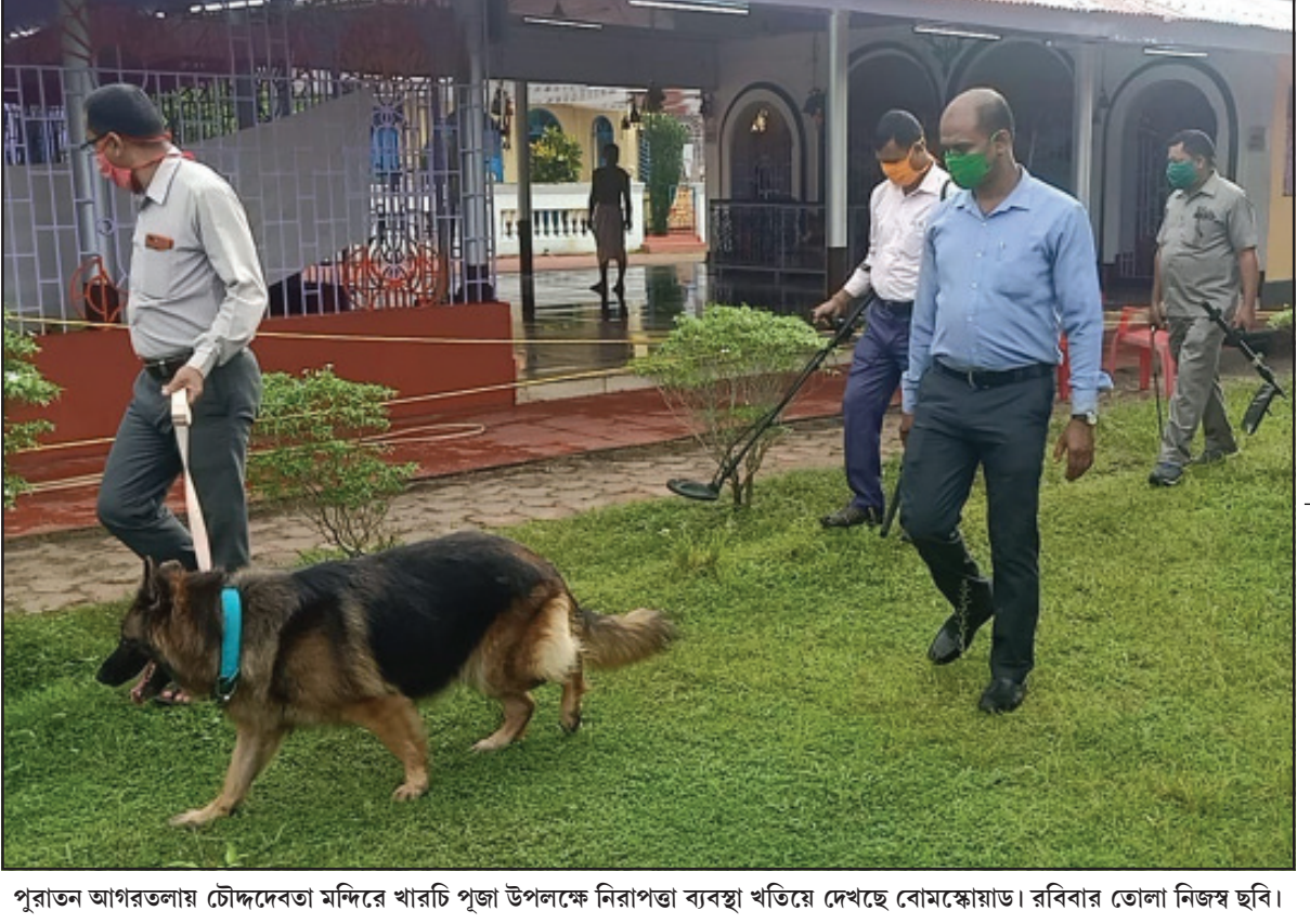
পুরাতন আগরতলায় চৌদেবতা মন্দিরে খারটি পূজা উপলক্ষে নিরাপত্তা ব্যবস্থা খতিয়ে দেখছে বোমস্কোয়াড়া। রবিবার তোলা নিজস্ব ছবি।