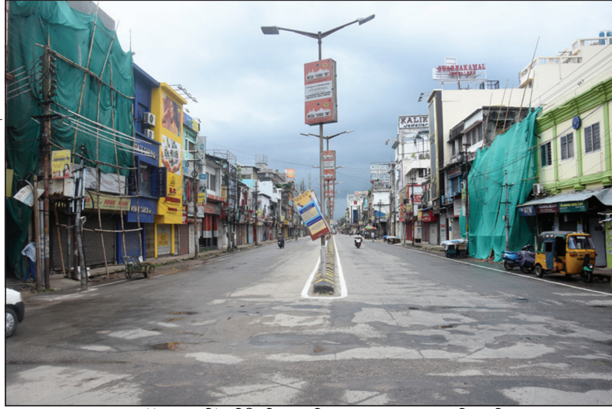
করোনা উইকেড কারফিউর দ্বিতীয় দিন তথা রবিবার আগরতলা শহর গুনশাল। নিজস্ব ছবি।