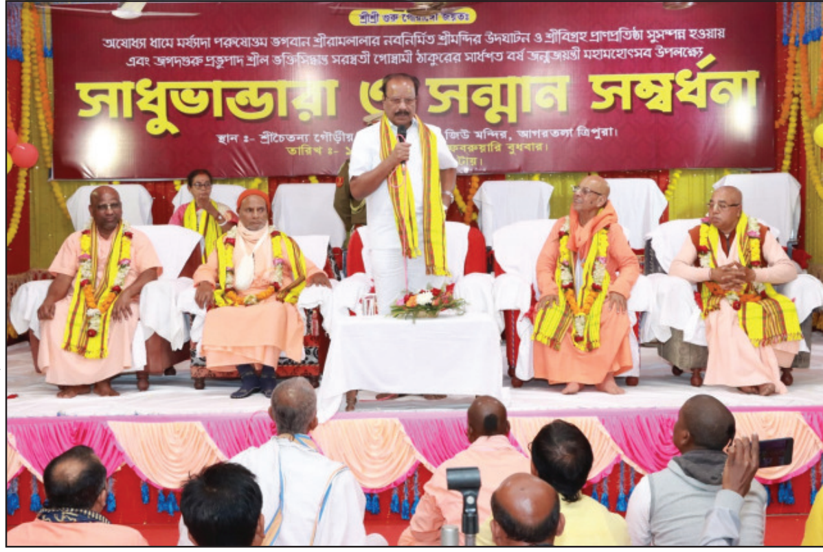
বৃহস্পতি আগরতলায় স্বাস্থ্যভাড়া ও সন্মান সংবর্ধনা উপস্থিত রাজ্যপাল ইন্দ্রসেনা রেড্ডি নাটু।