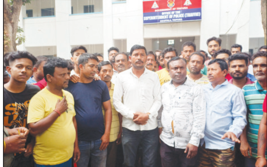
নিজস্ব প্রতিনিধি, আগরতলা, ২০ মার্চ। পুলিশ লাইনে ট্রাফিক দপ্তরের সামনে বিক্ষোভ দেখালো ত্রিপুরা