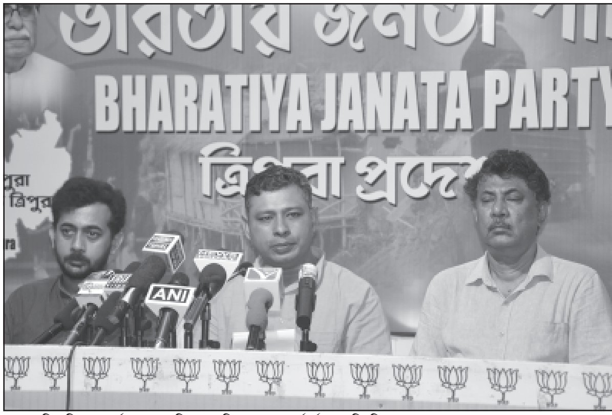
শুক্রবার বিজেপি সদর কার্যালয়ে আয়োজিত সাংবাদিক সম্মেলনে কর্মকর্তারা।