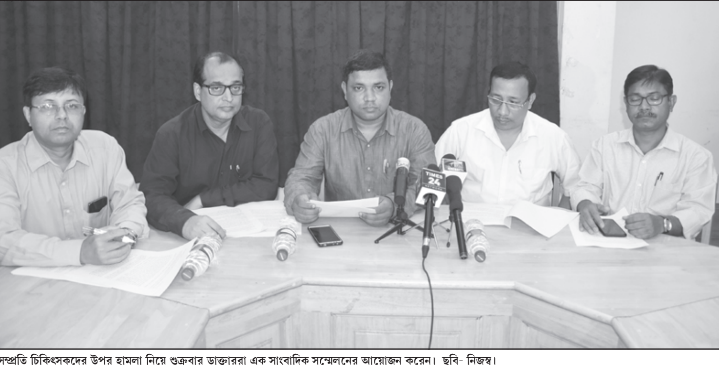
সম্প্রতি চিকিৎসকদের উপর হামলা নিয়ে গুরুতর ডাক্তাররা এক সাংবাদিক সম্মেলনের আয়োজন করেন।

নয়াদিহি, ৪ এপ্রিল (হিস.): দিল্লির শাহদারার সীমাপুরী এলাকায় অ্যালুমিনিয়াম ফ্যাক্টরির দেওয়াল চাপা পড়ে মৃত্যু হল দু'জন শ্রমিকের।