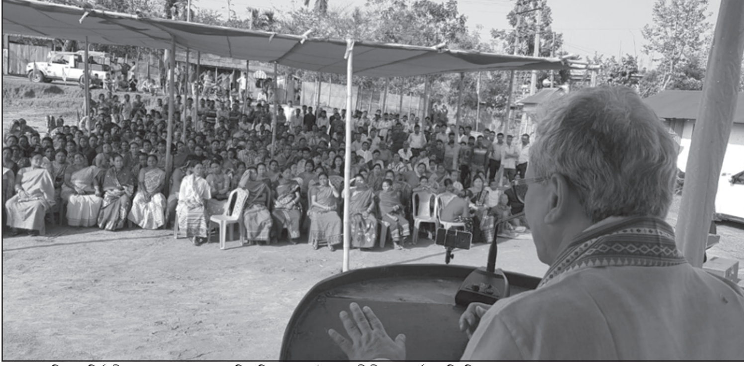
মঙ্গলবার নাগিছড়া নির্বাচনী জনসভায় বক্তব্য রাখছেন বিজেপি নেতা তথা উপমুখ্যমন্ত্রী যীশু দেববর্মা।