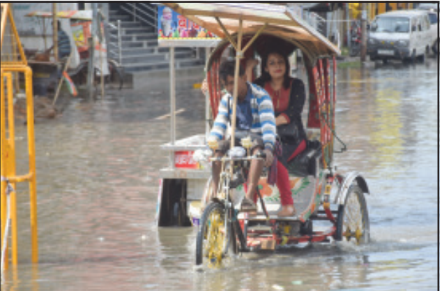
মঙ্গলবার ভারী বর্ষণে জলমগ্ন আগরতলায় রাজপথ।

নিজস্ব প্রতিনিধি, আগরতলা, ৯ এপ্রিল। বর্ষা শুরু আগেই আগরতলা শহরবাসীর চিন্তা বাড়লো। কারণ, প্রতি বছরের মতই ভারী বর্ষণে আবারও জলমগ্ন হল রাজধানীর রাজপথ। মঙ্গলবার সকাল থেকেই ভারী বৃষ্টিপাত শুরু হয়। ঘন্টা খানেকের বৃষ্টিতে আগরতলায় প্রধান রাস্তাগুলিতে জল জমে যায়। তাতে, নিত্যযাত্রীরা ভীষণ সমস্যার মুখে পড়েন। জলনিষ্কাশনী ব্যবস্থা এখনও আগের অবস্থাতেই রয়েছে তা এদিনের বৃষ্টিপাতে প্রমাণিত হয়েছে।