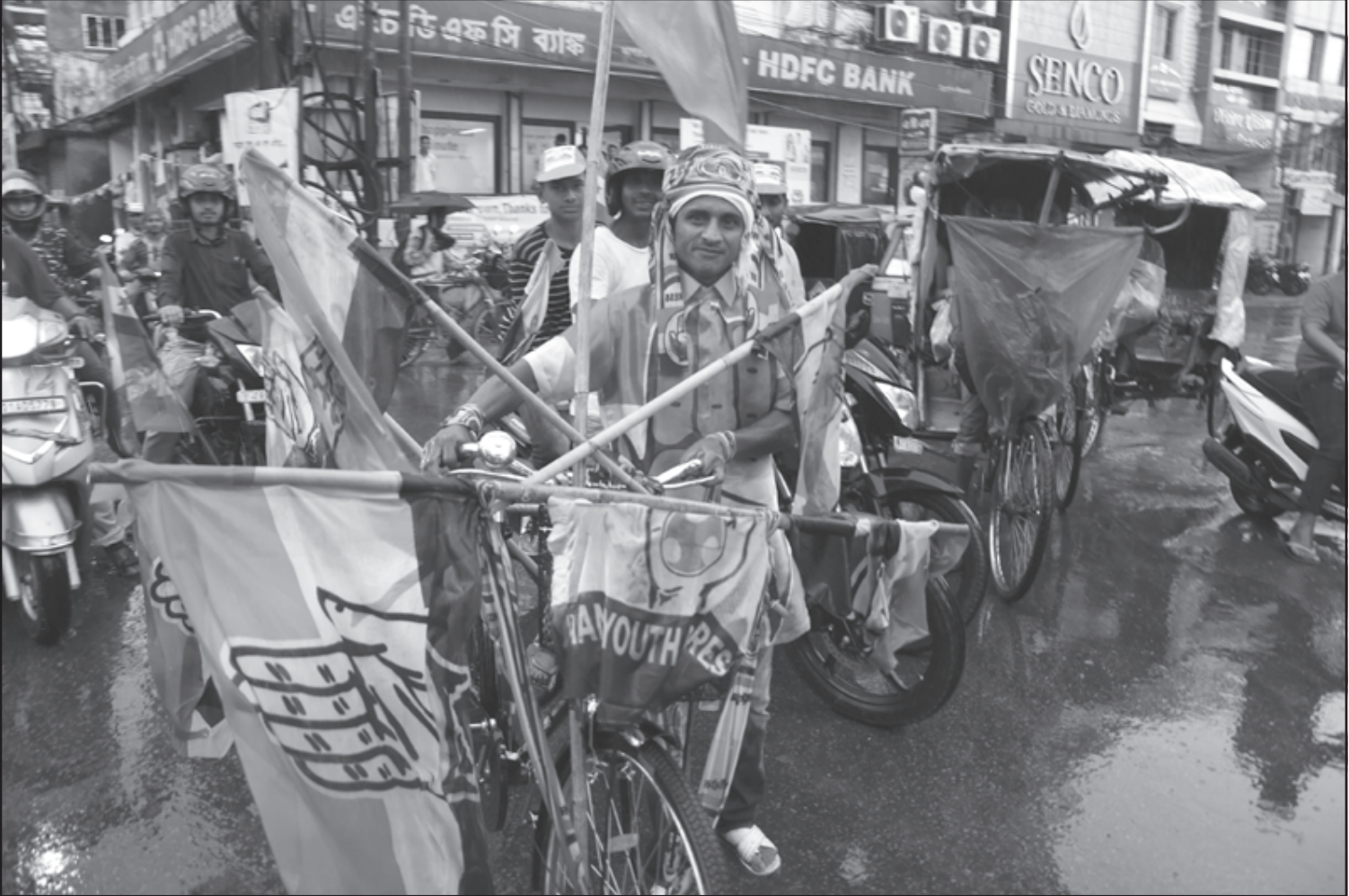
মঙ্গলবারের ভারী বর্ষণকে উপেক্ষা করে এক কংগ্রেস সমর্থক প্রচার র্যালীতে যোগ দিতে মরিয়া।