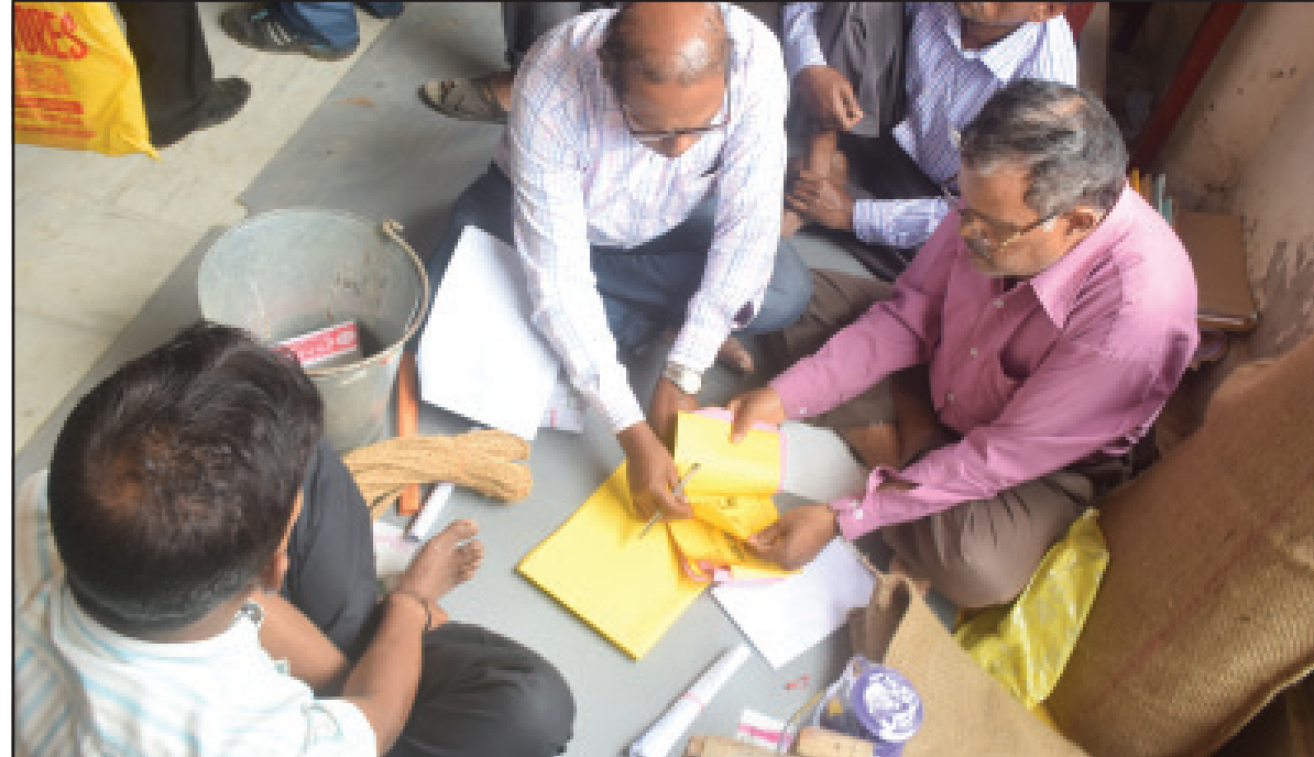
মঙ্গলবার আগরতলায় পশ্চিম আসনে নিযুক্ত ভোট কর্মীরা ভোটের সামগ্রী সংগ্রহ করছেন।