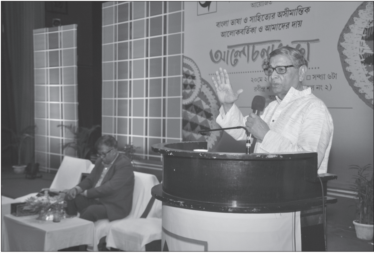
সোমবার বাংলা ভাষা ও সাহিত্যের আয়োজিত অনুষ্ঠানে বক্তব্য রাখেন অতিথিবন্দনা।