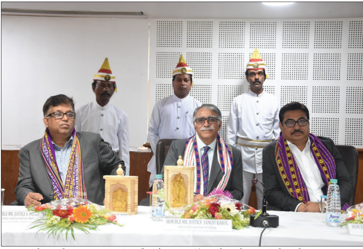
বার কাউন্সিল অব ত্রিপুরার ওয়েবসাইটের উদ্বোধনী অনুষ্ঠানে হাইকোর্টের মুখ্য বিচারপতি ও অন্য দুই বিচারপতি। সোমবার তোলা ছবি নিজস্ব।