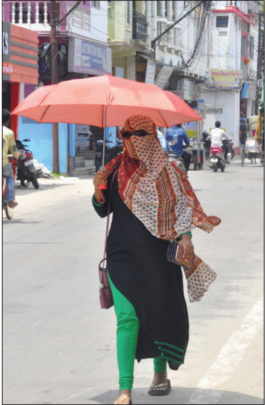
তাপদহ থেকে রেহাই পেতে মুখ ঢেকে রাজপথে মহিলা পথচারী। সোমবার তোলা নিজস্ব ছবি।