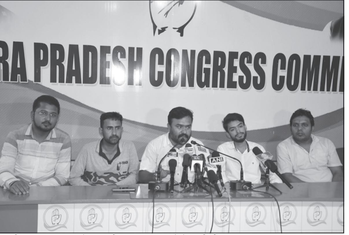
বৃহস্পতিবার কংগ্রেসের সদর কার্যালয়ে সাংবাদিক সম্মেলনে দলের কর্মকর্তারা।