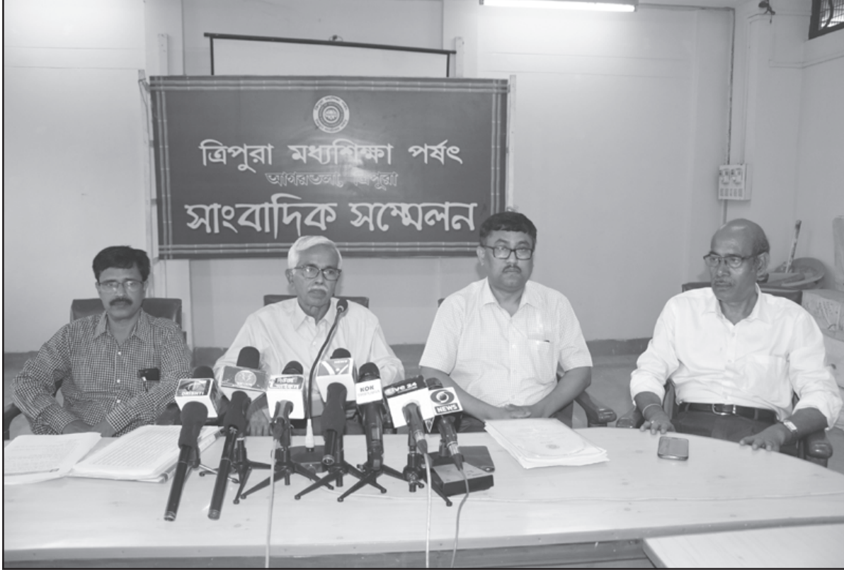
বৃহস্পতিবার ছাদশের কলা ও বানিজ্য বিভাগের ফলাফল ঘোষণা করে ত্রিপুরা মধ্যশিক্ষা পর্ষদ।