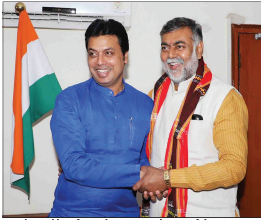
বৃহস্পতিবার নয়াদিল্লিতে মন্ত্রী প্রহলাদ সিং প্যাটেলের সাথে ত্রিপুরার মুখ্যমন্ত্রী বিপ্লব কুমার দেব এক সৌজন্য সাক্ষাতে মিলিত হন।

নয়াদিল্লি, ৬ জুন (হি.স.): মধ্যপ্রদেশের মুখ্যমন্ত্রী কমল নাথ বৃহস্পতিবার প্রধানমন্ত্রী নরেন্দ্র মোদীর সঙ্গে দেখা করে তাঁর রাজ্য সম্পর্কিত একাধিক বিষয় নিয়ে আলোচনা করেন। প্রধানমন্ত্রীর বাসভবনে এদিনের বৈঠকে প্রায় আধ ঘণ্টা সময় কাটান তিনি। এদিন মধ্যপ্রদেশ সরকারের পক্ষ থেকে দেওয়া একটি বিবৃতিতে বলা হয়েছে, দ্বিতীয়বার জয়ের পর প্রধানমন্ত্রী নরেন্দ্র মোদীকে অভিনন্দন জানিয়েছেন রাজ্যের মুখ্যমন্ত্রী ও কংগ্রেস নেতা কমল নাথ। কেন্দ্র সরকারের সঙ্গে মধ্যপ্রদেশের রাজ্য সরকারের অনুমোদন ও আর্থিক সহায়তা সম্পর্কিত মূলত্ববি থাকা