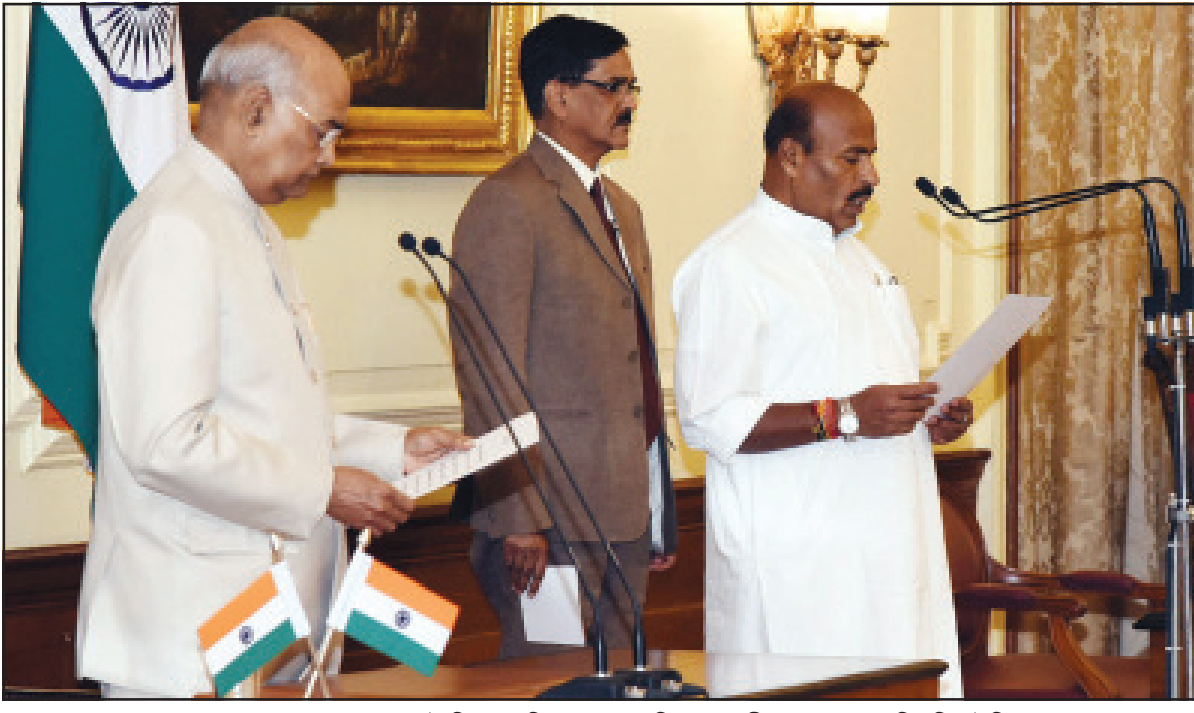
সোমবার লোকসভার প্রোমোট স্পিকার হিসেবে শপথ নিলেন ড. বীরেন্দ্র কুমার।

নিজস্ব প্রতিনিধি, কৈলাসহর, ১৭ জুন।। ত্রিপুরা পঞ্চায়েত নির্বাচনকে কেন্দ্র করে আগাম প্রস্তুতি নিতে শুরু করে বিজেপি। উনকোটি জেলার কৈলাসহর মণ্ডলের উদ্যোগে টিনাবাজার স্কুল হলঘরে-ত্রিপুরা পঞ্চায়েত নির্বাচনকে সামনে রেখে এক গুরুত্বপূর্ণ সাংগঠনিক বৈঠক অনুষ্ঠিত হয়। বিধানসভা নির্বাচনে বিপুল জয়ের পর গত লোকসভা নির্বাচনেও বিজেপি রাজ্যের দুটি আসনেই বিপুল জয় পেয়েছে। তাতে দলীয় নেতা কর্মীদের মনোবল বেশ চাঙ্গা হয়ে উঠেছে। সামনে ত্রিপুরা পঞ্চায়েত নির্বাচন। ত্রিপুরা পঞ্চায়েত নির্বাচনও বেশ গুরুত্ব দিচ্ছে বিজেপি। নির্বাচনের দিনক্ষণ ঘোষনা না হলেও ইতিমধ্যেই দলীয় শীর্ষ নেতৃত্বে আগরতলায় ত্রিপুরা পঞ্চায়েত নির্বাচনের বনকৌশল স্থির করেছেন। পঞ্চায়েত তত্ত্বের সাংগঠনিক তৎপরতা বাড়াতে নির্দেশ দেওয়া হয়েছে। এরই অঙ্গ হিসেবে উনকোটি জেলার কৈলাসহর মণ্ডলের পঞ্চায়েত টিনা বাজার স্কুলে এক সাংগঠনিক সভা সংগঠিত করা হয়। সাংগঠনিক সভায় ত্রিপুরা পঞ্চায়েত নির্বাচন নিয়ে ছয়ের পাতায় দেখুন