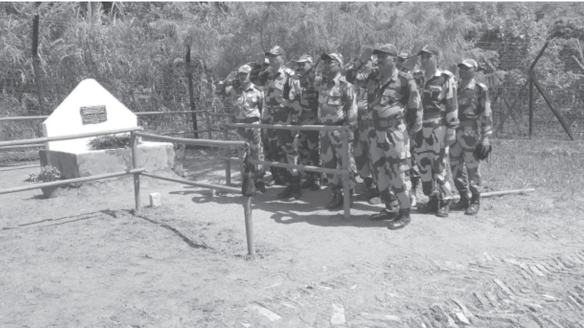
বিএসএফের ১৫৮ নং ব্যাটেলিয়ান কার্গিল দিবস পালন করেছে।