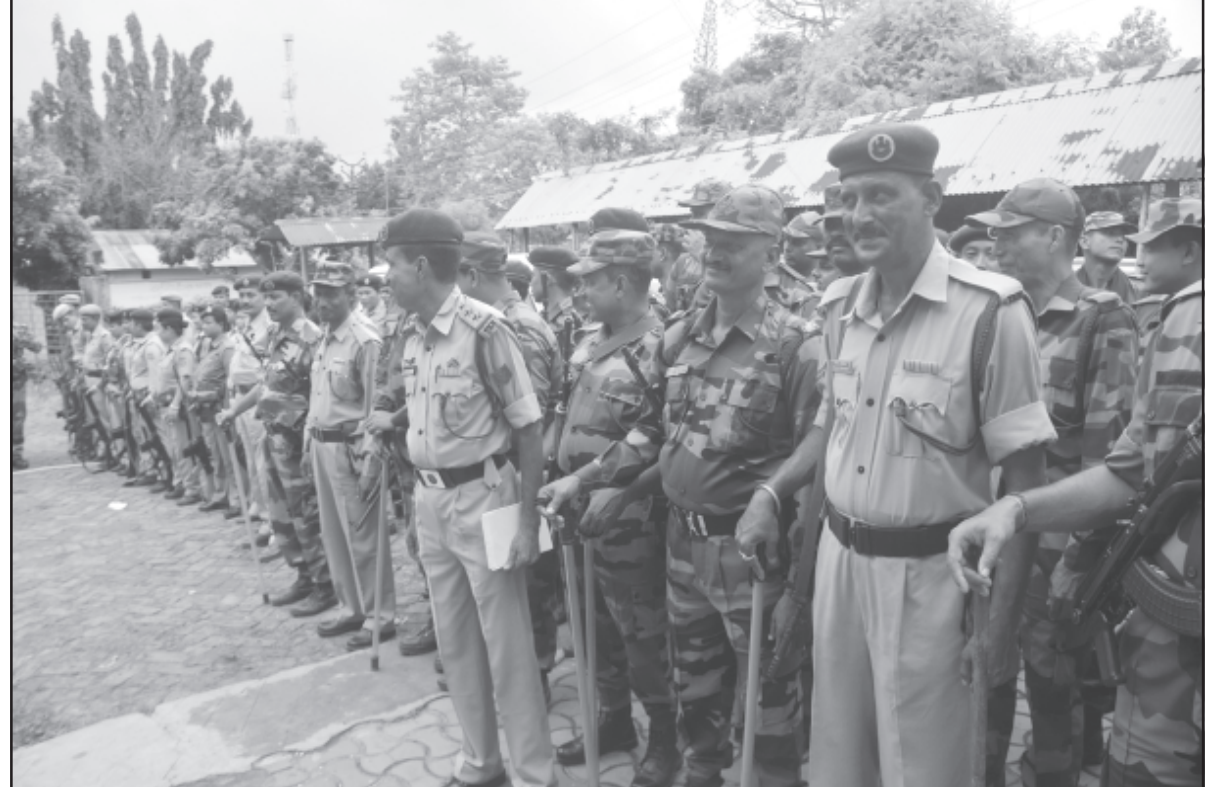
বিস্তার পঞ্চায়েত নির্বাচন উপলক্ষে আরক্ষা কর্মীদের দায়িত্ব বুঝিয়ে দেওয়া হচ্ছে।

কেজি হেরোইন-সহ মোট ৭ জনকে গ্রেফতার করেছিল দিল্লি পুলিশ। ধৃতদের মধ্যে চারজন আফগান নাগরিক। এখানও পর্যন্ত মোট ৩৩০ কেজি হেরোইন বাজেয়াপ্ত করেছে দিল্লি পুলিশ। উদ্ধার হওয়া হেরোইনের বাজারমূল্য ১,৩২০ কোটি টাকা।