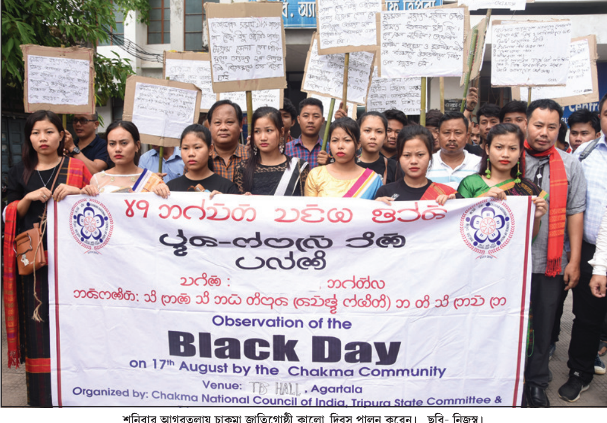
শনিবার আগরতলায় চাকমা জাতিগোষ্ঠী কালো দিবস পালন করেন।