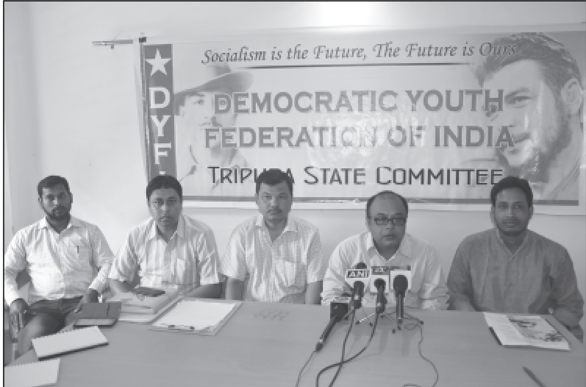
শনিবার ডিওয়াইএফ আয়োজিত সাংবাদিক সম্মেলনে কর্মকর্তারা।