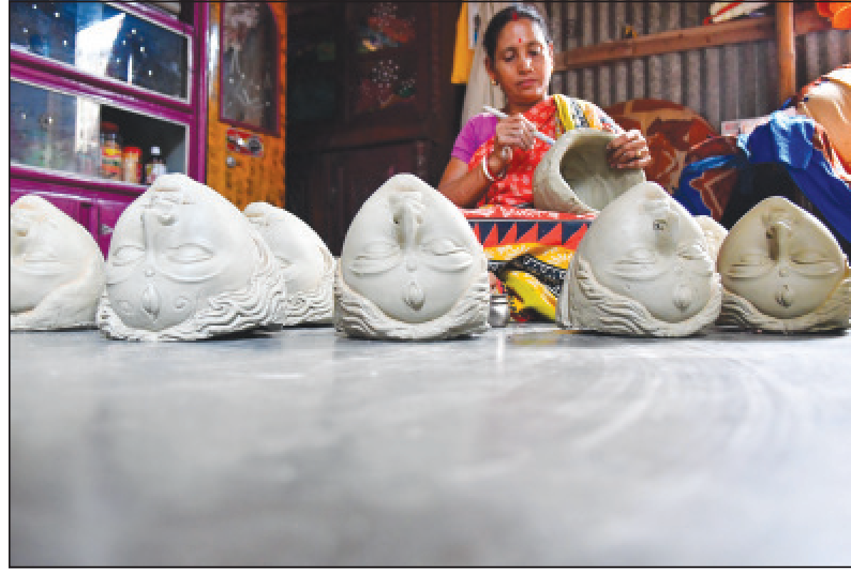
দুর্গোৎসবের বাকি আর মাত্র কয়েকটা দিন। দুর্গা প্রতিমা তৈরিতে ব্যস্ত মুং শিল্পী। শনিবার আগরতলায় তোলা নিজস্ব ছবি।

নিজস্ব প্রতিনিধি, আগরতলা, ১৭ আগস্ট। ধর্মনগর শহরের প্রাণকেন্দ্র অফিসটিলার অবস্থিত কালিবাড়িতে দুঃসাহসিক চুরির ঘটনা ঘটেছে। কালী প্রতিমার প্রায় ১২ ভরি সোনার গয়না চুরি হয়েছে। এই ঘটনায় ধর্মনগরে আতঙ্ক দেখা দিয়েছে। কারণ, ওই এলাকাটি ২৪ ঘণ্টা নিরাপত্তার চাবুরে মোড়া থাকে। তা সত্ত্বেও চোরের হানা নিরাপত্তা ব্যবস্থা নিয়ে প্রশ্ন তুলেছে।