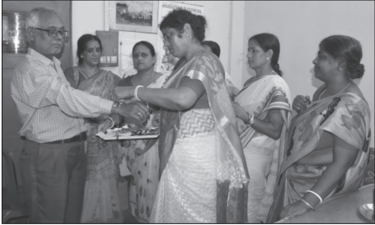
জাগরণ অফিসে আনন্দমার্গের বোনেরা রাখি পরাচ্ছেন।