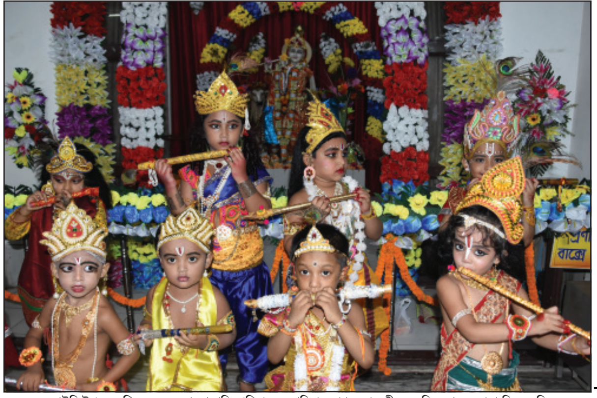
জন্মান্দিম উপলক্ষে শিশুদের কৃষ্ণ সাজে প্রতিযোগিতা। বৃহস্পতিবার আগরতলায় শ্রীকৃষ্ণ মন্দির থেকে তোলা নিজস্ব ছবি।