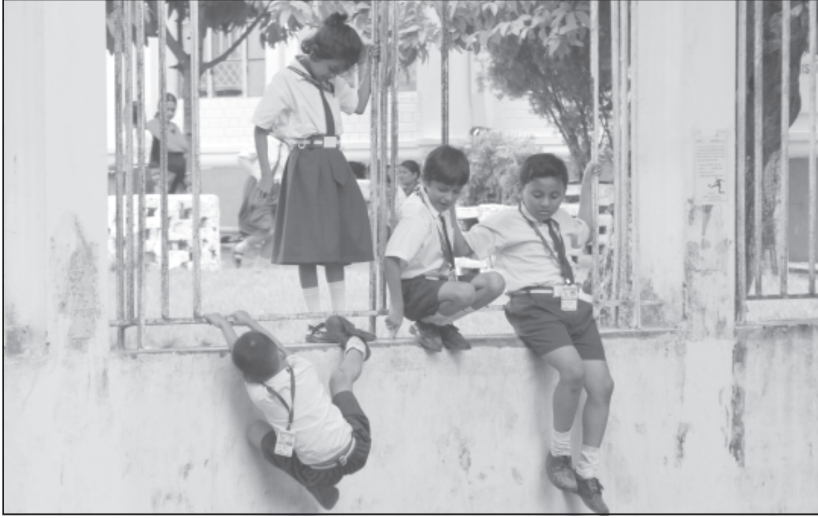
অসুরক্ষিত স্কুল পড়ুয়া কীটকীচারা। আগরতলায় শিশুবিহার দ্বাদশ শ্রেণি বিদ্যালয়ের প্রাথমিক বিভাগের ছাত্রছাত্রীরা এই ভাবেই প্রতিদিন দেওয়াল টপকে খেলাধুলা করছে।