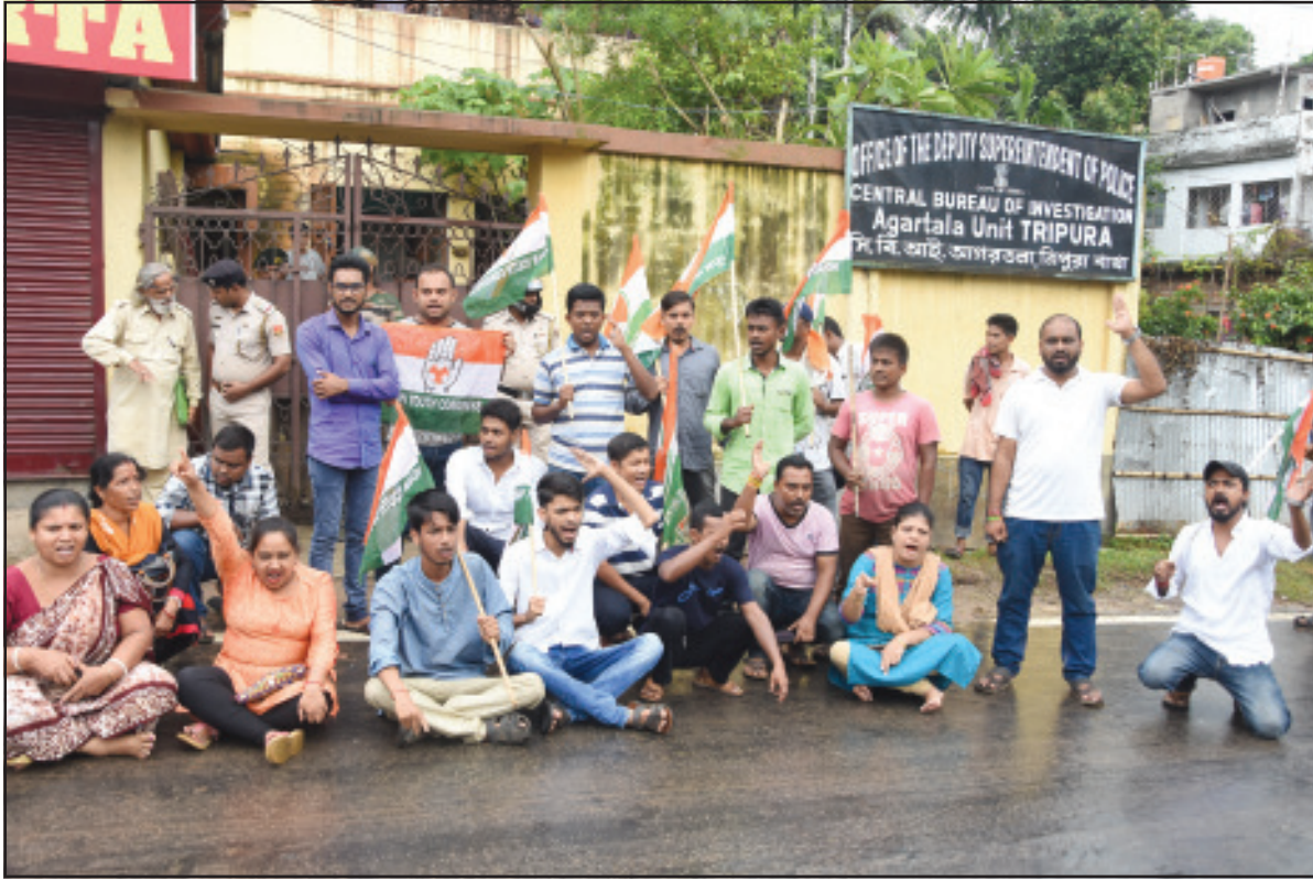
প্রাক্তন কেন্দ্রীয় মন্ত্রী তথা বরিশত কংগ্রেস নেতা পি চিদম্বরমের গ্রেফতারের প্রতিবাদে আগরতলায় সিবিআই কার্যালয়ের বাইরে প্রদেশ যুব কংগ্রেস বিক্ষোভ প্রদর্শন করেছে।