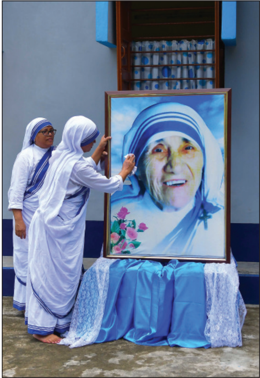
২৬ আগস্ট মাদার টেরেজার জন্মদিন পালনের উদ্যোগে আগরতলায় নির্মালা শিশুগৃহে।