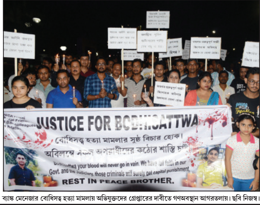
বান্ধ মনোজার বোধিসত্ত্ব হত্যা মামলায় অভিযুক্তদের গ্রেপ্তারের দাবিতে গণঅবস্থান আগরতলায়।

নিজস্ব প্রতিনিধি, আগরতলা, ২৫ আগস্ট।। আগরতলা নিউ ক্যাপিটেল কমপ্লেক্স এলাকায় রবিবার বিদ্যুতের একটি ট্রান্সফরমারে অগ্নি সংযোগের ঘটনা ঘটে। তাতে অল্পতে রক্ষা মিলেছে। ট্রান্সফরমারের তেল লিকেজ হয়ে পড়তে থাকে। এরই মধ্যে সেখানে সিসিটিভি হয়। ফলে অগ্নিসংযোগের ঘটনা ঘটে। স্থানীয় লোকজনরা সঙ্গে সঙ্গে বিষয়টি দমকল বাহিনী এবং বিদ্যুৎ নিগমের অফিসকে জানান। খবর পেয়ে দমকল বাহিনী দ্রুত ছুটে আসে আগুন আয়ত্তে আনে। এর ফলে বড় ধরনের দুর্ঘটনা থেকে অল্পতে রক্ষা মিলেছে।