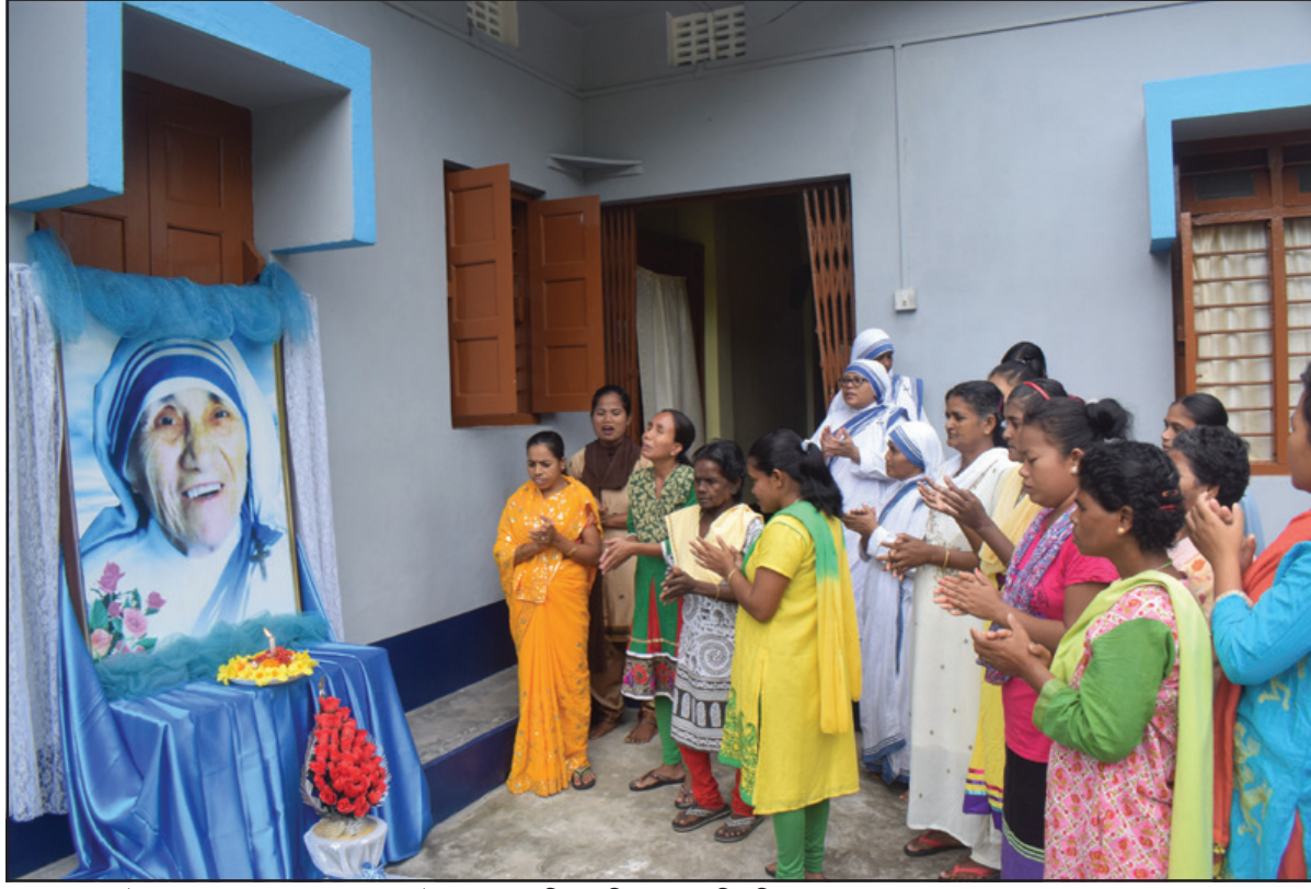
সোমবার গোটা দেশের সাথে রাজ্যে মাদার টেরেসার জন্মদিন পালিত হয়।