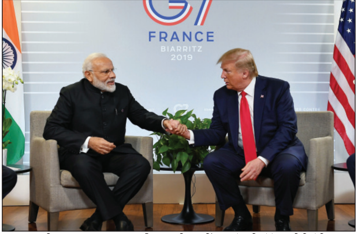
ফ্রান্সে জি ৭ বৈঠক সম্মেলনে ভারতের প্রধানমন্ত্রী নরেন্দ্র মোদী এবং মার্কিন যুক্তরাষ্ট্রে প্রেসিডেন্ট ট্রাম্প।