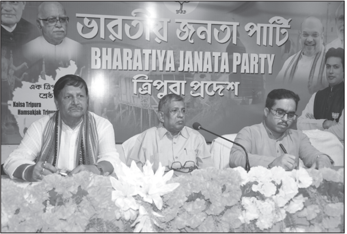
মঙ্গলবার বিজেপি সদর কার্যালয়ে আয়োজিত হয় বিজেপির শীর্ষ নেতাদের নিয়ে এক সাংবাদিক সম্মেলন।