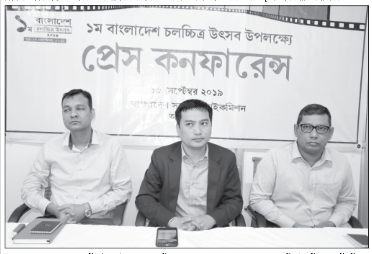
আগরতলায় প্রথম বাংলাদেশ চলচ্চিত্র উৎসব উপলক্ষ্যে সাংবাদিক সম্মেলনে বক্তব্য রাখছেন বাংলাদেশ সহকারী হাই কমিশনার।

বোর্ডের বার্ষিক সভায় সংস্থার চেয়ারম্যান তথা রাজ্যসভার সদস্য আর কে সিনহা একথা জানিয়ে বলেন, সোশ্যাল মিডিয়ায় সংস্থার সক্রিয়তা জোরদার করা হয়েছে এবং সংস্থার দায়িত্ব নেওয়া উচিত, এ বিষয়ে ভিন্ন ধরনের কাজ করা এ ব্যাপারে সংস্থার ও দায়িত্ব নেওয়া উচিত তারা যেন বিপরীত দিক থেকে বিভিন্ন ধরনের কাজ করে। তিনি আরও বলেন, এই মুহূর্তে সংস্থার কাছে ২.৬ লক্ষ সাবস্ক্রাইবার রয়েছে। কিন্তু পরবর্তী বছরে এই সংস্থার ২০ লক্ষ সাবস্ক্রাইবার হয়ে যাবে।