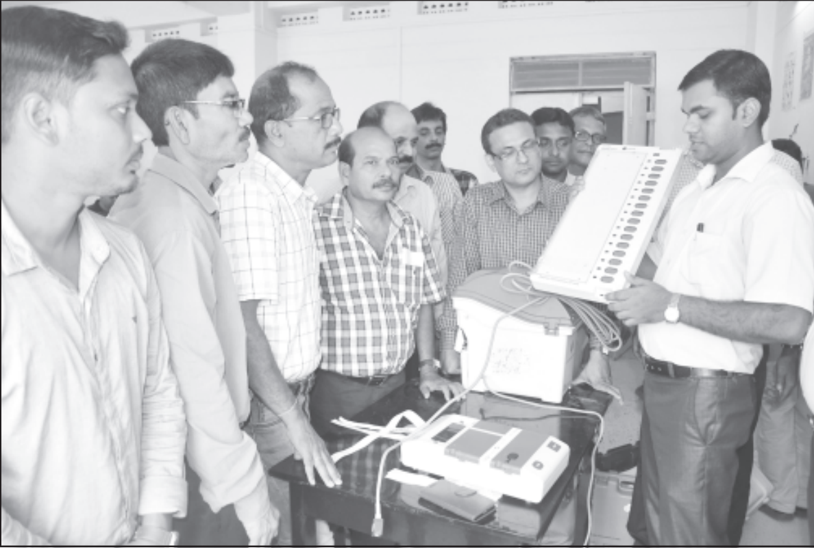
বাধারঘাট কেন্দ্রে উপ-নির্বাচনকে ঘিরে গুরুবায় আগরতলায় ভোট কর্মীদের মহড়া।