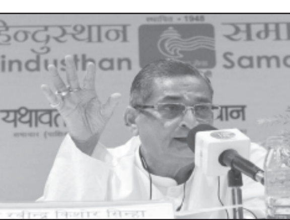
নয়াদিল্লি, ১৩ সেপ্টেম্বর (হিস.): হিন্দুস্থান সমাচারকে গত তিন বছরে গতিশীল ধারায় চালু করার প্রচেষ্টা করা হয়েছে এবং গোটা সংস্থাকে আর্থিকভাবে শক্তিশালী করা হয়েছে। গুরুবায় হিন্দুস্থান সমাচারের