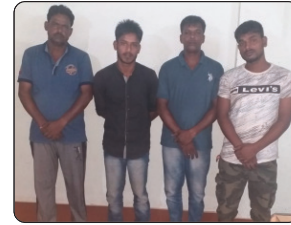
পুলিশের হাতে আটক চার দুর্ভুক্তিকারী।