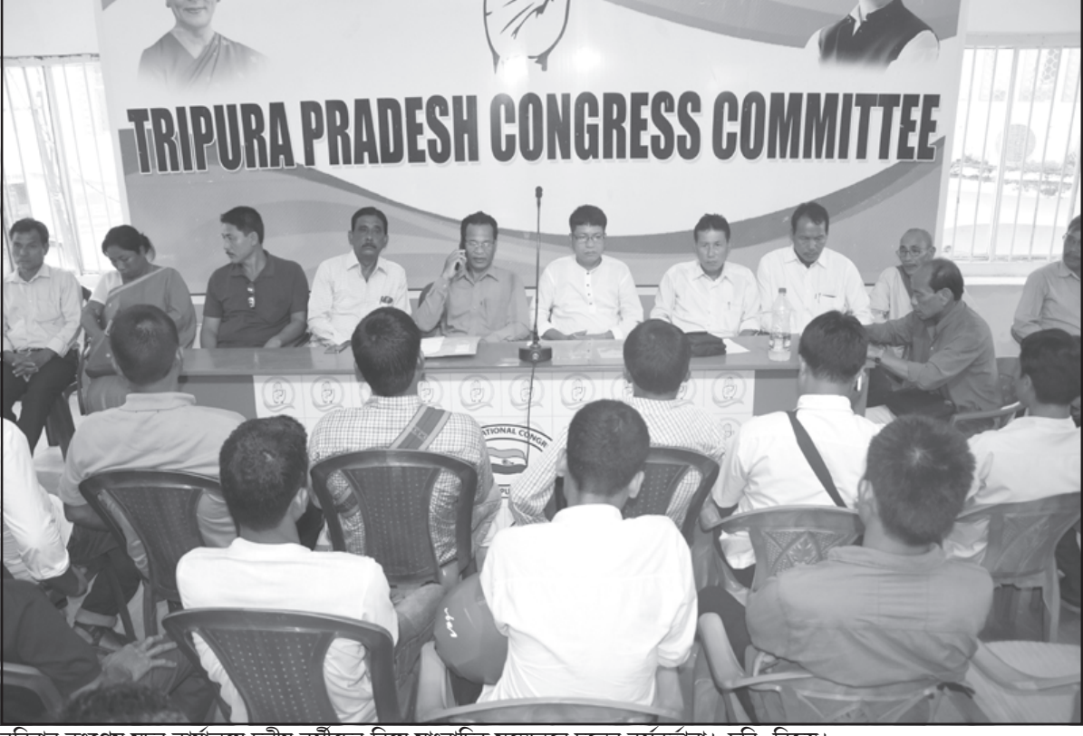
রবিবার কংগ্রেস সদর কার্যালয়ে দলীয় কর্মীদের নিয়ে সাংবাদিক সম্মেলনে দলের কর্মকর্তারা।