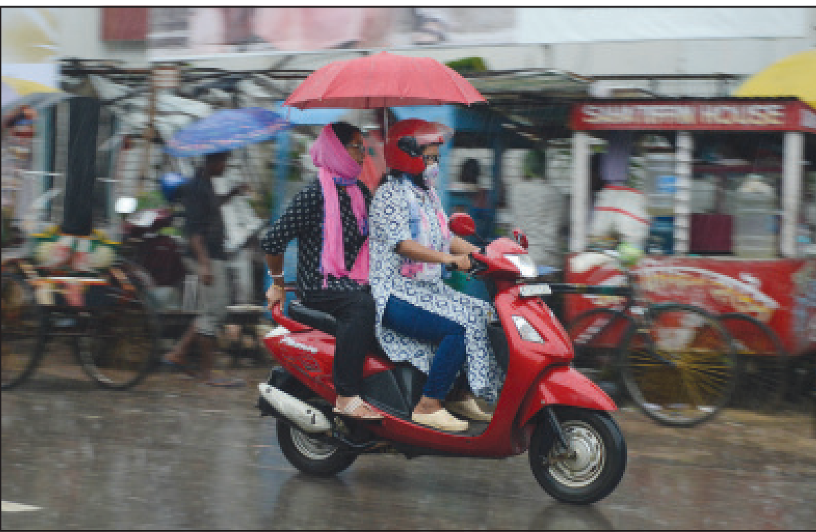
রবিবার বৃষ্টিভেজা রাজধানী আগরতলা শহর।