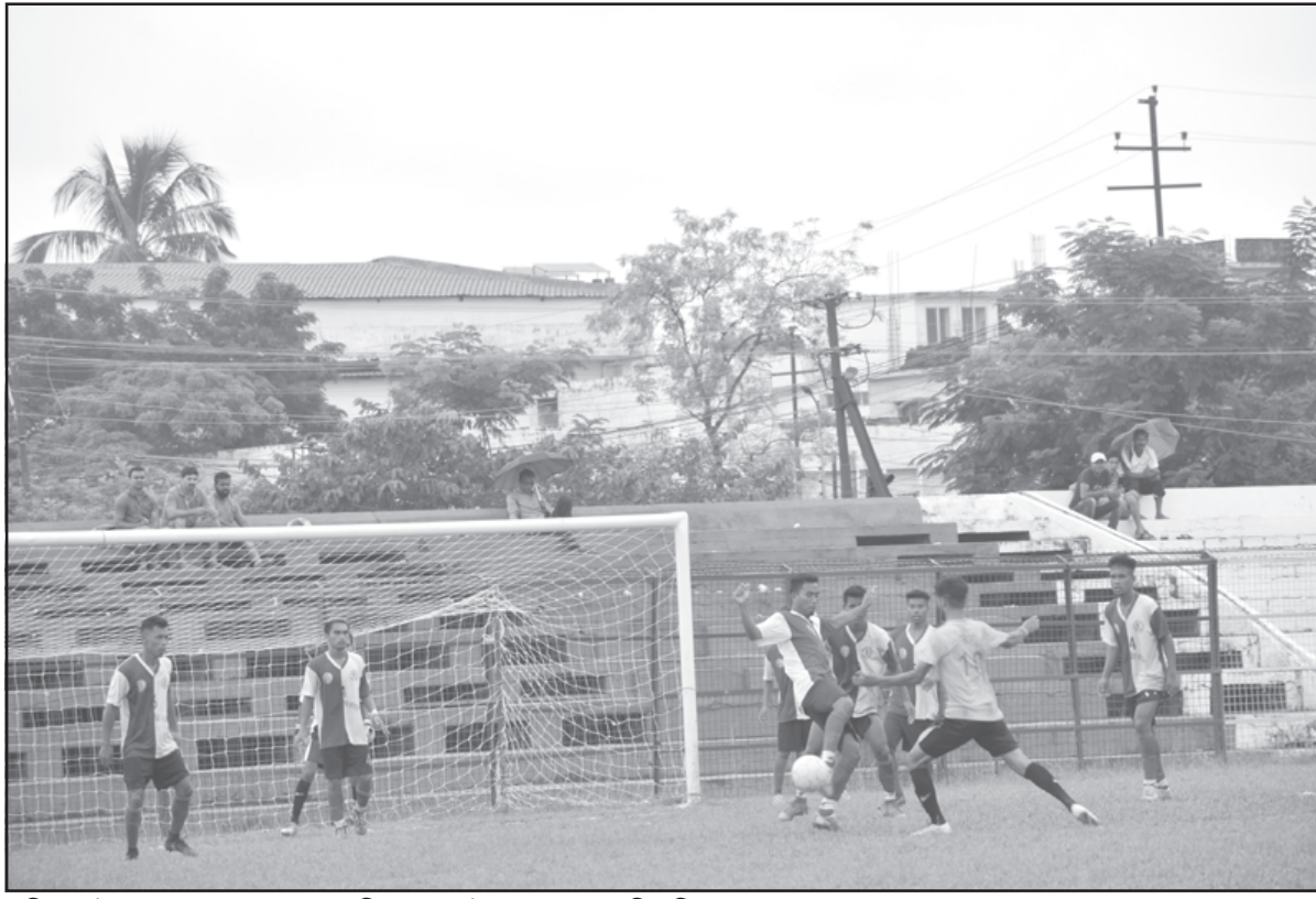
রবিবার উমাকান্ত ময়দানে আয়োজিত হয় ফুটবল খেলা।