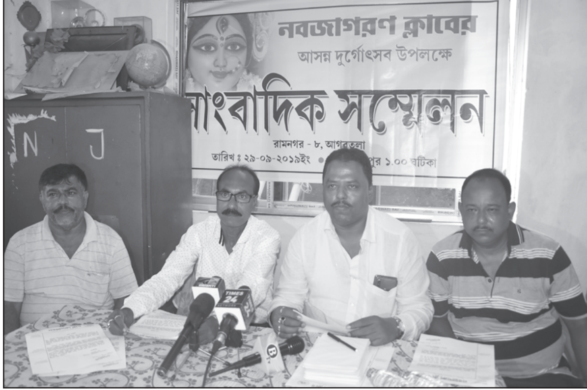
রবিবার নবজাগরণ সংঘের আয়োজিত সাংবাদিক সম্মেলনে ক্লাবের কর্মকর্তারা।