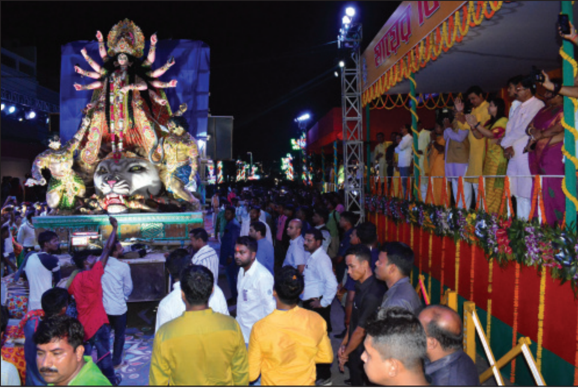
শুক্রবার আগরতলায় সিটি সেন্টারের সামনে থেকে শুরু হয় বিসর্জন কার্নিভাল 'মায়ের বিদায়'।