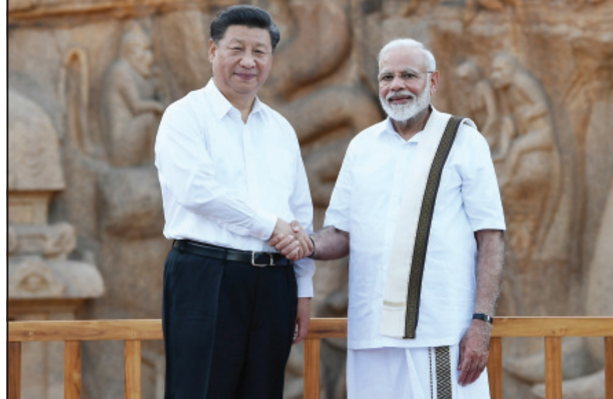
প্রধানমন্ত্রীর নরেন্দ্র মোদী চিনের রাষ্ট্রপতি শি জিংপিংয়ের সঙ্গে চেন্নাইয়ের মহাবলীপুরমে।

চিনের রাষ্ট্রপতি শি জিংপিং এবং প্রধানমন্ত্রী নরেন্দ্র মোদী মধ্যে দ্বিতীয়বার এই যারোয়া বৈঠকের জন্য প্রায় চব্বিশ ঘণ্টা তারা চেন্নাই-মহাবলীপুরম থাকবেন। এদিন চেন্নাই বিমানবন্দরে চিন রাষ্ট্রপতি শি জিংপিং নামার পর তাঁকে ভারতীয় সংস্কৃতির নানা অনুষ্ঠানের মাধ্যমে দিয়ে স্বাগত জানানো হয়। তামিলনাড়ুর লোকসংস্কৃতিও লোকনৃত্য এর মাধ্যম দিয়ে ৬ এর পাতায় দেখুন