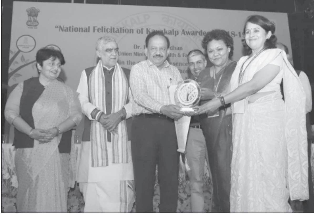
শুক্রবার নয়াদিল্লিতে একটি অনুষ্ঠানে কেন্দ্রীয় স্বাস্থ্য পরিবার কল্যাণমন্ত্রী ডঃ হর্ষবর্ধন সহ অন্যান্যরা।