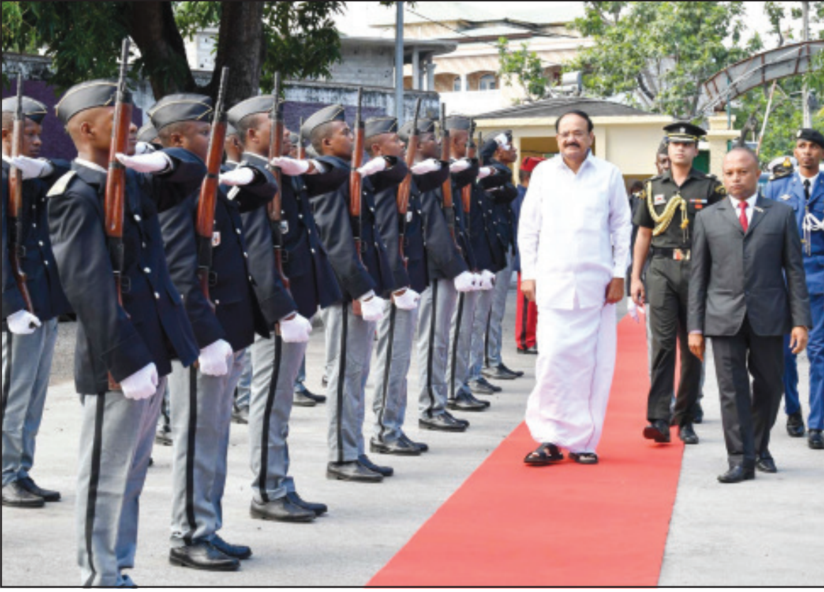
মরনিতে রাষ্ট্রপতি ভবনে ভারতের উপরাষ্ট্রপতি ভেক্কাইয়া নাইডুকে গার্ড অব অনার দেওয়া হয়।