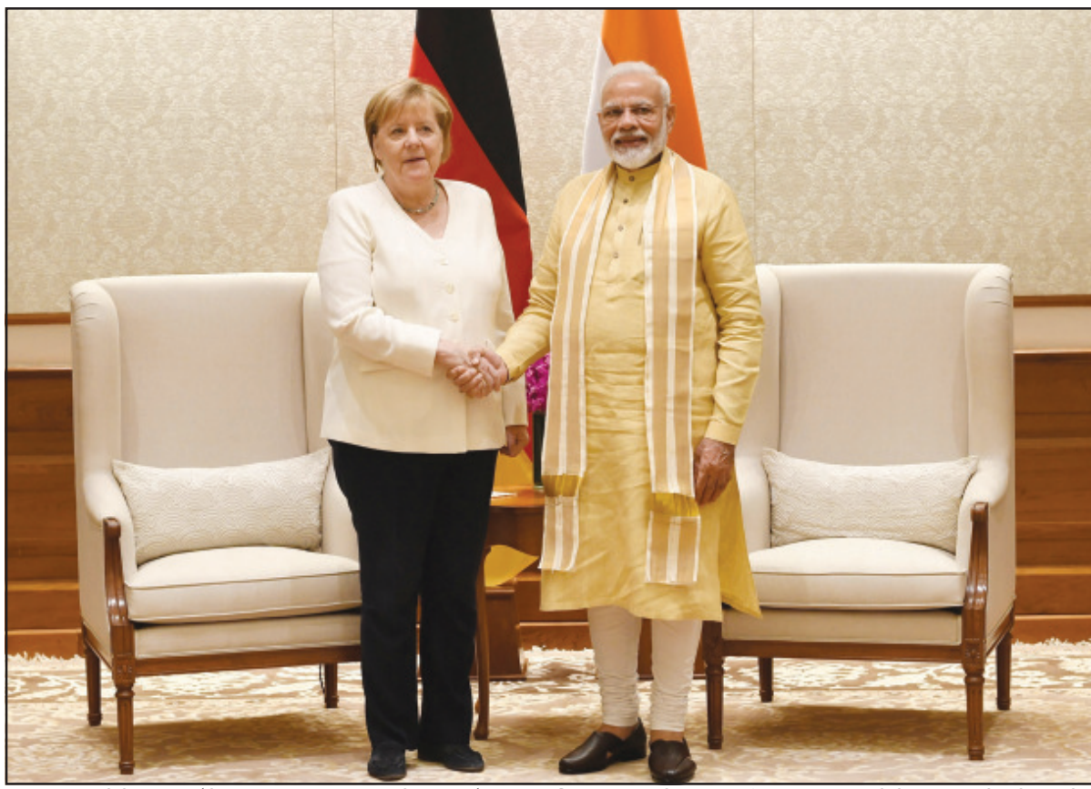
গুজরান নয়াদিল্লিতে জার্মানির চেমেলার ড. অ্যাঞ্জেলিনা মার্কেল প্রধানমন্ত্রী নরেন্দ্র মোদির সাথে সৌজন্য সাক্ষাতে মিলিত হন।