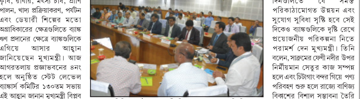
এসএলবিসির বৈঠকে মুখ্যমন্ত্রী বিপ্রব কুমার দেব।

নিজস্ব প্রতিনিধি, আগরতলা, ১ নভেম্বর। সরকারের পরিকল্পনার সাথে সঙ্গতি রেখে ব্যাক্ষগুলির নিজস্ব কর্মসূচি গ্রহণ করা প্রয়োজন। কুবি, রাবার, মৎস্য চাষ, প্রাণি পালন, খাদ্য প্রক্রিয়াকরণ, পর্যটন এবং ডেয়ারী শিল্পের মতো অগ্রাধিকারের ক্ষেত্রগুলিতে ব্যাক্ষ স্বর্ণ প্রদানের ক্ষেত্রে ব্যাক্ষগুলিকে এগিয়ে আসার আহ্বান জানিয়েছেন মুখ্যমন্ত্রী। আজ আগরতলায় প্রজ্ঞাভবনের ৪নং হলে অনুষ্ঠিত স্টেট লেভেল ব্যাক্ষ কমিটির ১০০তম সভায় এই আহ্বান জানান মুখ্যমন্ত্রী বিপ্রব কুমার দেব। সভায় আলোচনাক্রমে তিনি বলেন, সরকারের অগ্রাধিকারের ক্ষেত্রগুলিকে চিহ্নিত করে সুবিধাভোগীদের প্রয়োজনীয় স্বর্ণ প্রদানে এগিয়ে আসতে হবে ব্যাক্ষগুলিকে। একই সঙ্গে ক্ষেত্র