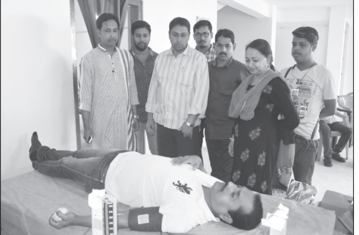
ভিগওয়াইএফআইয়ের উদ্যোগে রক্তদান শিবির।

বৃহস্পতিবার পোস্ভায় এক জগদ্ধাত্রী পূজার উদ্বোধনে গিয়ে বিজেপিকে কড়া ভাষায় আক্রমণ করেন মুখ্যমন্ত্রী মমতা বন্দোপাধ্যায়। বলেন, "এখন আর ভাঙারব্যবস্থা নেই। সারা দিল্লি থেকে দেওয়ার দরকার পড়ে না। বিজেপির তরফে সার্থক বলে ঘোষণা করে ত্রেখ সাটিকিট দিয়ে দেয়। শকুনি জানেন তো? ওঁর পেতে বসে থাকে। কখন কে মরবে, আর খাবে। কেউ বোমের মারা গেল, কেউ ব্যক্তিগত শক্রতায় মারা গেল, সবাইকে বলে দিচ্ছে বিজেপি সমর্থক। মিথ্যা কথা ছাড়া সত্যি কথা বলে না।" শুক্রবার মুখ্যমন্ত্রীর কাছে দিল্লীপবাবু বলেন, 'বাংলায় কে বিসর্জন বন্ধ করেছিল সবাই জানে। বিজেপি আলোতে গিয়ে বিসর্জনের অনুমতি এনেছিল। উনি যে পাপগুলো এতদিন করে এসেছেন তার দায় এখন আমাদের ঘাড়ে চাপাচ্ছেন। আমরা চাই এখনে দুর্গাপূজা, ছটপূজা, কালীপূজার সঙ্গে ইদ-মহরমও হোক। সবার নিজের উৎসব পালনের অধিকার আছে। সরকারের কাজ নাগরিককে নিরাপত্তা দেওয়া। সেটা না করে উনি আটকাচ্ছেন। এখন মানুষ যখন বিরুদ্ধে চলে গেছে তখন উলটো গাইছেন।'