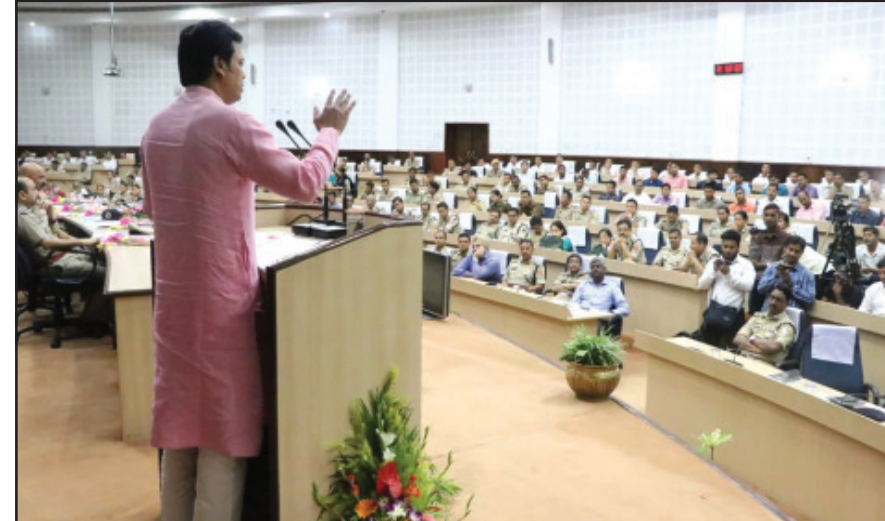
আয়োজিত এই কর্মশালায় ৫০ জন পুলিশ অধিকারিককে মহিলা সংক্রান্ত অপরাধে তদন্তের বিষয়ে প্রশিক্ষণ দেওয়া হবে। এঁদের মধ্যে উদ্বোধনী ভাষণে মুখ্যমন্ত্রী দেব বলেন, ত্রিপুরায় মহিলাদের দায়িত্ব নেওয়ার পর রাজ্যে মহিলা সংক্রান্ত অপরাধ অনেক কমেছে। এটা রাজ্যের জন্য একটা শুভ লক্ষণ