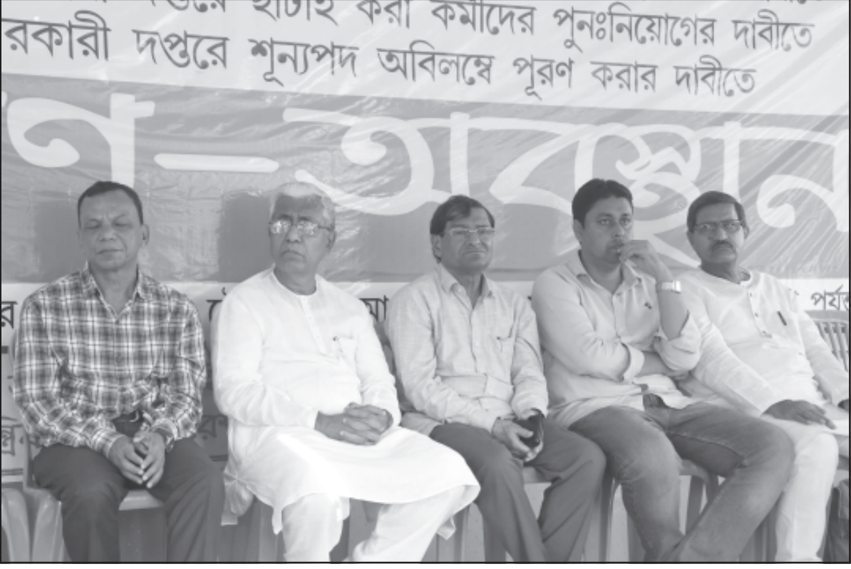
শুক্রবার আগরতলায় ডিওয়াইএফআইয়ের গণ অবস্থানে বিরোধী দলনেতা মানিক সরকার সহ অন্যান্যরা।