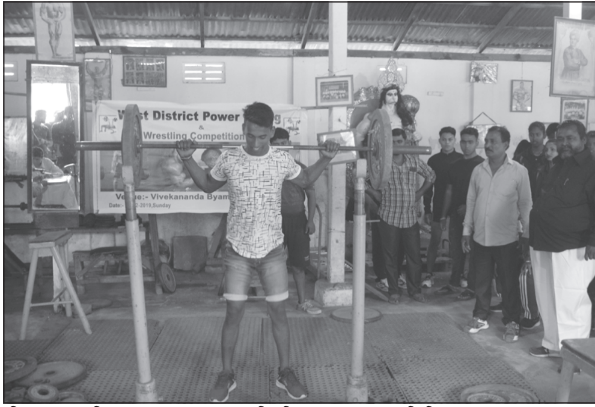
রবিবার আগরতলার বিবেকানন্দ ব্যায়ামাগারে ভরোস্তলন প্রতিযোগিতার আয়োজন করা হয়।