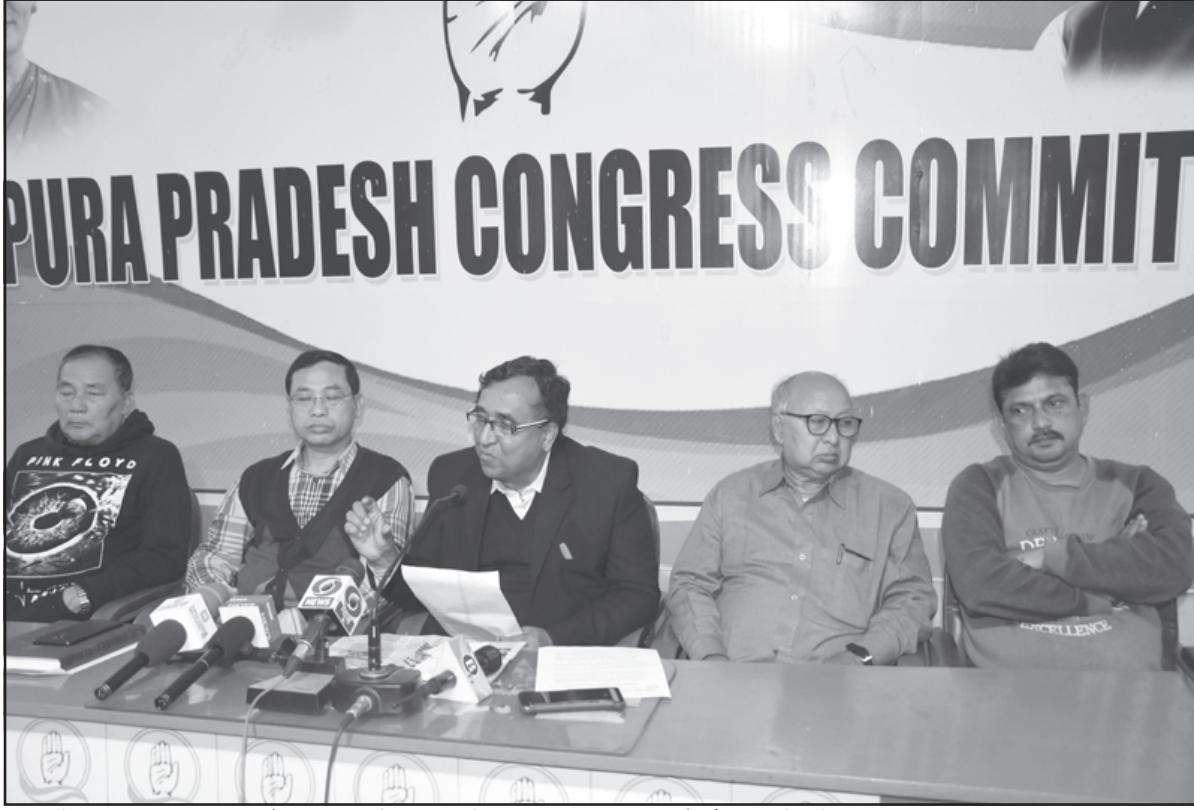
বৃহস্পতিবার কংগ্রেস সদর কার্যালয়ে আয়োজিত সাংবাদিক সম্মেলনে দলের কর্মকর্তারা।

অমরাবতী, ১৬ জানুয়ারি (হি.স.): নতুন বছর ও দশকে দক্ষিণাচারের রাজনীতিতে নয়া চমক। বিজেপির সঙ্গে জোট বঁধল অভিনেতা পবন কল্যাণের দল জনসেনা পার্টি। বৃহস্পতিবার অন্ধ্রপ্রদেশের বিজয়গুড়ায় রাজ্য বিজেপির সভাপতি কামা লক্ষ্মীনারায়ণ এবং জনসেনা পার্টির সূত্রিমে পবন কল্যাণের উপস্থিতিতে এই জোটের আনুষ্ঠানিক ঘোষণা করা হয়। সাংসাদায়িক, পারিবারতাত্ত্বিক, দুর্নীতিগ্রস্ত শক্তিকে ক্ষমতাচ্যুত করা এবং ২০২৪ সালে রাজ্যে ক্ষমতায় আসাই এই জোটের উদ্দেশ্য বলে যৌথ সাংবাদিক সম্মেলন করে জানানো হয়েছে। এদিন যৌথ সাংবাদিক সম্মেলন করেন জনসেনা পার্টির সূত্রিমে পবন কল্যাণ এবং রাজ্য বিজেপির সভাপতি কামা লক্ষ্মীনারায়ণ। সার্বিক উন্নয়ন এবং রাজ্যের স্বার্থকে রক্ষা করার জন্যই এই জোট গড়ে তোলা হয়েছে। ২০২৪ সালে ক্ষমতায় আসাই এই জোটের মূল লক্ষ্য। আসন্ন পৌরনির্বাচনের মাধ্যম জোট নিজেদের শক্তি প্রদর্শন করবে বলে জানা গিয়েছে। উল্লেখ করা যেতে পারে, এতদিন পর্যন্ত অন্ধ্রপ্রদেশের রাজনীতিতে মূল লড়াইটা ছিল ওয়াইএসআর কংগ্রেস বনাম টিডিপি। সেখানে এখন তৃতীয় শক্তি বা রাজনৈতিক বিকল্প হিসেবে আত্মপ্রকাশ করল এই জোট। প্রসঙ্গত আগে বিজেপির সঙ্গে জোট টিডিপি। কিন্তু রাজ্যের বিশেষ মর্যাদার দাবিতে ২০১৯ সালের সাধারণ নির্বাচনের আগেই জোট ভেঙে যায়। টিডিপি সঙ্গে আগামীকাল বিজেপি জোটে যাওয়ার কোন সন্তাবনা নেই বলে এদিন সাফ ছয়ের পাতায়