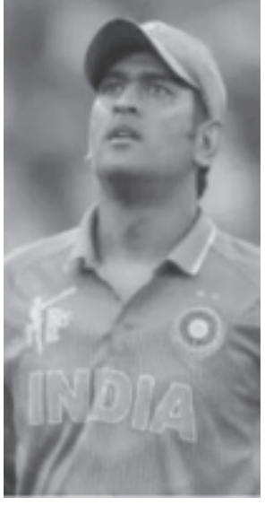
মহেন্দ্র সিং খোনির

বারবেলায় বোমার মতো খবরটা এসে পড়ল ভারতীয় ক্রিকেট সমর্থকদের মাথায়। বিসিসিআইয়ের নতুন বার্ষিক চুক্তি থেকে বাদ দেওয়া হয়েছে ভারতের বিশ্বকাপজয়ী অধিনায়ক মহেন্দ্র সিং খোনিরকে। কারণ হিসেবে খোনিরকে সেন্ট্রাল কন্ট্রোল তালিকা থেকে বাদ দেওয়া হয়েছে। খোনিরকে সেন্ট্রাল কন্ট্রোল তালিকা থেকে বাদ দেওয়ার পেছনে ২০১৯ থেকে সেপ্টেম্বর ২০২০ পর্যন্ত খেলোয়াড়দের সেন্ট্রাল কন্ট্রোল তালিকা প্রকাশ করে দিয়েছেন। জসপ্রীত বুমরাহ, রোহিত শর্মা, আর বিরাট কোহলি গ্রেড এ প্লাস তালিকায় রয়েছেন। অন্যদিকে প্রাক্তন অধিনায়ক আর উইকেটকিপার মহেন্দ্র সিং খোনিরকে সেন্ট্রাল কন্ট্রোল থেকে বাদ দেওয়া হয়নি। দীপক চাহার, নন্দীপ সাইনি, ওয়াশিংটন সুন্দর আর হনুমা বিহারীকে এখন বিসিসিআইয়ের সেন্ট্রাল কন্ট্রোল তালিকায় জায়গা দেওয়া হয়েছে। অন্যদিকে বেসিকিছু খেলোয়াড় নিজের জায়গা এই তালিকায় ধরে রেখেছেন। যে কারণে তাদের বিসিসিআই দ্বারা সম্মানিতও করা হয়েছে। গ্রেড ৩ গ্রেড ৪ গ্রেড ৫ গ্রেড ৬ গ্রেড ৭ গ্রেড ৮ গ্রেড ৯ গ্রেড ১০ গ্রেড ১১ গ্রেড ১২ গ্রেড ১৩ গ্রেড ১৪ গ্রেড ১৫ গ্রেড ১৬ গ্রেড ১৭ গ্রেড ১৮ গ্রেড ১৯ গ্রেড ২০ গ্রেড ২১ গ্রেড ২২ গ্রেড ২৩ গ্রেড ২৪ গ্রেড ২৫ গ্রেড ২৬ গ্রেড ২৭ গ্রেড ২৮ গ্রেড ২৯ গ্রেড ৩০