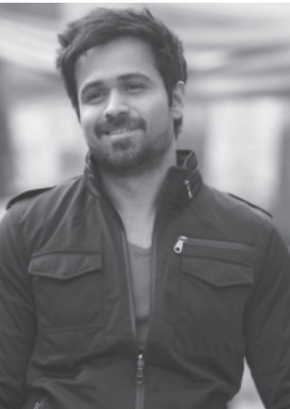
কেকে তিনি সরে যেতে বাধ্য হন বলে জানান কৃতি খারবান্দা। অন্যদিকে স্পন্দিত পুলকিত সম্রাটের সঙ্গে নিজের সম্পর্কের কথা স্বীকার করে নেন কৃতি। তিনি জানান, বর্তমানে পুলকিত সম্রাটের জন ডেট করছেন তিনি। কিন্তু বাবা-মা জানানোর আগে অন্য কাউকে এই খবর জানাতে চাইছিলেন না। সেই কারণেই পুলকিতের সঙ্গে সম্পর্কের কথা এতদিন তিনি চেপে রেখেছিলেন গোটা দুনিয়ার কাছ থেকে।

নিজস্ব প্রতিবেদন : অমিতাভ বচন এবং ইমরান হাসমির পরবর্তী সিনেমা চেহেরে-র জন্য বেছে নেওয়া হল ক্রিস্টিন ডিসুজকে। অর্থাৎ মেগাস্টারের সঙ্গেই বি টাউনে পা রাখছেন টেলিভিশনের এই জনপ্রিয় অভিনেত্রী। স্পন্দিত নিজেই ইনস্টাগ্রাম হ্যাণ্ডলে ইমরান হাসমির সঙ্গে ছবি শেয়ার করেন ক্রিস্টিন। সেখানেই তিনি জানান, কোনও প্রজেক্টে প্রথম পা রাখার অনুভূতি একেবারে অনারকম। চেহেরের জন্য নতুন নায়িকা মনোনীত হওয়ার পর সেই ছবি শেয়ার করেন ট্রেড অ্যানালিস্ট তরুণ আদর্শ ও পরিচালক রুমি জাফরির সিনেমা চেহেরের জন্য প্রথমে বেছে নেওয়া হয় কৃতি খারবান্দাকে। অমিতাভ বচন এবং ইমরান হাসমির এই সিনেমা অন্যতম বড় প্রজেক্ট ছিল কৃতি খারবান্দার জন্য। কিন্তু আচমকই কৃতিকে ওই সিনেমা থেকে বাদ দেওয়া হয়। জানা যায়, অত্যধিক নাক উচু মনোভাবের জন্যই কৃতি খারবান্দাকে ওই সিনেমা থেকে বাদ দেওয়া হয়েছে। পাশাপাশি কৃতির ম্যানেজারও কোনওভাবেই পরিচালককে সাহায্য করছিলেন না। অভিনেত্রীর গুটিং ডেট নির্দিষ্ট করার জন্য। সবকিছু মিলিয়ে এই সিনেমা থেকে বাদ দেওয়া হয় কৃতি খারবান্দাকে যদিও টিম চেহেরের তরফে যে দাবিই করা হোক না কেন, কৃতি খারবান্দার গলায় শোনা যায় অন্য সুর। তিনি দাবি করেন, চেহেরে-তে অপ্রয়োজনীয়ভাবে ঘনিষ্ঠ দৃশ্য এবং চূশন দৃশ্যে অভিনয়ের কথা জানান পরিচালক রুমি জাফরি। সেই কারণেই এই সিনেমা থেকে সরে যান তিনি। এমনকী, চেহেরের জন ২-৩ দিন শূটিং করার পরও ওই প্রজেক্ট