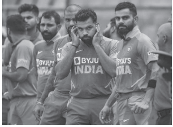
ভারতীয় ক্রিকেট দলের প্রথম একাদশ

ভারত বনাম অস্ট্রেলিয়া: মরণ বাঁচন ম্যাচে কী হতে পারে ভারতের প্রথম একাদশ? মরণ ম্যাচ, অস্ট্রেলিয়ার বিরুদ্ধে রাজকোট মরণ-বাঁচন লড়াইয়ে নামতে চলেছে ভারত। মুম্বইয়ে প্রথম ম্যাচে ব্যাট-বলে দুই বিভাগে পূর্ণ হওয়ার পর কোহলির দল নির্বাচন নিয়ে প্রশ্ন উঠেছে। শুধু তাই নয়, বিরাটের ব্যাটিং অর্ডার নিয়েও ক্রিকেটসমর্থকদের মধ্যে চর্চা তুঙ্গে। একজনকে দেখে নেওয়া যাক, রাজকোটের অজিদের বিরুদ্ধে দ্বিতীয় ওডিআইয়ে ভারতের প্রথম একাদশ কী হতে পারে দুই বিভাগে পূর্ণ হওয়ার পর কোহলির দল নির্বাচন নিয়ে প্রশ্ন উঠেছে।