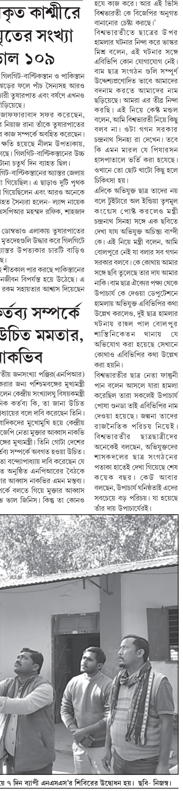
বৃহস্পতিবার এক জাকজমক পূর্ণ অনুষ্ঠানের মধ্য দিয়ে বেঙ্গালক বিদ্যালয়ে ৭ দিন ব্যাপী এনএসএস'র শিবিরের উদ্বোধন হয়।

নয়াদিল্লি, ১৬ জানুয়ারি (হি.স.): জাতীয় জনসংখ্যা পঞ্জির (এনপিআর) বৈঠকে যোগ না দেওয়ার ঘোষণা করার জন্য পশ্চিমবঙ্গের মুখ্যমন্ত্রী মমতা বন্দ্যোপাধ্যায়ের নিন্দায় মুখর হলেন কেন্দ্রীয় সংখ্যালঘু বিষয়কমন্ত্রী মুক্তার আব্বাস নাকভি। সাংবিধানিক কর্তব্য কি, তা জানা উচিত পশ্চিমবঙ্গের মুখ্যমন্ত্রী মমতা বন্দ্যোপাধ্যায়ের বলে দাবি করেছেন তিনি। বৃহস্পতিবার রাজধানী দিল্লিতে সাংবাদিকদের মুখোমুখি হয়ে কেন্দ্রীয় সংখ্যালঘু বিষয়কমন্ত্রী তথা বর্ধমান বিজেপি নেতা মুক্তার আব্বাস নাকভি বলেন, মমতা বন্দ্যোপাধ্যায় পশ্চিমবঙ্গের মুখ্যমন্ত্রী। তিনি গোটা দেশের নেত্রী নন। ফলে তার সাংবিধানিক কর্তব্য সম্পর্কে অবগত হওয়া উচিত। উল্লেখ করা যেতে পারে মুখ্যমন্ত্রী মমতা বন্দ্যোপাধ্যায় দাবি করেছেন যে ১৭ জানুয়ারি তিনি রাজধানী দিল্লিতে অনুষ্ঠিত এনপিআরের বৈঠকে যোগ দেননি না। সেই প্রেক্ষিতে মুক্তার আব্বাস নাকভির এমন মন্তব্য। জেনেইউতে পড়ুয়া আন্দোলন সম্পর্কে বলতে গিয়ে মুক্তার আব্বাস নাকভি জানিয়েছেন, পড়ুয়া বিক্ষোভ ভাল জিনিস। কিন্তু তা কোনও কণিকা লাংথাসার।