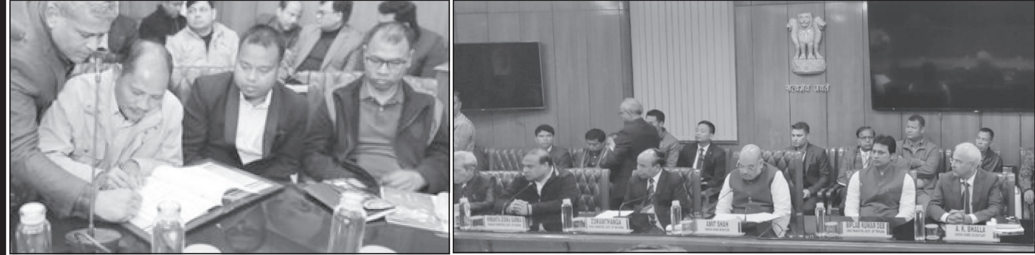
ব্র শরণার্থীদের ত্রিপুরা পুনর্বাসনে চুক্তি স্বাক্ষর করছেন শরণার্থী সংগঠনের নেতারা (বামে)। সাংবাদিক সম্মেলনে কেন্দ্রীয় স্বরাষ্ট্রমন্ত্রী অমিত শাহের সাথে ত্রিপুরা ও মিজোরামের মুখ্যমন্ত্রী সহ অন্যান্যরা।