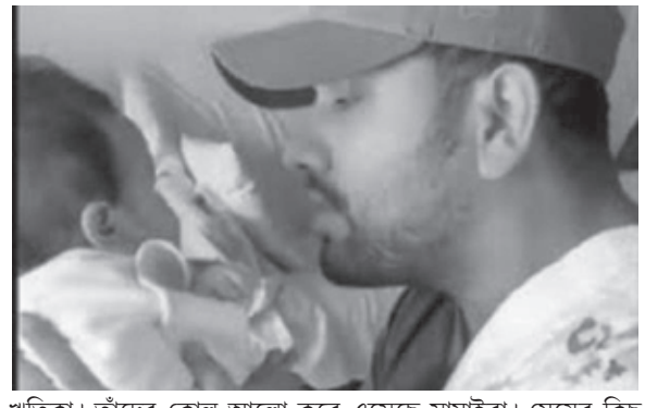
রোহিত শর্মা তার মেয়েকে কোলে ধরে

মুম্বই: ভারতীয় ক্রিকেট দলের অন্যতম নির্ভরযোগ্য ব্যাটসম্যান। তাঁর অন্য নাম হিটম্যানও বটে। ১৯৮৭ সালের ৩০ এপ্রিল জন্মেছেন। ঘরে বাইরে সব কিছুতেই তিনি সমস্ত মানুষের কাছে বেশ পরিচিতি সীমিত ওভারের ক্রিকেটে দেশের অন্যতম নির্ভরযোগ্য নামই রোহিত শর্মা। একদিনের ক্রিকেটে ব্যক্তিগত সর্বোচ্চ রান তাঁর নামেই আছে। সীমিত ওভারের ক্রিকেটে দেশের সহ-অধিনায়কও রোহিত। তিনি আইপিএলে মুম্বই ইন্ডিয়ান্স দলের অধিনায়কও বটে।