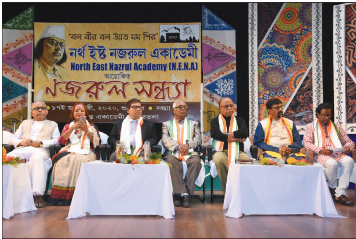
নর্থ ইস্ট নজরুল একাডেমির উদ্যোগে আগরতলা সুকান্ত একাডেমিতে গুজুবীর সন্মান নজরুল সন্ধ্যা অনুষ্ঠানে মঞ্চে উপবিষ্ট বিভিন্ন অভাগতরা।

বেঙ্গালুরু, ১৭ জানুয়ারি (হি.স.): নতুন বছরের শুরুতেই ফের সাফল্য পেলে ভারতীয় মহাকাশ গবেষণা সংস্থা (ইসরো)। সফলভাবে উৎক্ষেপণ হল ভারতের টেলিকমিউনিকেশন স্যাটেলাইট জিস্যাট-৩০ উৎক্ষেপণের সময় অনুযায়ী গুজুবীর ভোররাত ২.৩৫ মিনিট নাগাদ দক্ষিণ আমেরিকার উত্তর-পূর্ব উপকূলবর্তী উৎক্ষেপণ