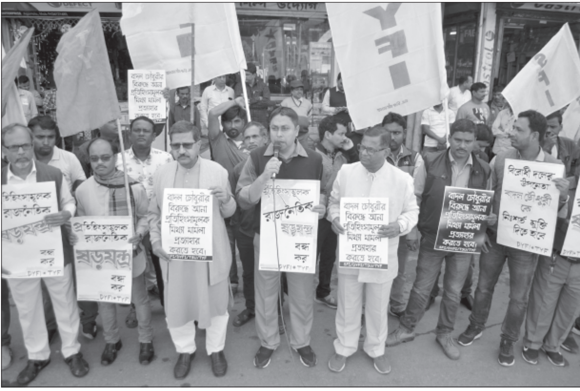
শুক্রবার আগরতলায় ডিওআইএকআইয়ের বিক্ষোভ।