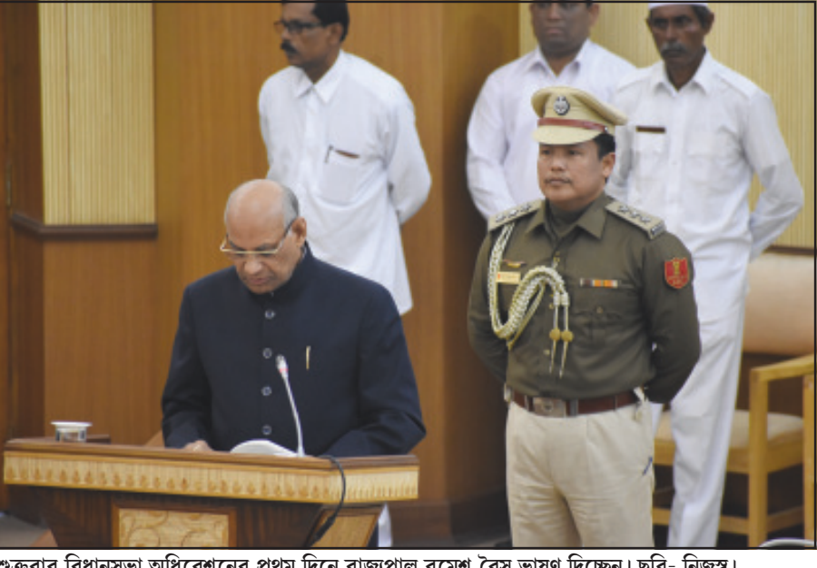
শুক্রবার বিধানসভা অধিবেশনের প্রথম দিনে রাজ্যপাল রমেশ বৈস ভাষণ দিচ্ছেন।

নিজস্ব প্রতিনিধি, আগরতলা, ১৭ জানুয়ারী। ত্রিপুরাকে মডেল রাজ্য করার দৃঢ় প্রত্যয় আজ রাজ্যপালের ভাষণে ফুটে উঠেছে। তাঁর কথায়, নানা প্রচেষ্টায় ত্রিপুরা প্রকৃত অর্থেই মডেল রাজ্যে পরিণত হওয়ার দিকে এগিয়ে যাচ্ছে। কারণ আমাদের শাসন ব্যবস্থার মূল মন্ত্র সব-কস সাথ, সব-কস বিকাশ, সব-কস বিশ্বাস। মূলত, রাজ্যপাল রমেশ বৈস আজ বিধানসভায় নতুন ত্রিপুরা গঠনের দিশা দেখিয়েছেন। সাথে তিনি সংবিধানের ৩৭০ ও ৩৫-ক ধারা বাতিল করে সংসদে জন্ম ও কাশ্মীর পুনর্গঠন আইন পাশের জন্য কেন্দ্রীয় সরকারকে ধন্যবাদ জানিয়েছেন। পাশাপাশি দীর্ঘদিন ধরে বিতর্কিত রাম জমভূমি সমস্যার সমাধানে সুপ্রিমকোর্টের ঐতিহাসিক রায়কে স্বাগত জানিয়েছেন তিনি।