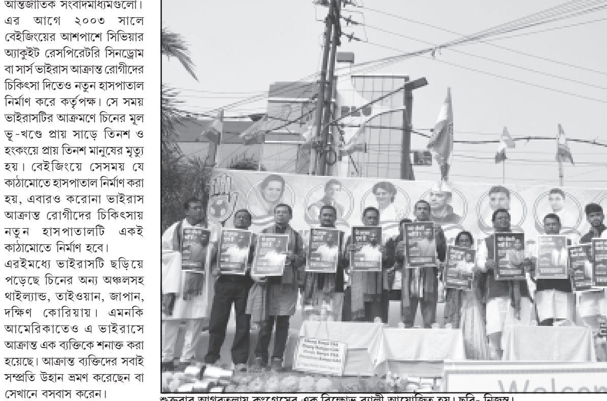
শুক্রবার আগরতলায় কংগ্রেসের এক বিক্ষোভ র্যালী আয়োজিত হয়।