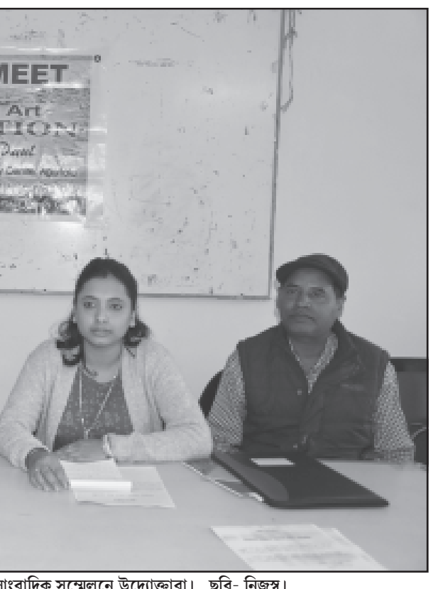
শুক্রবার আগরতলা প্রেস ক্লাবে আয়োজিত একক চিত্র প্রদর্শনি নিয়ে সাংবাদিক সম্মেলনে উদ্যোক্তারা।

কুলতলি, ২৪ জানুয়ারি (হি. স.): গলার নলি কাটা অবস্থায় জোড়া মহিলায় মৃতদেহ উদ্ধার ঘিরে চাঞ্চল্য দক্ষিণ ২৪ পরগণায় কুলতলিতে। তিনশো ফুট তফাতেই এই দেহ ঘিরে রহস্য ঘনিভূত হয়েছে। জানা গিয়েছে, ওই এলাকায় পিয়ালি নদীর চর থেকেই উদ্ধার হয়েছে মৃতদেহ দুটি। একটি বৃহৎ বৃহস্পতিবার রাতেই উদ্ধার হয়েছিল। অন্যটি শুক্রবার ভোরে উদ্ধার করে পুলিশ। তবে এখনও পর্যন্ত মৃত ওই দুই মহিলায় পরিচয় জানা সম্ভব হয়নি। গোটা ঘটনার তদন্ত শুরু করেছে পুলিশ। ঘটনাস্থল থেকে একটি চাদর