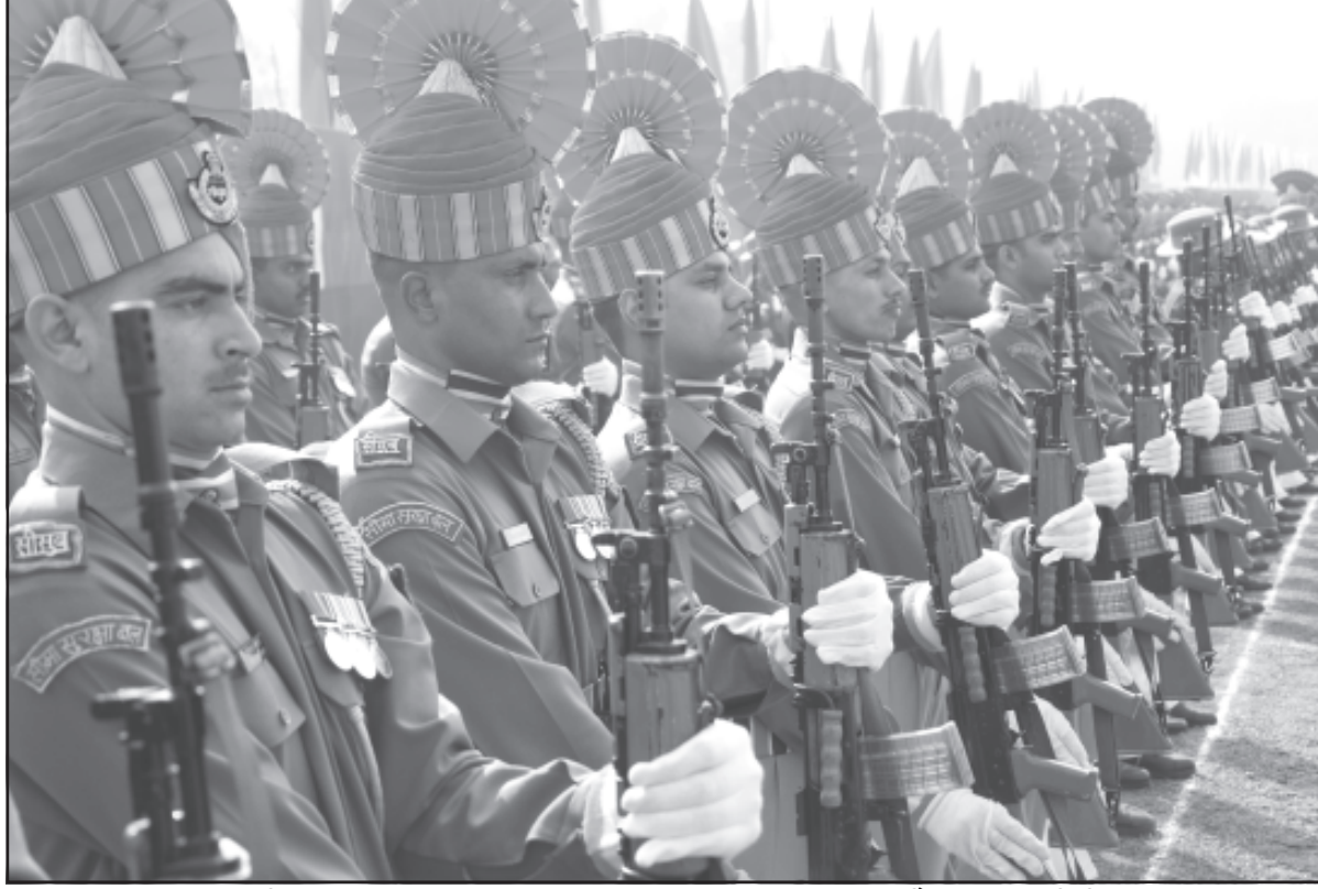
প্রজাতন্ত্র দিবস উপলক্ষে গুরুবীর আসাম রাইফেলস ময়দানে চূড়ান্ত মহড়া অনুষ্ঠিত হয়েছে।