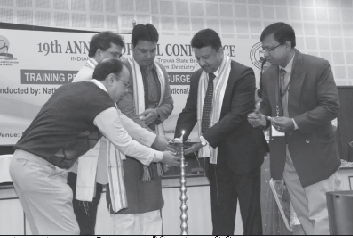
শুক্রবার ১৯তম পোল কনফারেন্স এর উদ্বোধন করেন মুখ্যমন্ত্রী বিপ্লব কুমার দেব।