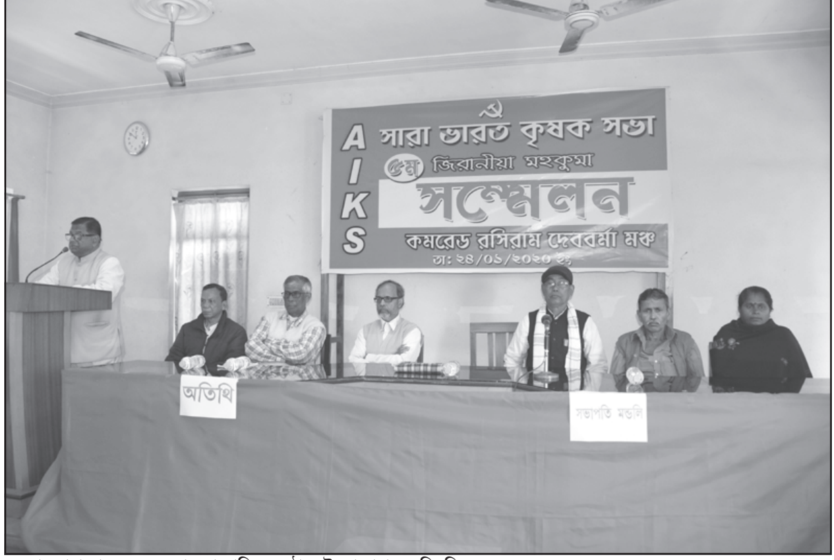
শুক্রবার সারা ভারত কৃষক সভার আয়োজিত অনুষ্ঠানে উদ্যোক্তারা।

কালিম্পং, ২৪ জানুয়ারি (হিস.) : কালিম্পঙে মর্মান্তিক দুর্ঘটনা উ নিয়ন্ত্রণ হারিয়ে তিস্তায় পড়ল গাড়ি উ শুক্রবারের এই ঘটনায় উদ্ধার এক কিশোরীর দেহ উ এখনও নিখোঁজ চারজন উ জানা গেছে শুক্রবার শুক্রবার সকালে কালিম্পঙের জাতীয় সড়ক থেকে নিয়ন্ত্রণ হারিয়ে তিস্তায় পড়ল গাড়ি। নাগাদ সিকিম নম্বরের একটি অলটো-গাড়ি ১০ নম্বর জাতীয় সড়ক থেকে ডুয়ার্সের বীরপাড়ার দিকে যাচ্ছিল। এদিন সকাল ১১টা নাগাদ কালিম্পঙের তিস্তাবাজারে কাছে লিকুভিডে ঘটে দুর্ঘটনা। নিয়ন্ত্রণ হারিয়ে রাস্তার ধারের রেলিং ভেঙে তিস্তা নদীতে পড়ে যায় উ ওই ঘটনায় গাড়িতে এক পরিবার ও চালক-সহ মোট পাঁচজন ছিলেন। খবর পেয়ে ঘটনাস্থানে যায় পুলিশ। নদীতে নামানো হয় ব্যাফিং টিম। ইতিমধ্যেই এক কিশোরীর দেহ উদ্ধার করেছে পুলিশ। বাকিদের খোঁজে চলাছে তত্তালিশ। তবে বাকিদের মৃত্যুর আশঙ্কা করছে পুলিশ। দুর্ঘটনার পর থেকে জেলা পুলিশ ও প্রশাসনের ভূমিকা নিয়ে প্রশ্ন দেখা দিয়েছে।