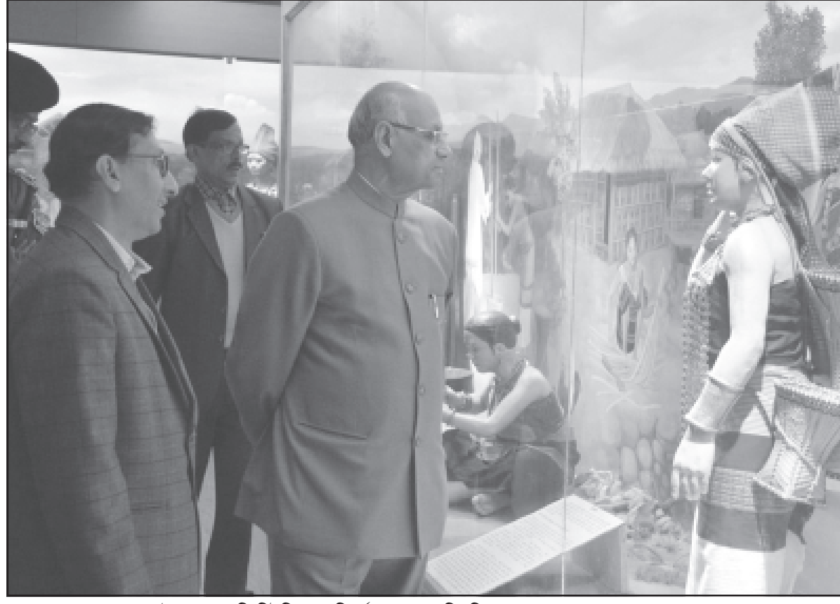
শুক্রবার রাজ্যপাল রমেশ বৈশ্য রাজবাড়ি মিউজিয়াম পরিদর্শন করেন।