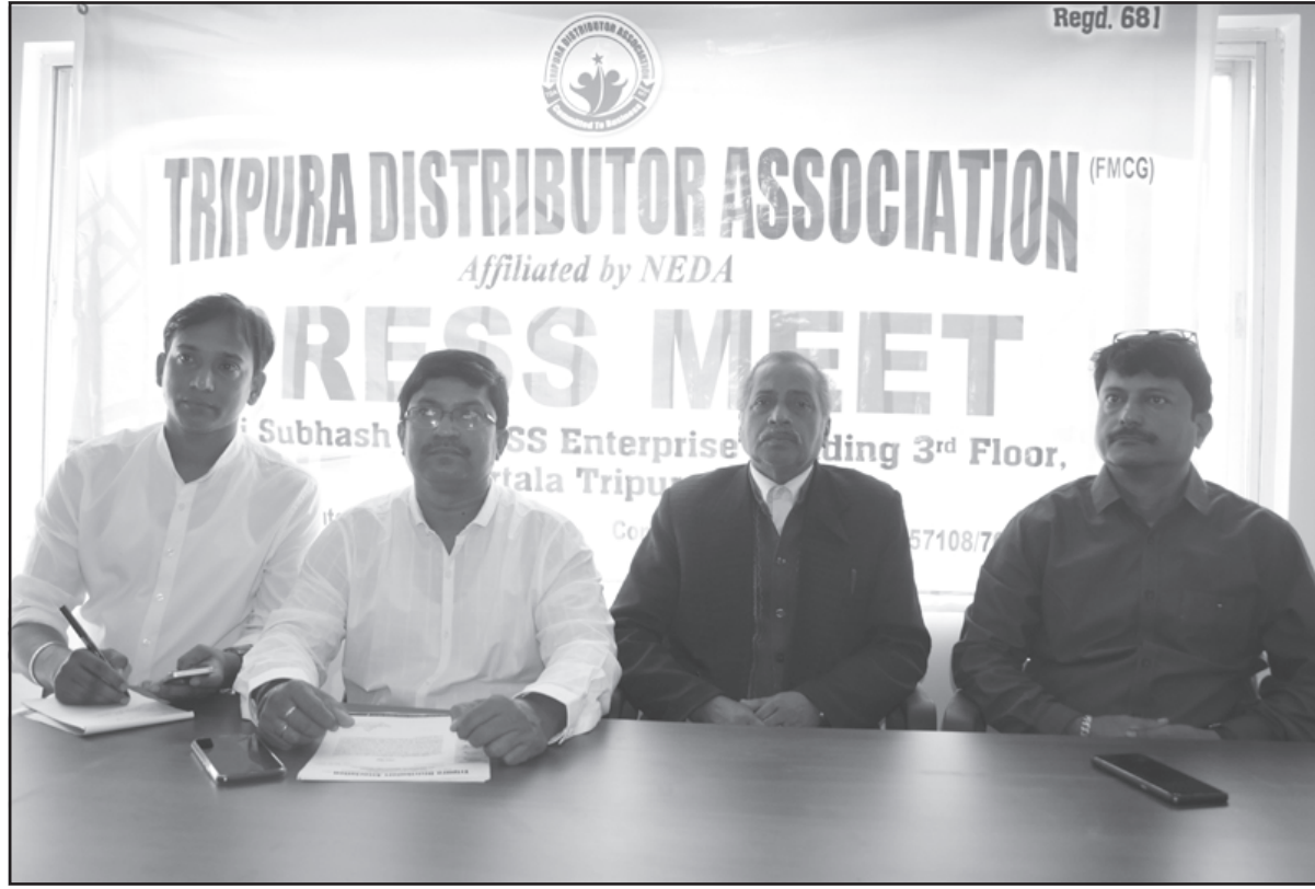
শুক্রবার ত্রিপুরা ডিস্ট্রিবিউটর এসোসিয়ারশনের সাংবাদিক সম্মেলনে কর্মকর্তারা।