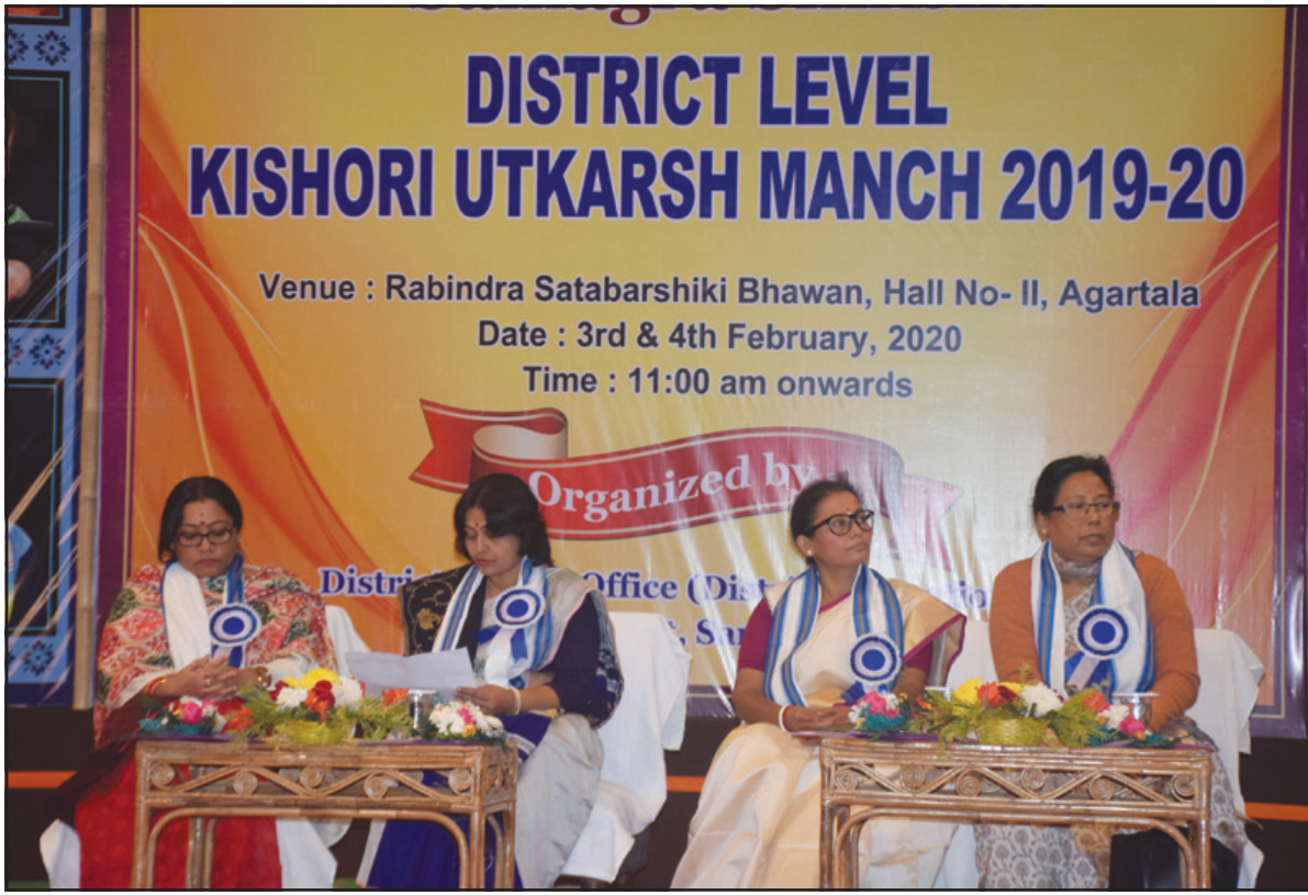
সোমবার আগরতলায় জেলা স্তরে কিশোরী উৎকর্ষ মঞ্চে আয়োজিত অনুষ্ঠান আয়োজিত হয়।

প্রত্যক্ষদর্শীরা এ নিয়ে উল্লেখ প্রকাশ করে বলেন, যে গাড়ি চালক যদি এভাবে মদমত্ত অবস্থায় গাড়ি ড্রাইভ করে তাহলে যাত্রীদের নিরাপত্তার কি হবে? আবার অনেকেই দোষারোপ করেন এ নাটং পয়েন্ট যেখানে নতুন রাস্তা তৈরী