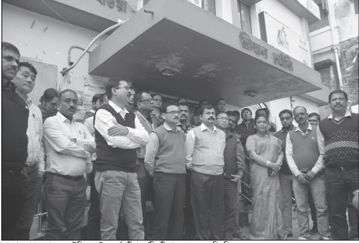
সোমবার আগরতলায় এলআইসি এক্রেণ্ট ও কর্মচারীরা কর্মবিরতী পালন করেন।