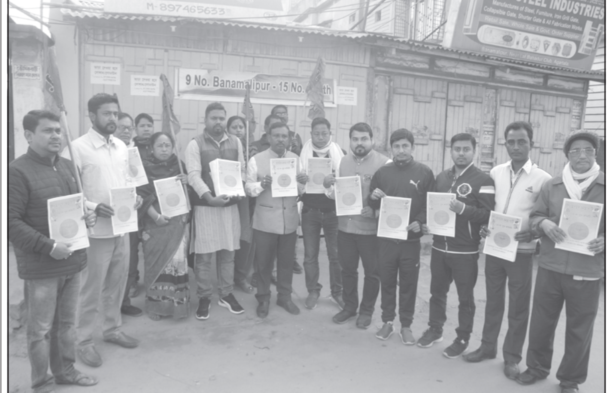
সোমবার বনমালীপুরে ঘর ঘর চলো অভিযানের সূচনা করেন বিজেপি সমর্থকরা।

নয়াদিল্লি, ৩ ফেব্রুয়ারি (হি.স.): সোমবার লোকসভায় রাষ্ট্রপতির ভাষণে ধন্যবাদ প্রস্তাবের আলোচনার সূচনা করে ভারতীয় জনতা পার্টির (বিজেপি) সাংসদ পারভেশ সাহেবই ভাষণে বলেন, নাগরিকত্ব সংশোধনী আইন (সিএএ)-র এ দেশের কোনও নাগরিকের কোনও সম্পর্ক নেই। সুতরাং, এর বিরোধিতার কোন যৌক্তিকতা নেই। তিনি বলেন, যে কোনও পরিস্থিতিতে এই আইন প্রত্যাহার করা হবে না। পার্লেটের ভাষণে ধন্যবাদ জ্ঞাপনের পর এই সভায় বিরোধী সদস্যরা বিরোধিতা করে। ভাষণে তিনি বলেন, নাগরিকত্ব সংশোধনী আইন (সিএএ)-র এ দেশের কোনও নাগরিকের কোনও সম্পর্ক নেই। সুতরাং, এর বিরোধিতার কোন যৌক্তিকতা নেই। তিনি বলেন, যে কোনও পরিস্থিতিতে এই আইন প্রত্যাহার করা হবে না। পার্লেটের ভাষণে ধন্যবাদ জ্ঞাপনের পর এই সভায় বিরোধী সদস্যরা বিরোধিতা করে।