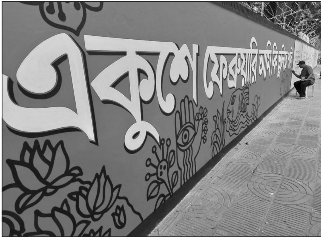
অমর একুশে। সেজে উঠছে বাংলাদেশ। বৃধবার ঢাকা বিশ্ববিদ্যালয় চত্বর থেকে তোলা নিজস্ব ছবি।