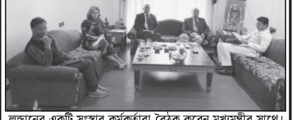
লন্ডনের একটি সংস্থার কর্মকর্তারা বৈঠক করেন মুখ্যমন্ত্রীর সাথে।

নিজস্ব প্রতিনিধি, আগরতলা, ১৯ ফেব্রুয়ারী। রাজ্যে 'সেন্ট সাসটেইনেবলইউনিভার্সিটি হাসপাতাল অ্যান্ড ইন্টিগ্রেটেড হেলথকেয়ার' নামে অত্যাধুনিক হাসপাতাল গড়তে আগ্রহ প্রকাশ করেছে লন্ডনের এইচপি ক্যাপিটাল সংস্থা। বৃহত্তর ন্যায়দিল্লিতে সংস্থার এক প্রতিনিধি দল মুখ্যমন্ত্রী বিপ্রব কুমার দেবের সঙ্গে সাক্ষাৎ করে তাদের এই ইচ্ছার কথা প্রকাশ করেছে। সনাতন ধর্মের আদর্শে খাটি চড়কের নির্দেশিত পথে আয়ুর্বেদিক চিকিৎসা পরিষেবাও দিতে চায় তারা।