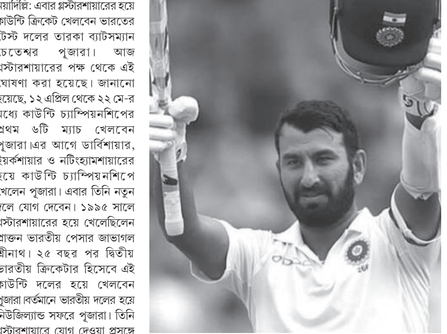
ক্রিকেট ইতিহাস আছে। আমাকে সুযোগ দেওয়ায় গ্লস্টারের কাছে কৃতজ্ঞ। ক্রিসলে সতীর্থদের সঙ্গে মিলিত হওয়া এবং রান করার অপেক্ষায় আছি। গত কয়েক মরশুমে কাউন্টি ক্রিকেট খেলা উপভোগ করেছি। আশা করি আমার খেলার উন্নতি হবে।"

PRESS NOTICE INVITING e-TENDER NO: EE-IED/AMB/20/2019-20 DATED-14.02.2020 The Executive Engineer, Internal Electrification Division, Ambassa, Dhulai Tripura invites on behalf of the governor of Tripura (percentage rate e-tender) from Central & State Public Sector undertaking / Enterprise and eligible Bidders / Firms / Agencies of appropriate class registered with PWD/TAADC/MES/CPWD/Railway up to 17.00 Hrs on 10.03.2020 for the following work: