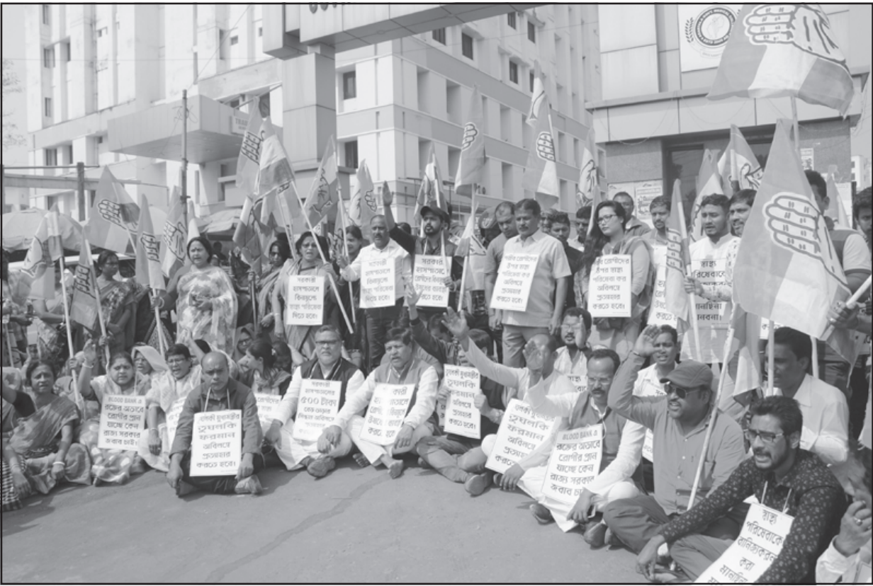
বুধবার আগরতলা জিবি হাসপাতালের সামনে ধর্না প্রদর্শন করে ত্রিপুরা প্রদেশ কংগ্রেসের কর্মীরা।