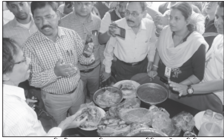
খাদ্য দপ্তরের আধিকারীকরা বৃহত্তর অভিযান চালায় শহরের বিভিন্ন হোটেল।

নেওয়া হয়নি। শুধু হোটেল নয়, রাস্তার বিভিন্ন মোড়ে স্ট্রিট ফুড-এর এখন দারুণ চাহিদা। কিন্তু ওইসব খাবারে গুণমান কতটা বজায় রাখা হচ্ছে, সে নিয়ে প্রশ্ন ওঠা অস্বাভাবিক বলে মনে হচ্ছে। অভিযোগ, বিভিন্ন মিস্ত্রি প্রস্তুতকারক সাংঘাতিক অস্বাস্থ্যকর পদ্ধতিতে মিস্ত্রি তৈরি করছেন। ফলে, ত্রিপুরায় বিশেষ করে আগরতলায় মানুষ পেটের সমস্যায় সবচেয়ে বেশি ভুগছেন।