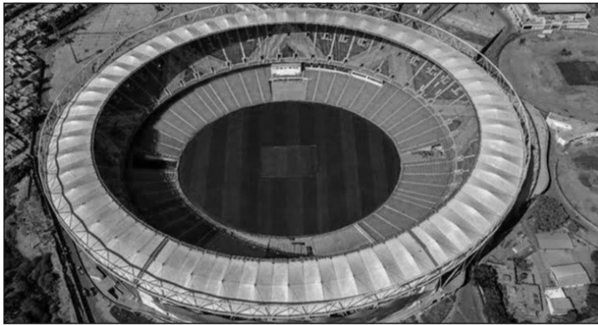
আহমেদাবাদের সর্দার বল্লভভাই প্যাটেল ক্রিকেট স্টেডিয়াম। বিশ্বের মানচিত্রে অন্য জায়গা করে নেবে মোদীর এই 'ড্রিম প্রোজেক্ট'। আগামী বছর ইংল্যান্ডের বিরুদ্ধে বিশ্বের সবচেয়ে বড় ক্রিকেট স্টেডিয়ামে ডে-নাইট টেস্ট খেলবে ভারত। এটি হবে ভারতের মাটিতে দ্বিতীয় গোলাপি বলে দিন-রাতের টেস্ট মাঠ। ২৪ ফেব্রুয়ারি স্টেডিয়াম উদ্বোধনে মার্কিন প্রেসিডেন্ট ডোনাল্ড ট্রাম্প ছাড়াও উপস্থিত থাকবেন মার্কিন যুক্তরাষ্ট্রের ফার্স্ট লেডি মেলানিয়া ট্রাম্পও। বিশ্বের সবচেয়ে বড় ক্রিকেট স্টেডিয়ামের উদ্বোধন ঘিরে নতুন করে সেজে উঠেছে আহমেদাবাদ শহর।

আহমেদাবাদ, ২৩ ফেব্রুয়ারি (হিস.): উদ্বোধনের অপেক্ষায় বিশ্বের সবচেয়ে বড় ক্রিকেট স্টেডিয়াম। আগামীকাল ২৪ ফেব্রুয়ারি মার্কিন প্রেসিডেন্ট ডোনাল্ড ট্রাম্পের হাত ধরে উদ্বোধন হতে চলেছে গুজরাটের আহমেদাবাদের মোতোরায় তৈরী সর্দার বল্লভভাই প্যাটেল ক্রিকেট স্টেডিয়াম। যার দর্শক ধারণ ক্ষমতা থাকছে ১ লাখ ১০ হাজার। গুজরাট ক্রিকেট অ্যাসোসিয়েশনের এই মাঠই বিশ্বের সবচেয়ে বড় ক্রিকেট স্টেডিয়াম। ১ লক্ষ ২৪ দর্শকাসন আসন বিশিষ্ট মেলবোর্ন ক্রিকেট স্টেডিয়ামকে ছাপিয়ে ভারতের এই মাঠ হচ্ছে বিশ্বের সবচেয়ে বড় ক্রিকেট স্টেডিয়াম। গুজরাটের মুখ্যমন্ত্রী থাকাকালীন বিশ্বের সবচেয়ে বড় ক্রিকেট স্টেডিয়ামের স্বপ্ন দেখেছিলেন নরেন্দ্র মোদী। গান্ধীনগর থেকে নয়াদিল্লি সফরে প্রধানমন্ত্রী মোদীর সেই স্বপ্ন সত্যি হওয়ার পথে। আগামীকাল প্রেসিডেন্ট ডোনাল্ড ট্রাম্পের হাত ধরে উদ্বোধন হচ্ছে