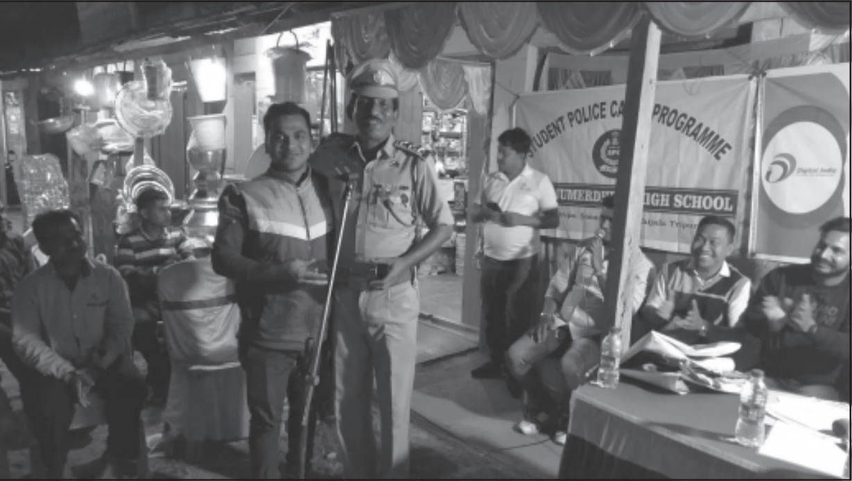
কমন সার্ভিস সেন্টারের উদ্যোগে সড়ক সুরকার উপর সচেতনতা কর্মসূচী অনুষ্ঠিত হয়েছে বেরাগীবাজারে।