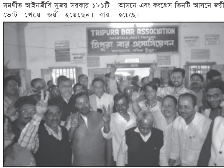
ত্রিপুরা বার এসোসিয়েশনের নির্বাচনে জয়ের উল্লাস। রবিবার ভোলা

নিজস্ব প্রতিনিধি, আগরতলা, ২৩ ফেব্রুয়ারী।। মোহভঙ্গ নাকি অন্তর্কৌন্দলের বহিঃপ্রকাশ। বার এসোসিয়েশনের নির্বাচনে তা মূল্যায়নের তাগিদ অনুভব করবে শাসক দল বিজেপি, এমনটা মনে করা হচ্ছে। কারণ, এক বছরের মধ্যেই বার এসোসিয়েশনের নির্বাচনে ফলাফল সম্পূর্ণ উল্টে গিয়েছে। আজ ত্রিপুরা বার এসোসিয়েশনের ২০২০-২১ বছরের নতুন কমিটি গঠিত হয়েছে। তাতে, সংবিধান বাঁচাও মঞ্চের আড়ালে শাসক বিরোধী জোট জরী হয়েছে। শাসক দল বিজেপি সমর্থিত আইনজীবীদের সংগঠন মাত্র ৩টি আসনে জরী হয়ে মুখ রক্ষা করতে পেয়েছে। সিপিএম ও কংগ্রেস ছাড়াই আসনে জরী হয়েছে।