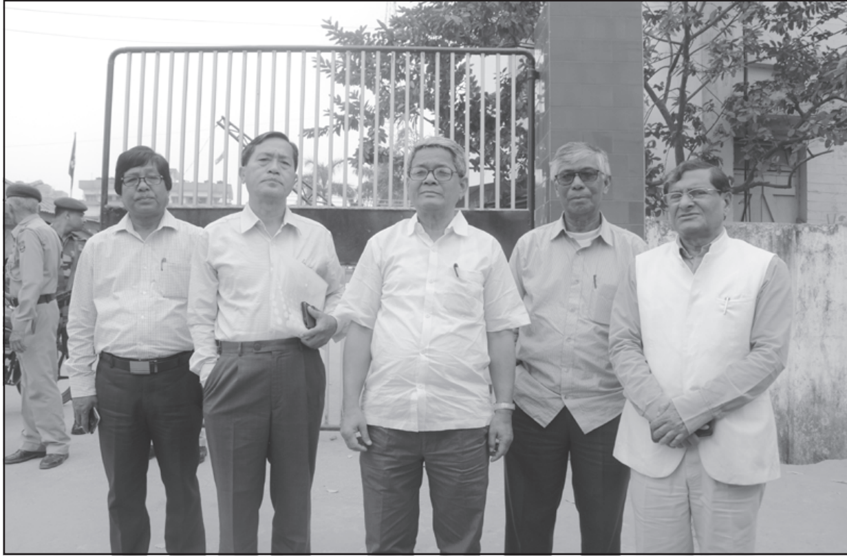
সোমবার পুলিশ কার্যালয়ে ভারপ্রাপ্ত ডিভির কাছে ডেপুটিশন প্রদান করেন সিপিএম দলের কর্মকর্তারা।