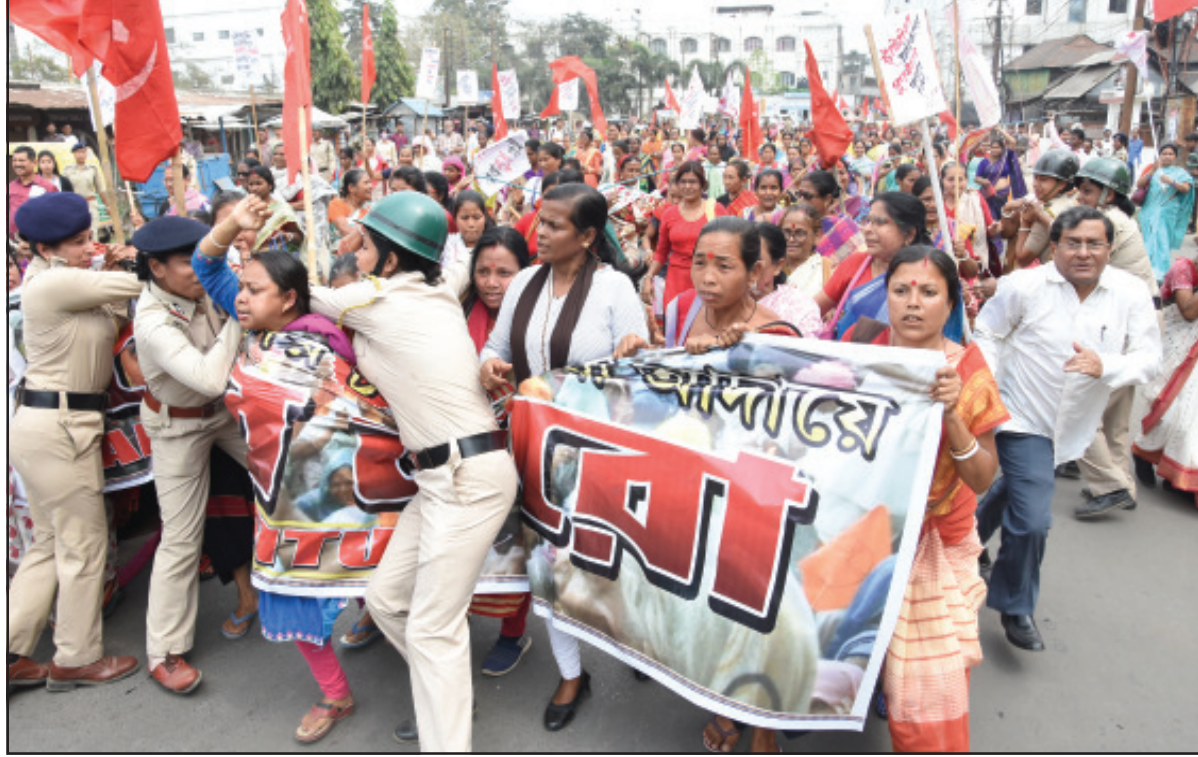
শুক্রবার আট দফা দাবীতে আগরতলায় আইন অমান্য আন্দোলন শ্রমজীবী মহিলা সমন্বয় কমিটির।