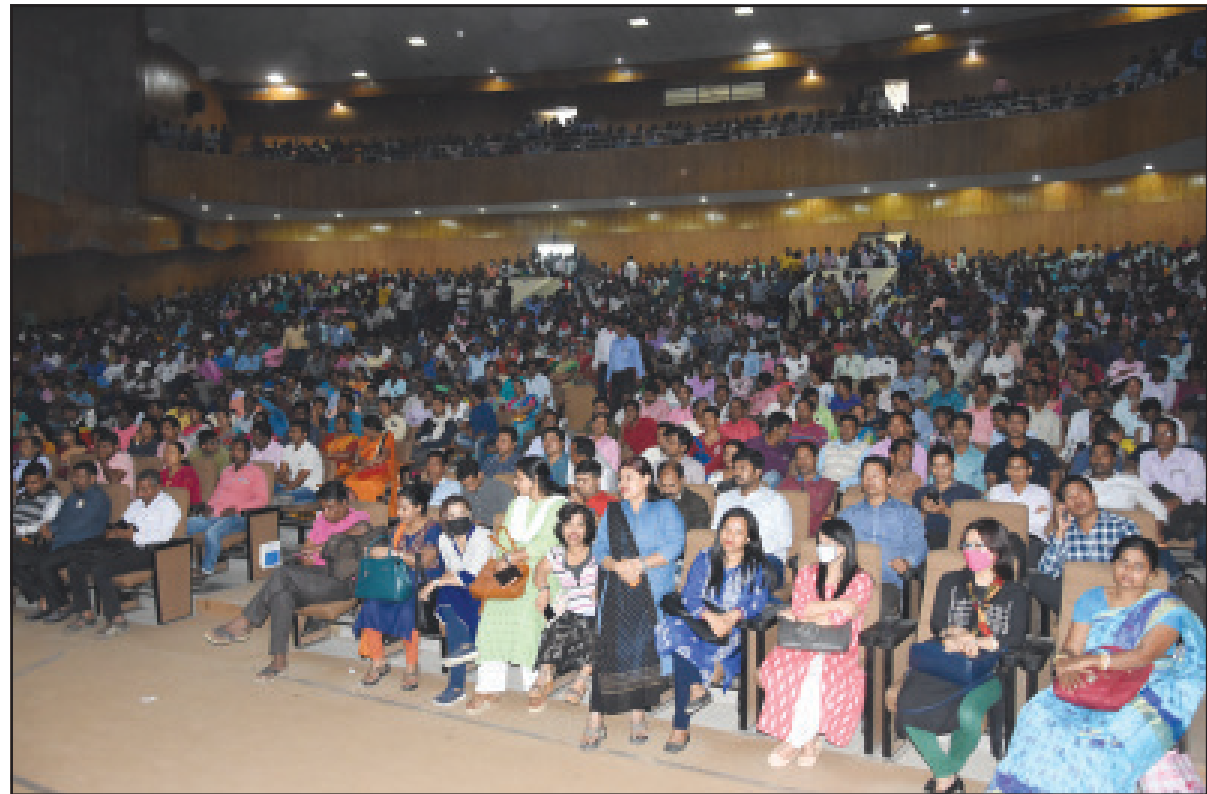
বৃহবার আগরতলায় ১০১৩৩ শিক্ষক কর্মচারীদের সভা অনুষ্ঠিত হয়।