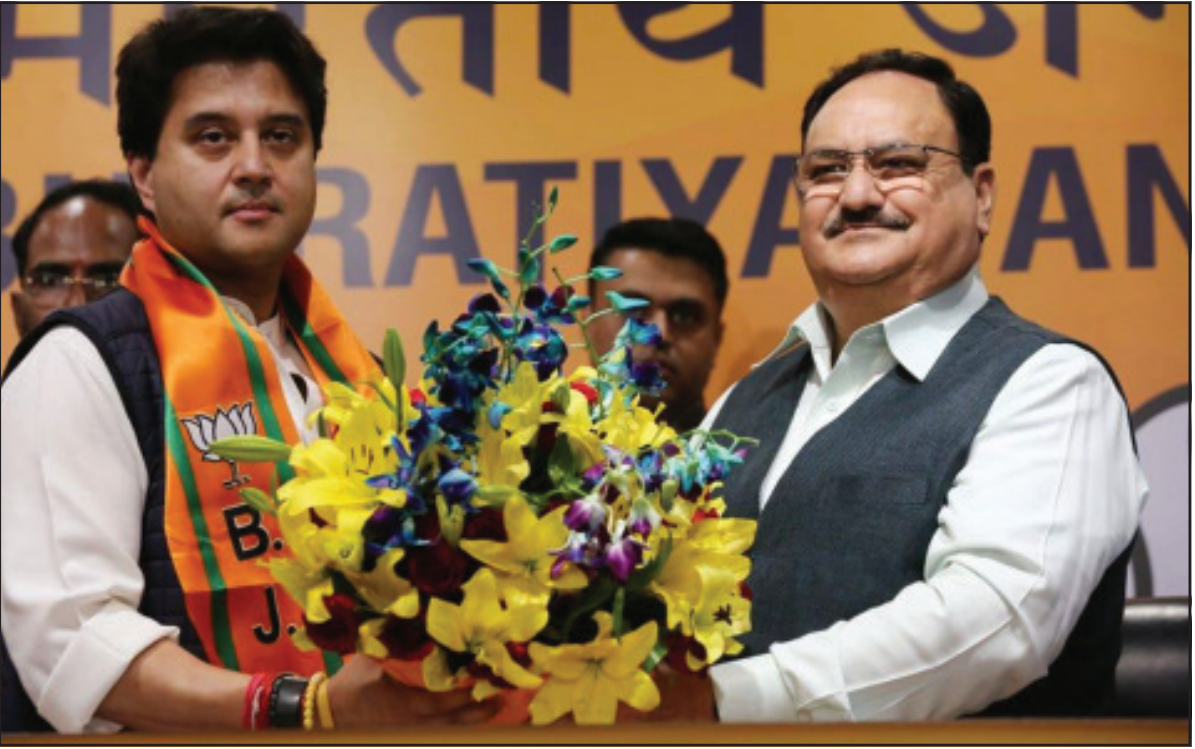
বৃহবার নয়াদিল্লিতে বিজেপির সভাপতি জে পি নাড্ডা কংগ্রেস ছেড়ে আসা জ্যোতিরাদিত্য সিদ্ধিয়াকে দলে বরণ করে নেন।