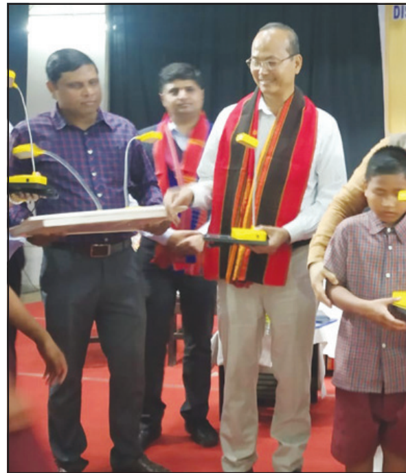
বৃহবার সিপাহীজলা জেলাতেই স্কুলে পাঠরত ছাত্রছাত্রীদের মধ্যে সোলার স্টাডি লাইট বিতরণ করেন উপমুখ্যমন্ত্রী। ছবি- নিজস্ব।

সিউড়ি, ১১ মার্চ (হি.স.) : স্কের ধর্ষণের অভিযোগে বীরভূমে। এবার এক মুক ও বধির নাবালিকাকে ধর্ষণের অভিযোগে চাঞ্চল্য ছড়িয়েছে বীরভূমের দুবরাজপুর থানা এলাকার প্রত্যন্ত গ্রামে। হাত, পা বেঁধে রাতের অন্ধকারে ওই নাবালিকাকে ধর্ষণের অভিযোগে উঠেছে গ্রামেরই এক তরুণের বিরুদ্ধে। গ্রামবাসীদের চাপে পুলিশ অভিযোগ নিলেও অভিযুক্ত এখনও পলাতক। নির্যাতিতা নাবালিকাকে বৃহবার সকালে সিউড়ি সদর হাসপাতালে নিয়ে ভর্তি করা হয়েছে স্বাস্থ্য পরীক্ষার জন্য। গ্রাম সূত্রে জানা গেছে, মঙ্গলবার রাতে গ্রামের মন্দিরের পাশে বসেছিল হতদরিদ্র দিনমজুর পরিবারের মুক ও বধির নাবালিকা। সেই সময় গ্রামেরই