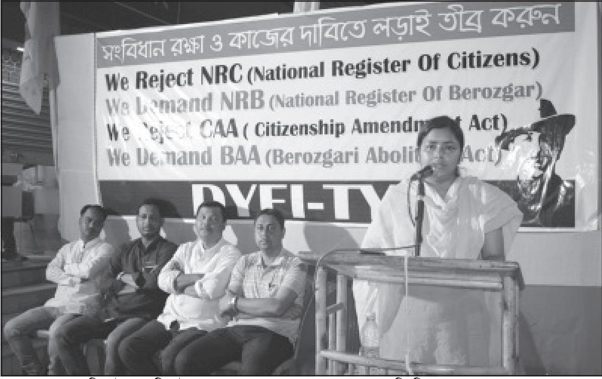
বৃহবার আগরতলায় ডিওয়াইএফ ও টিওয়াইএফ এক আলোচনা সভার আয়োজন করেন।