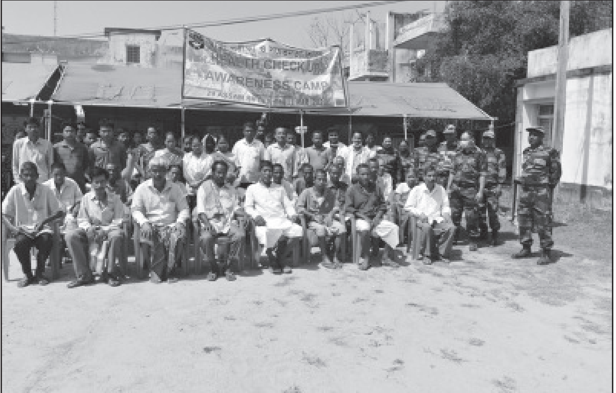
বৃহবার ২৯সং আসাম রাইফেলস এর উদ্যোগে এক স্বাস্থ্য শিবির আয়োজিত হয় খোয়াই জেলায়।