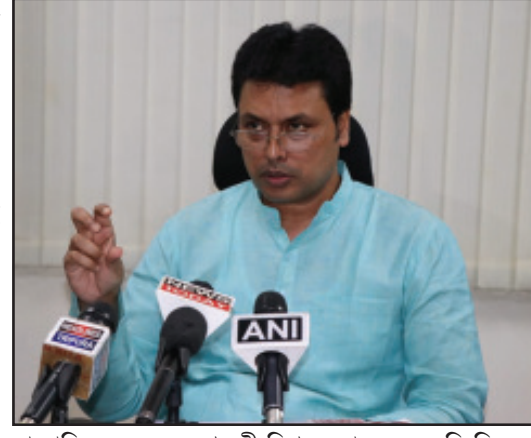
সাংবাদিক সম্মেলনে মুখ্যমন্ত্রী বিপ্লব কুমার দেব।

নিজস্ব প্রতিনিধি, আগরতলা, ১২ মার্চ। করোনা ভাইরাস নিয়ে দুশ্চিন্তার কোন প্রয়োজন নেই। কারণ, ত্রিপুরায় এখানে কোভিড ওই মরণঘাটিনে আক্রান্ত হননি। শুধু তাই নয়, বাইরে থেকে এসে কোন আক্রান্ত রোগী ত্রিপুরায় রয়েছেন এমন পাওয়া যায়নি। তবে, সতর্ক থাকা খুবই জরুরি। শুক্রবার রাতে সচিবালয়ে সাংবাদিক সম্মেলনে এইভাবেই সন্দেহকে অভয় দিলেন ত্রিপুরার মুখ্যমন্ত্রী বিপ্লব কুমার দেব। সাথে তিনি জানিয়েছেন, ত্রিপুরায় এপিডেমিক ডিজিজ এক্ট ১৮৯৭ লাও করা হয়েছে। তাতে, ওই ভাইরাসের প্রাদুর্ভাব দেখা দিলে স্বাস্থ্য কর্মীদের ২৪ ঘণ্টা চিকিৎসা কাজে নিয়োজিত থাকবেন। তাছাড়া, যেকোন সভা, সমাবেশ, মিছিল, মেলা ইত্যাদি ওই আইনের ক্ষমতাবলে বন্ধ কিংবা স্থগিত রাখা যাবে। এদিন তিনি বলেন, করোনা ভাইরাস-র জন্য বিশ্ব স্বাস্থ্য সংস্থা গোটা বিশ্বে মহামারী ঘোষণা করেছে। ত্রিপুরায় ২৮ জানুয়ারি থেকে করোনা ভাইরাস-র জন্য নজরদারি চালানো হচ্ছে। ত্রিপুরায় সমস্ত পরীক্ষা-নিরীক্ষার ব্যবস্থাও করা হয়েছে। তাঁর দাবি, বর্তমানে জি বি হাসপাতালে করোনা ভাইরাসের সমস্ত পরীক্ষা করা হচ্ছে। এর জন্য রক্তের নমুনা বাইরে পাঠানো কোন প্রয়োজন নেই। তাঁর কথায়, ইতিমধ্যে চারটি স্থান চিহ্নিত করা হয়েছে। ওই রোগের প্রাদুর্ভাব দেখা দিলে আক্রান্ত রোগীদের চিকিৎসা করা হবে সেখানে। তিনি বলেন, এখন পর্যন্ত ৩৭ জনকে করোনা ভাইরাসে আক্রান্ত বলে সন্দেহ করা