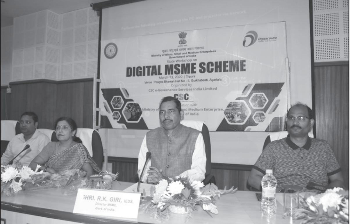
গুরুবাবর ডিজিটাল এমএমএমই স্কিমে আয়োজিত অনুষ্ঠানে কর্মকর্তারা।