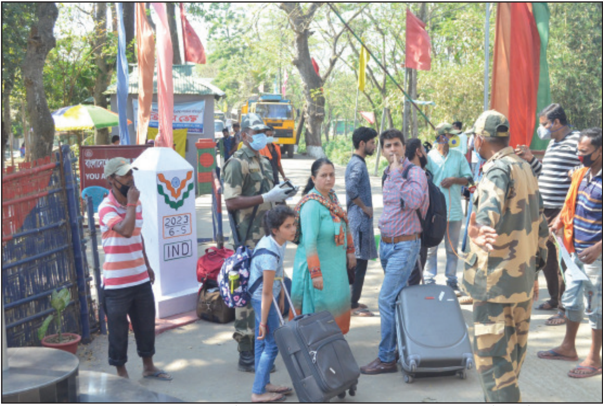
স্বদেশে ফেরত যেতে বাংলাদেশের নাগরিকরা আগরতলায় আখাউড়া চেকপোস্টে। শুক্রবার তোলা নিজস্ব ছবি।

হয়েছে, নাকি খুন করার পর মৃতদেহ আগুনে পুড়িয়ে ফেলা হয়েছে, পুলিশ তার তদন্ত করছে। ওই ঘটনায় সন্দেহভাজন এক যুবককে পুলিশ আটক করেছে। এলাকায় বিশাল পুলিশ বাহিনী মোতায়েন করা হয়েছে। কারণ, পরিস্থিতি উত্তপ্ত হয়ে রয়েছে। পশ্চিম ত্রিপুরা জেলার সিধাই থানায় রাস্তাছড়া গ্রামে খালি জমিতে শুক্রবার সকালে এক যুবতীর অগ্নিদগ্ধ মৃতদেহ উদ্ধার হয়েছে। বছর বাইশের ওই যুবতী গতকাল বিকেলে কেনাকাটার জন্য বাড়ি থেকে বেরিয়েছিলেন। তার পর আর বাড়ি ফেরেননি। রাস্তাছড়া গ্রামের ওই যুবতীর পরিবার ৬ এর পাতায় দেখুন