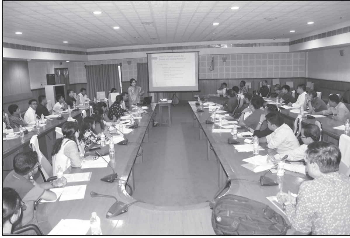
শুক্রবার আগরতলায় কোরনা ভাইরাস নিয়ে আয়োজিত সেমিনারে কর্মকর্তারা।