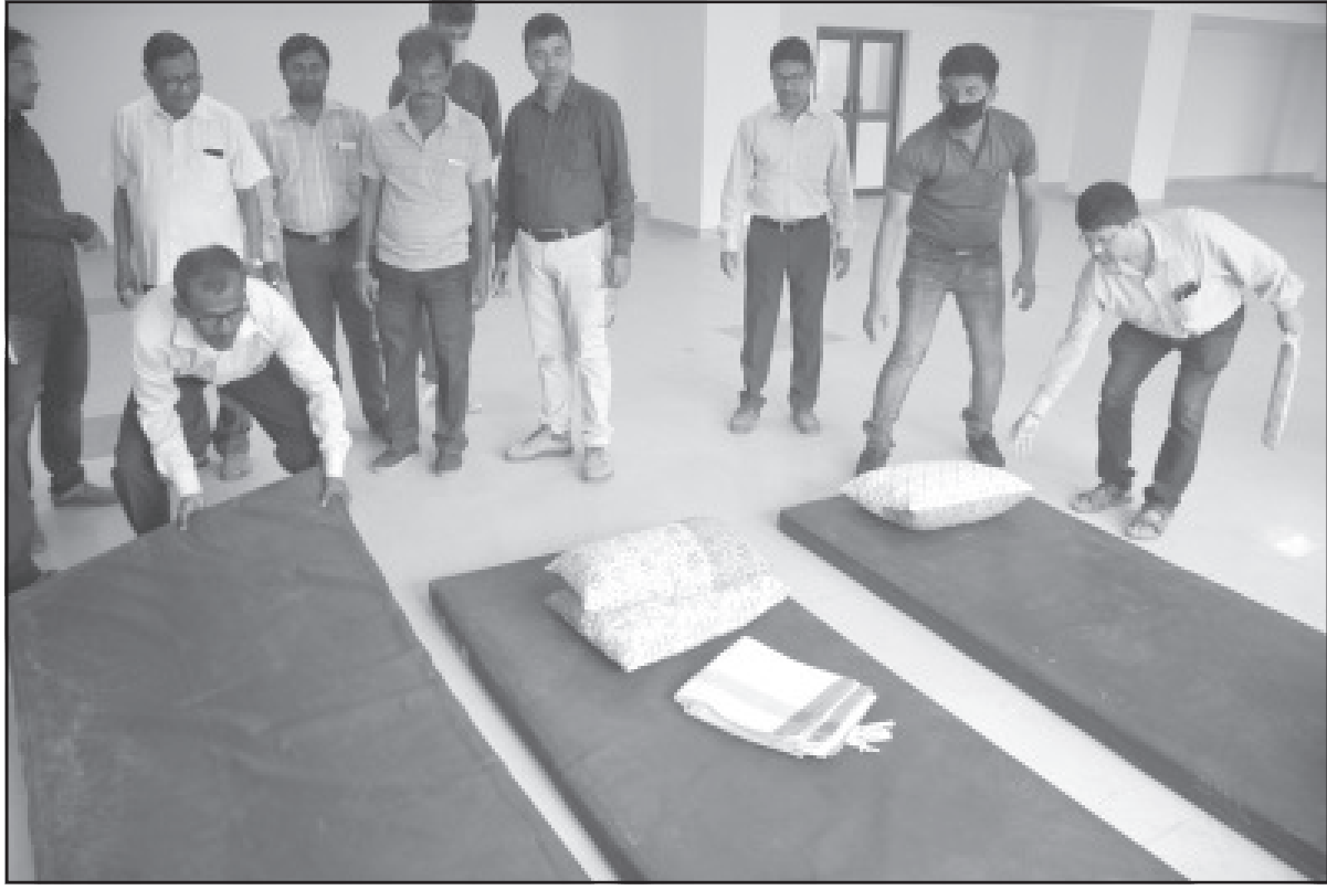
গুরুবাবর আইজিএম হাসপাতালে করোনা আক্রান্ত কোনও রোগী রাজ্যে চিহ্নিত হলে ওই স্পেশাল ওয়ার্ডে তাকে রাখা হবে।