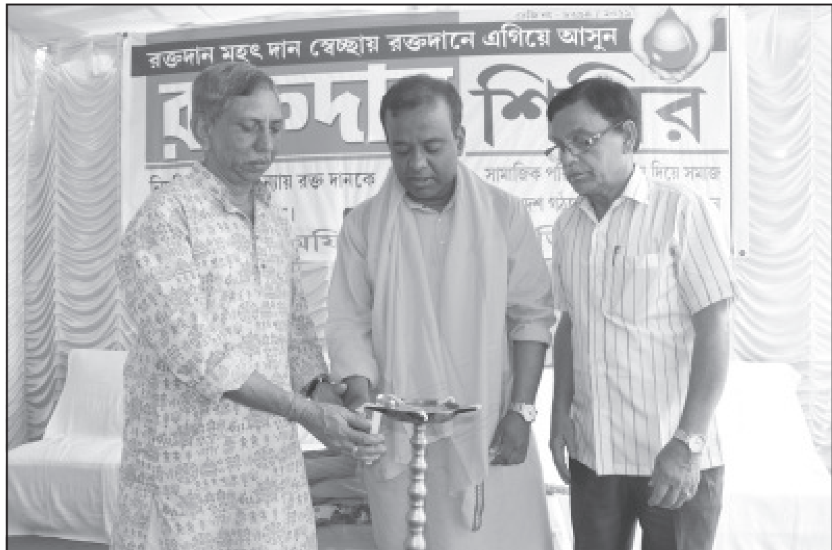
রবিবার আগরতলায় আয়োজিত রক্তদান শিবিরের উদ্বোধন করেন বিজেপি সদর জেলা কর্মীটির সভাপতি।