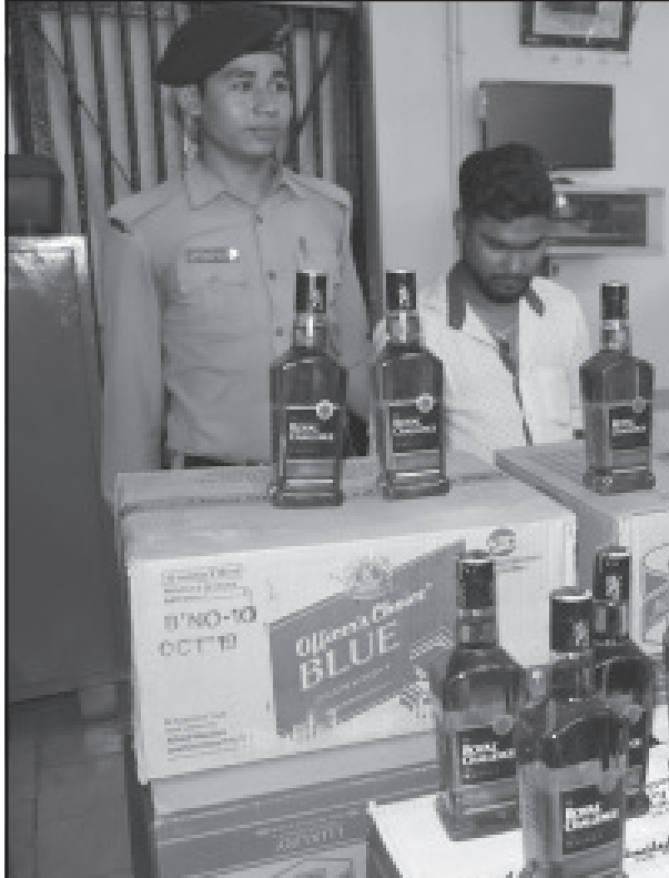
রবিবার পশ্চিম থানার পুলিশ অভিযান চালিয়ে বহু টাকার বিদেশী মদ সহ এক ব্যক্তিকে গ্রেপ্তার করে।

হুগলি, ১৫ মার্চ (হি.স.) : উত্তরপাড়া পুরসভা পরিচালিত মহামায়া স্বাস্থ্যকেন্দ্রে নভেল করোনা ভাইরাসের মোকাবিলায় চারটি আইসোলেশন বেডের উদ্বোধন করলেন পুরচেয়ারম্যান। করোনা মোকাবিলায় রাজ্যের মুখ্যমন্ত্রীর নির্দেশে সতর্কতামূলক ব্যবস্থাগ্রহণ হুগলির উত্তরপাড়া কোতরং পুরসভা পরিচালিত মহামায়া শিশু ও মাতৃ মঙ্গল কেন্দ্রে, চালু করা হল ৪টি শয্যা বিশিষ্ট বিশেষ আইসোলেশন ওয়ার্ড ও এন্থ্রোল্যপ পরিবেশ।