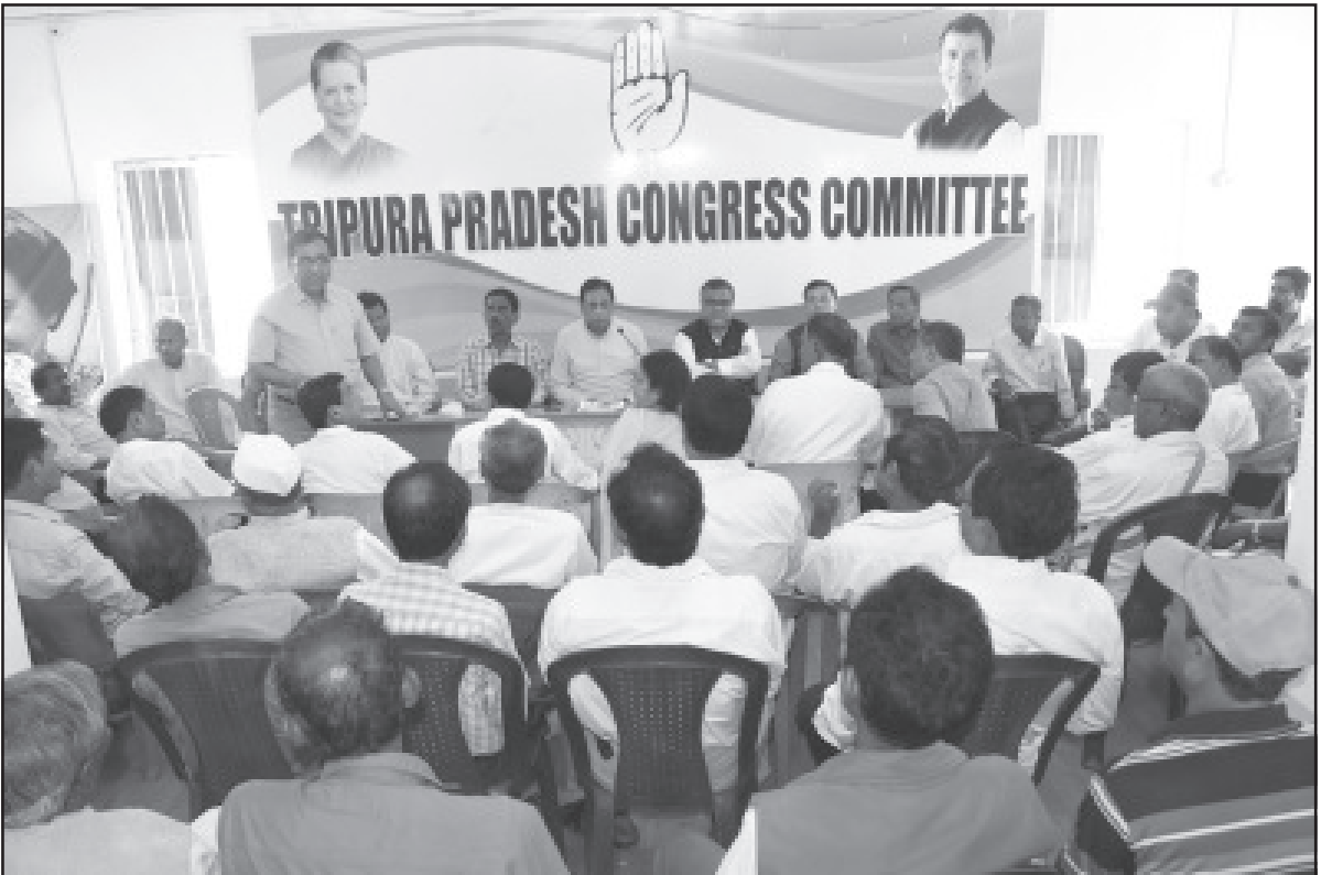
রবিবার আগরতলায় সদর কংগ্রেস কার্যালয়ে দলীয় কর্মীদের নিয়ে এক আলোচনা সভা আয়োজিত হয়। ছবি- নিজস্ব।

কলকাতা, ১৫ মার্চ (হি.স.): রবিবার মনেই বই খাতার পাট চুকিয়ে বাবা মায়ের হাত ধরে ঘুরতে যাওয়ার পালা উ কিন্তু সেই আশায় জল ঢালা উ করোনাভাইরাসের আতঙ্কে বন্ধ কলকাতার একাধিক দর্শনীয় স্থান উ ঘুরতে এসে অনেকেই যখন ফিরে উ তাই মুখভার কলকাতাবাসীর। করোনা আতঙ্কে ঘুম উড়েছে সকলের উ মনে করা হচ্ছে ভিডি থেকে ছড়াতে পারে এই সংক্রমণ উ তাই ভিডি এড়াতে জদুঘরের সামনের গেটে লাগানো হয়েছে বড় তাল উ সঙ্গে নেটিস বোর্ডে লেখা, 'করোনা সংক্রমণের জেরে ৩১ মার্চ পর্যন্ত বন্ধ রাখা হবে ইন্ডিয়ান মিউজিয়াম উ সতর্কতা জারি করা হয়েছে আলিপুর চিড়িয়াখানাতেও উ বন্ধ স্যেঙ্গ সিটি উ অনাদিকে আজ থেকে বন্ধ করে দেওয়া হয়েছে ভিক্টোরিয়া মেমোরিয়ালও উফ লে বহু মানুষকেই ঘুরতে এসে কলকাতার দর্শনীয় স্থান না দেখেই ফিরে যেতে হচ্ছে।