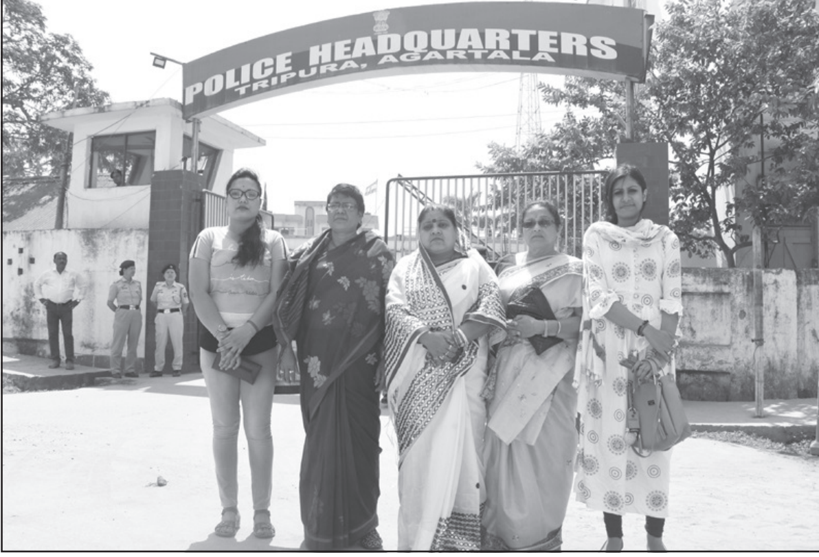
রবিবার পুলিশ সদর কার্যালয়ে রাজা মহিলা কংগ্রেসের এক প্রতিনিধি দল ডেপুটিশন প্রদান করেন।