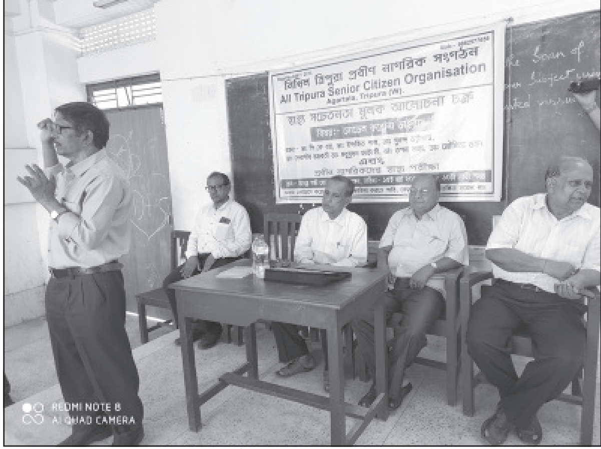
রবিবার আগরতলায় নিখিল ত্রিপুরা প্রবীণ নাগরিক সংগঠনের উদ্যোগে আয়োজিত হয় এক দিনে কর্মশালা।