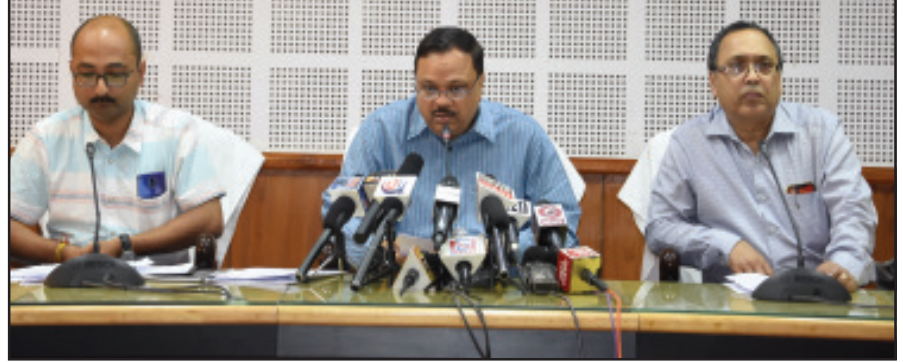
হিসেবে ১৭ মার্চ থেকে ৩১ মার্চ পর্যন্ত সমস্ত স্কুল, কলেজ, বিশ্ববিদ্যালয়, সিনেমা হল, সুইমিং পুল এবং ব্যায়ামাগার বন্ধ থাকবে। তবে, মধ্যশিক্ষা পর্যায় পরিচালিত মাধ্যমিক এবং উচ্চ মাধ্যমিক

হয়েছে। এ-নিয়ে দুবার বিজ্ঞপ্তি জারি করা হয়েছে। তা সত্ত্বেও কিছু কিছু স্থানে জমায়েত লক্ষ্য করা যাচ্ছে। তাই, আট জেলাশাসককে সংশ্লিষ্ট জেলায় ১৪৪ ধারা জারি করার নির্দেশ দেওয়া হয়েছে। এতে, বড় জমায়েত বন্ধ করা সম্ভব বলে মনে করেন তিনি। এদিকে, বিদেশ ভ্রমণ, সামাজিক অনুষ্ঠান এবং মেলা ও উৎসব উদযাপনে ত্রাস টানার জন্য বিজ্ঞপ্তি জারি করা হয়েছে। ওই সব বিজ্ঞপ্তি অনুসারে ওইসব কার্যক্রম ১৫ এপ্রিল পর্যন্ত এই পরিস্থিতি চলবে।