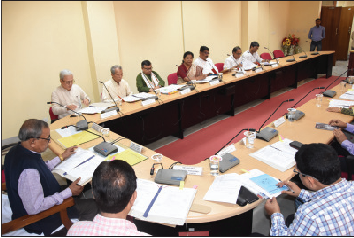
সোমবার বিধানসভা সচিবালয়ে বিজ্ঞান এডভাইজারি কমিটির বৈঠক অনুষ্ঠিত হয়েছে।