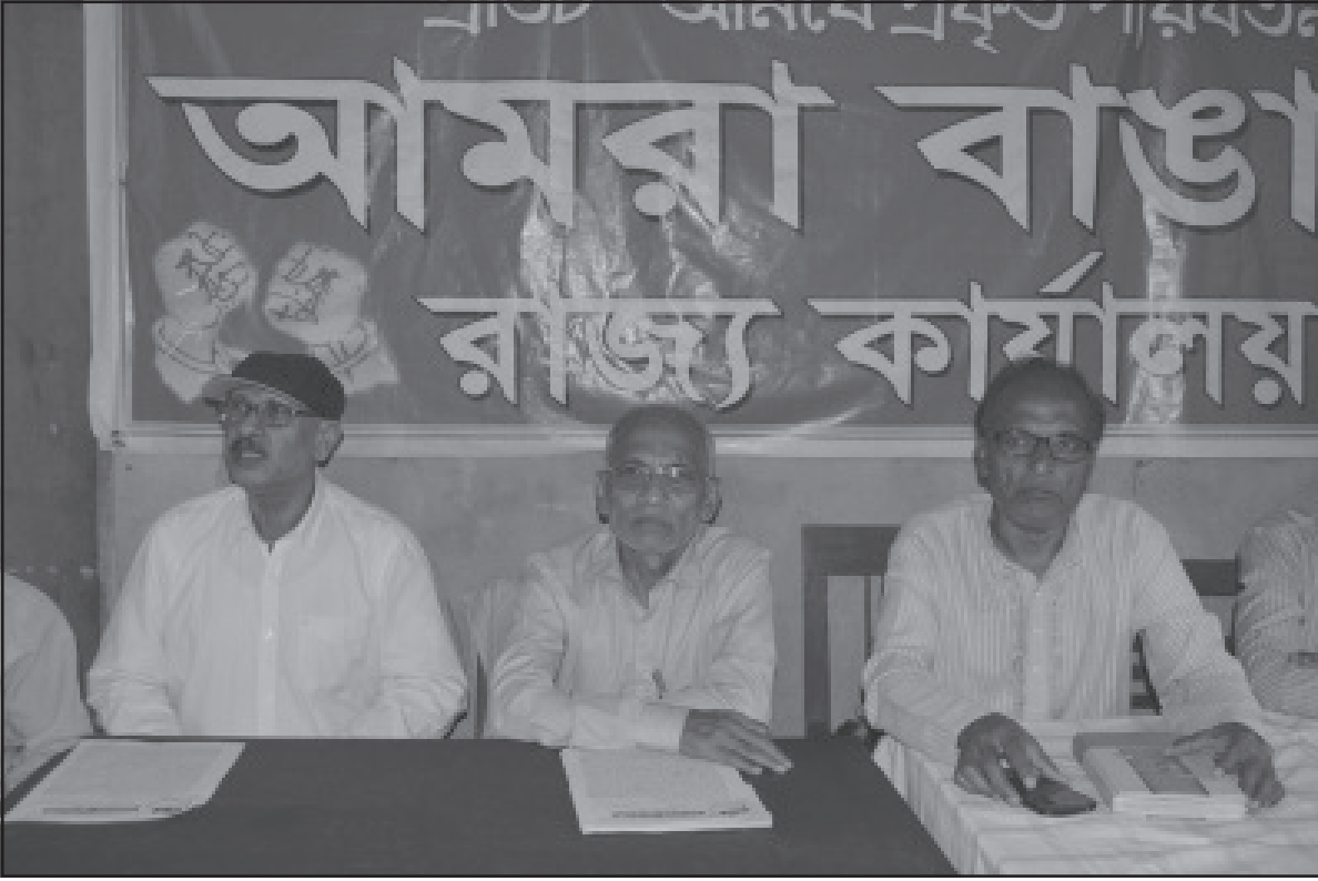
সোমবার আগরতলায় আমরা বাঙালির সদর কার্যালয়ে আয়োজিত সাংবাদিক সম্মেলনে দলের কর্মকর্তারা।