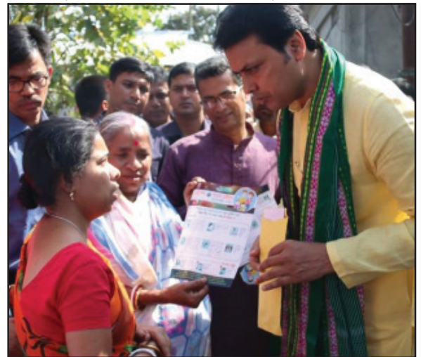
ভাইরাসে আক্রান্তের খবর নেই। কিন্তু ৮০ শতাংশ বাংলাদেশ সীমান্তে ঘেরা থাকায় রাজ্যে বাড়তি সতর্কতা অবলম্বন করা হচ্ছে। একই সাথে এদিন মুখ্যমন্ত্রী

প্রতিরোধে সর্বোচ্চ সতর্কতা অবলম্বনের জন্য প্রশাসনের আধিকারিকদের নির্দেশ দেন মুখ্যমন্ত্রী।