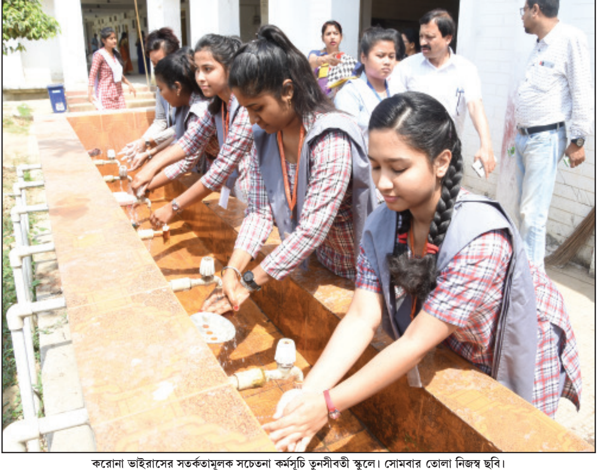
করোনা ভাইরাসের সতর্কতামূলক সচেতনা কর্মসূচি তুলসীবর্তী স্কুলে। সোমবার তোলা নিজস্ব ছবি।

২০ মার্চ ফাঁসি নির্ভর্যার দণ্ডিতদের, আজ তিহাড় জেলে আসছেন জন্মাদ