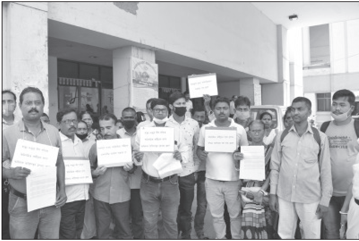
সোমবার জিবি হাসপাতালের কন্ট্রাক্টরকে কুমিল্লা নিয়মিতকরণের দাবিতে ডেপুটি প্রদান করেন।