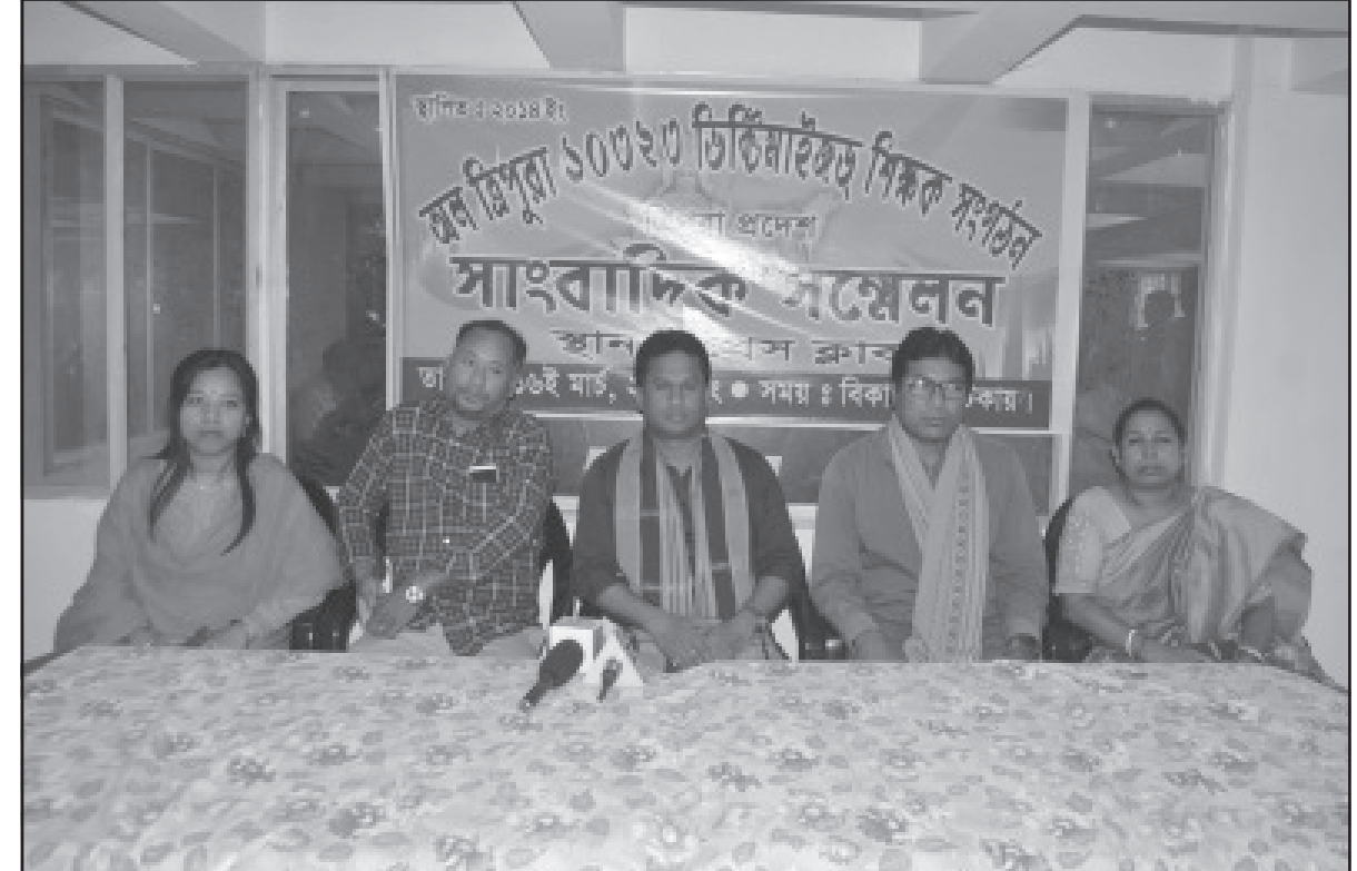
সোমবার আগরতলায় অল ত্রিপুরা ১০৩২৩ ডিক্টাইনাইজড শিক্ষক সংগঠনের পক্ষ থেকে সাংবাদিক সম্মেলনে করা হয়।