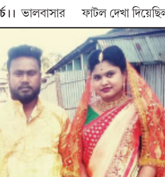
ঘটনার দারুন সাড়া পড়েছে। ঠাকুরবাড়িতে বিয়ে করার পর নবদম্পতিকে ভীষণ হাসিখুশি দেখিয়েছে।

নিজস্ব প্রতিনিধি, আগরতলা, ১৬ মার্চ। ভালবাসার দাবি নিয়ে এবার প্রেমিকা হাজির হলেন প্রেমিকের দরজায়। তাও আবার গলায় ভালবাসার দাবি লেখা প্লেকার্ড বুলিয়ে প্রেমিকের বাড়ির সামনে ৪ ঘণ্টা ধর্ষণ দিয়ে শেষে বিয়ে করেই ছাড়লেন। ধলাই জেলার কমলপুর মহকুমা হারেরখোলা এলাকায় ওই