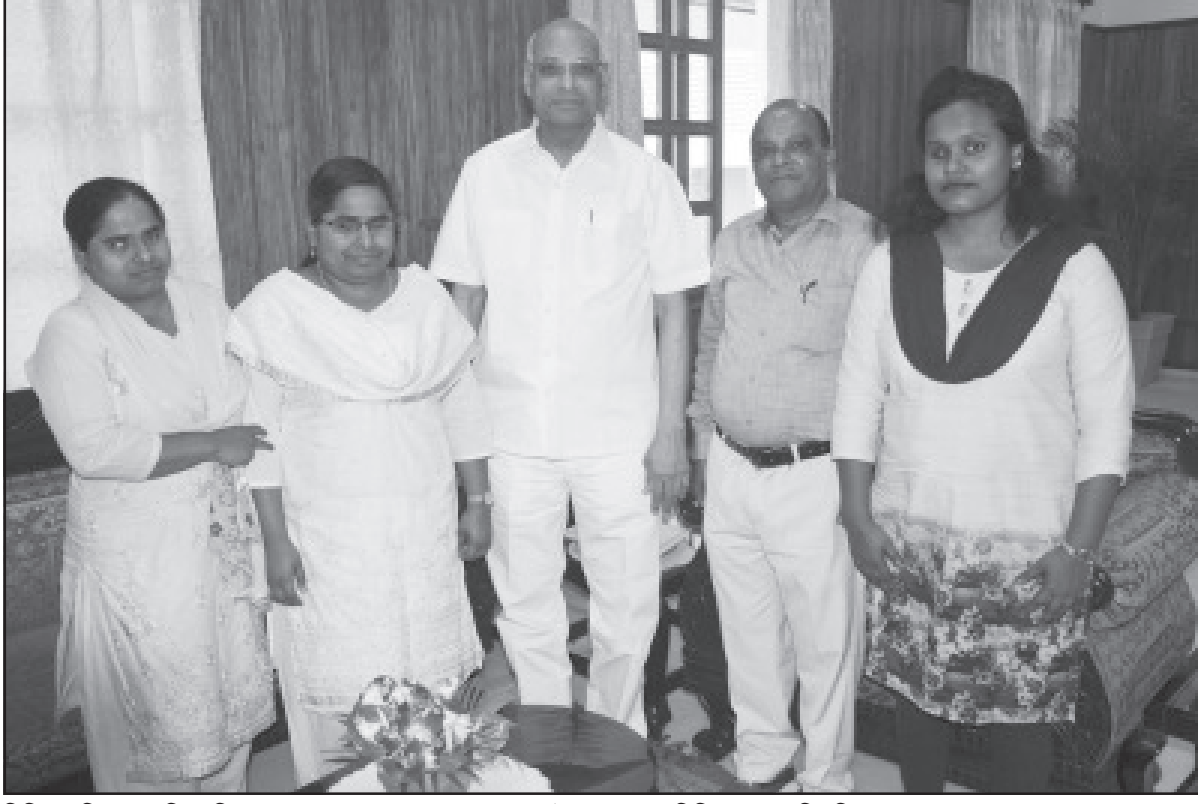
বিভিন্ন দাবি দাওয়া নিয়ে দিব্যাপ্ননার রাজভবনে রাজ্যপাল রমেশ বৈশের সাথে মিলিত হন।