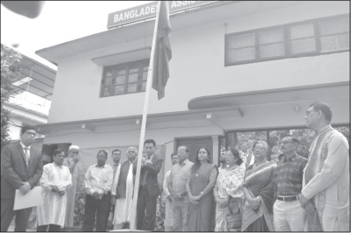
মঙ্গলবার আগরতলাস্থিত বাংলাদেশ সরকারি হাইকমিশনে বঙ্গবন্ধু শেখ মুজিবুর রহমানের জন্ম শতবার্ষিকী উদযাপিত হয়েছে।