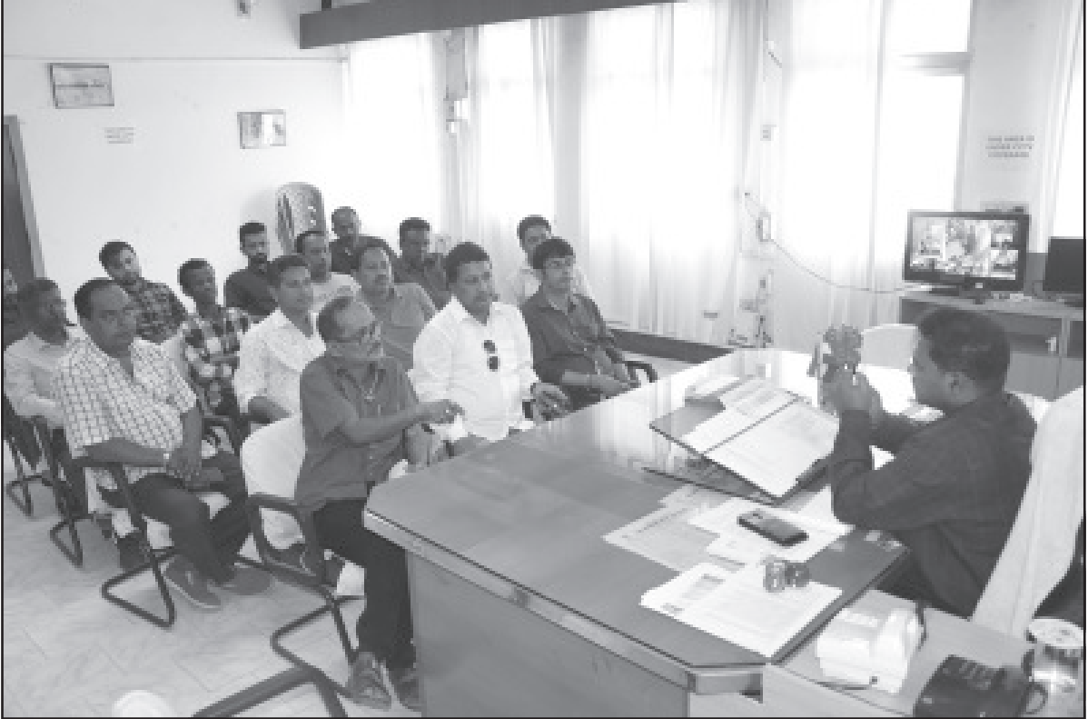
মঙ্গলবার জিবি বাজার ব্যবসায়ী সমিতি সদর মহকুমা শাসকের কাছে ডেপুটেশন প্রদান করেন।

সিডনি, ১৭ মার্চ (হি.স.): করোনা সংক্রমণ জয় করে হাসিমুখে বাড়ি ফিরলেন হলিউড অভিনেতা টম হ্যাঙ্কস। মঙ্গলবার, এখবর জানাল অস্ট্রেলীয় হাসপাতাল কর্তৃপক্ষ। এক সপ্তাহ আগে সংক্রমণ নিয়ে ভর্তি হয়েছিলেন টম এবং তাঁর স্ত্রী রীতি উইলসন। তিনি এখনও ছাড়া পাননি। একাধিক অস্বাস্থ্যজনিত অভিনেতা সম্প্রতি ব্রিসবেনের গোল্ড কোস্টে এরাডিস প্রেসলির ব্যোগ্যিকের গুটি করছিলেন। সঙ্গে ছিলেন তাঁর স্ত্রী-ও। খবর, সেখানেই করোনা ভাইরাসে আক্রান্ত হন ৬৩ বছরের দম্পতি। গুটিংয়ের পাশাপাশি গায়ক, গীতিকার ইউলসনের ব্রিসবেনে একটি অনুষ্ঠানে যোগানোর কথা ছিল। কিন্তু করোনা সংক্রমণ তাঁর শরীরে মিলতেই বাতিল করা হয় সেই অনুষ্ঠান। সঙ্গে সঙ্গে হাতপাতা স্বেচ্ছা কর্তৃক করা হয় দম্পতীকে। যাতে তাঁদের থেকে সংক্রমণ অন্যদের মধ্যে না ছড়ায়। স্থানীয় সংবাদমাধ্যমকে দেওয়া এক সাক্ষাৎকারে টম জানিয়েছেন, সংক্রমণ ছড়াতেই যেভাবে তাঁদের যত্ন নিয়েছে হাসপাতাল কর্তৃপক্ষ সত্যিই তা প্রশংসার যোগ্য।