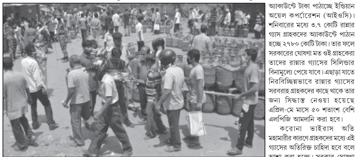
বর্তমানে একটি এজেন্সিতে গ্রাহকদের ভিড়।

নিজস্ব প্রতিনিধি, আগরতলা, ১০ এপ্রিল। করোনা ভাইরাসের মোকাবিলায় চালু হওয়া প্রধানমন্ত্রী গরিব কল্যাণ যোজনায় সমস্ত উজ্জ্বলা গ্রাহকদের এপ্রিল, ২০২০ এর মধ্যে প্রতি মাসে একটি করে মোট তিনটি রাম্মার গ্যাস সিলিগুরি বিনামূল্যে দেওয়া হবে। এই যোজনা অনুযায়ী